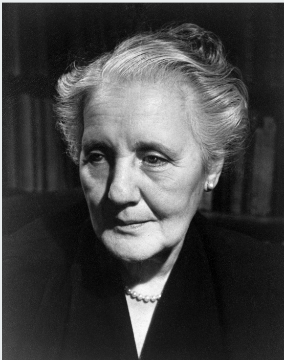
Мелани Кляйн/Melanie Klein (1882-1960) - влиятельный британский психоаналитик еврейского происхождения, стоявшая у истоков детского психоанализа, игровой психоаналитической терапии и теории объектных отношений.