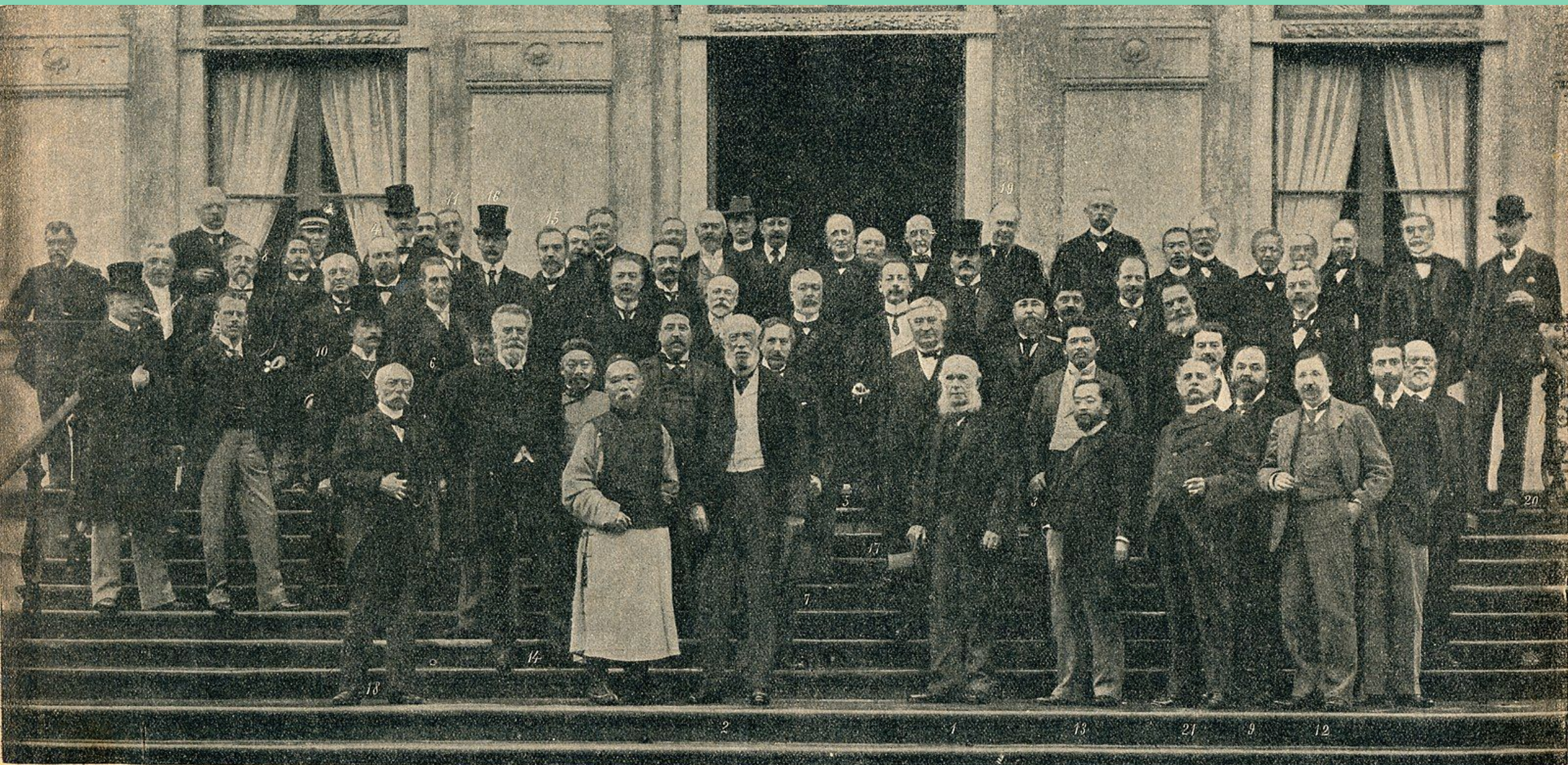
1) Баронъ Стааль (Россія). 2) Графъ Мюнстеръ (Германія). 3) Фіатурига (Сіамъ). 4) Бельдиманъ (Румынія). 5) Баронъ Ифаяши (Японія). 6) Баронъ Вельзерсгеймбъ (Австро-Венгрія). 7) ванъ-Карнебеекъ (Нидерланды). 8) Билле (Данія). 9) Буржуа (Франція). 10) Понсефортъ (Англія). 11) Ардокъ (Англія). 12) Рафаловичъ (Россія). 13) Матоно (Японія). 14) де-Грелль-Рожеъ (Бельгія). 15) Паленку (Румынія). 16) Сить Лоу (Соед. Штаты Сѣв. Амер.). 17) Бернаэртъ (Бельгія). 18) донъ-Бееръ (Португаль). 19) Рохуссенъ (Нидерланды). 20) Баронъ Шиммельпеннинкъ (Нидерланды). 21) Цанине (Италія). 22) Гоо Вей-Те (Китай).