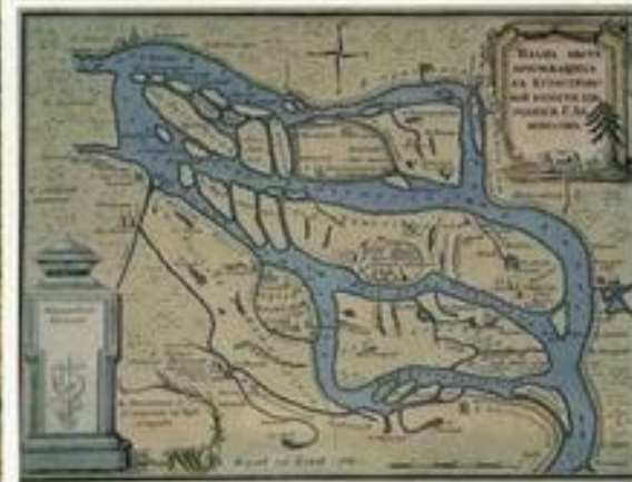
Карта берега между Архангельском и Хантояркой из книги «Путешествие академика Ивана Лавровского. 1805 г.

Беломорский край, в котором родился М.В. Ломоносов, был в экономическом и культурном отношении одним из развитых районов России