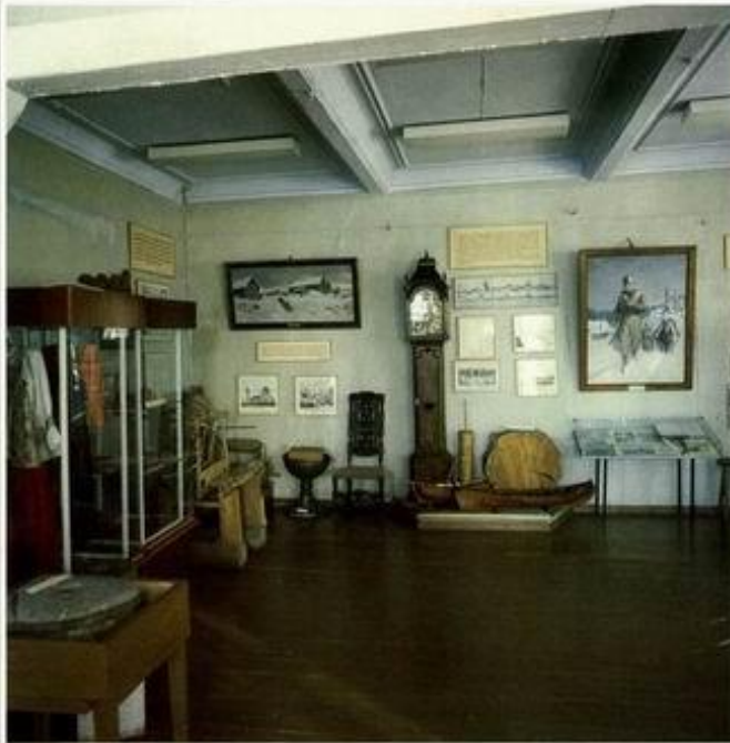
Экспозиция Музея М.В.Ломоносова в Ленинграде

Указом Президиума Верховного Совета РСФСР город Ораниенбаум Ленинградской области в 1948 году был переименован в Ломоносов. Именем великого ученого названы: горный подольный хребет в бассейне Северного Ледовитого океана, кратер на видимой стороне Луны, одна из малых планет и минерал.