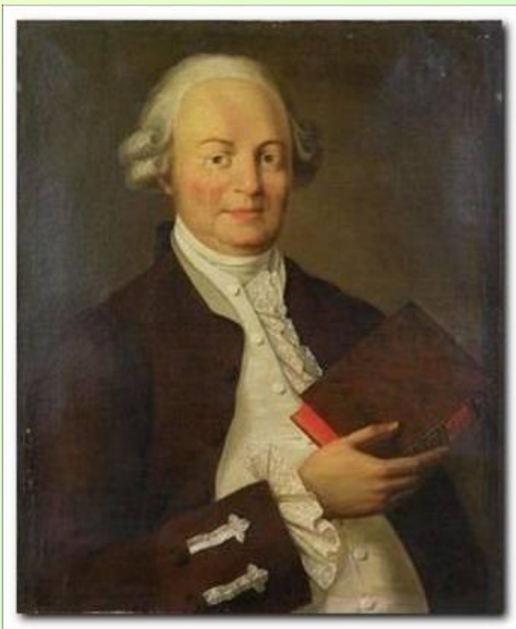
Василий Кириллович Тредиаковский