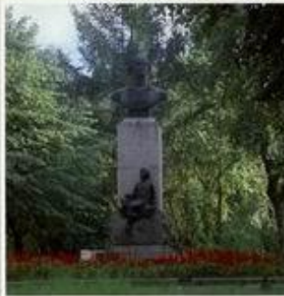
Памятник М.В.Ломоносову в г.Ленинграде. Скульптор Г.Д.Сидоров, 1955 г.

Указом Президиума Верховного Совета РСФСР город Ораниенбаум Ленинградской области в 1948 году был переименован в Ломоносов. Именем великого ученого названы: горный подольный хребет в бассейне Северного Ледовитого океана, кратер на видимой стороне Луны, одна из малых планет и минерал.