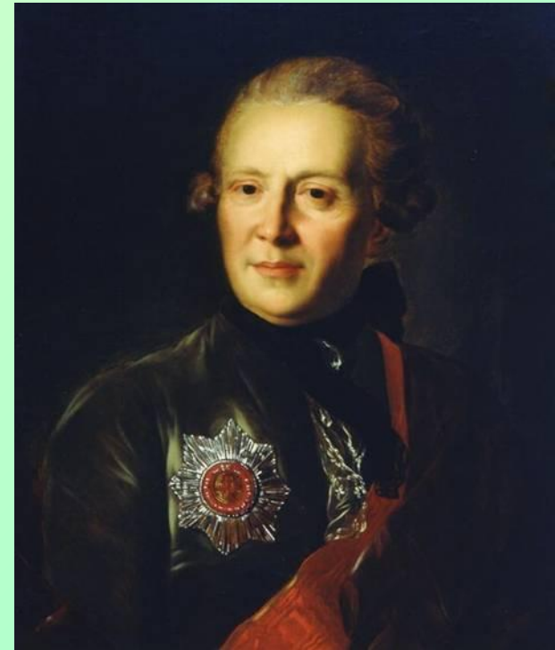
Александр Петрович Сумароков