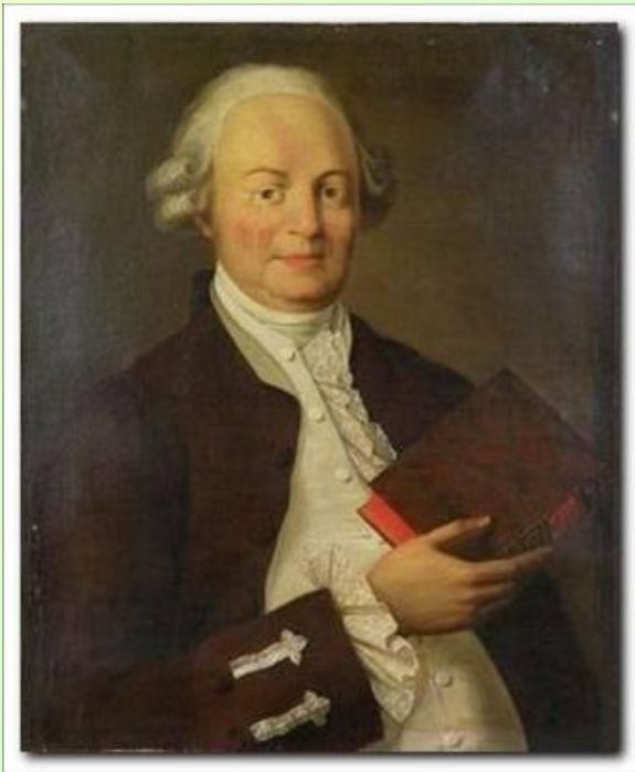
Василий Кириллович Тредиаковский