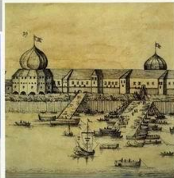
Фрагмент панорамы Архангельска. Голландская гравюра. XVIII в. Архангельский областной краеведческий музей