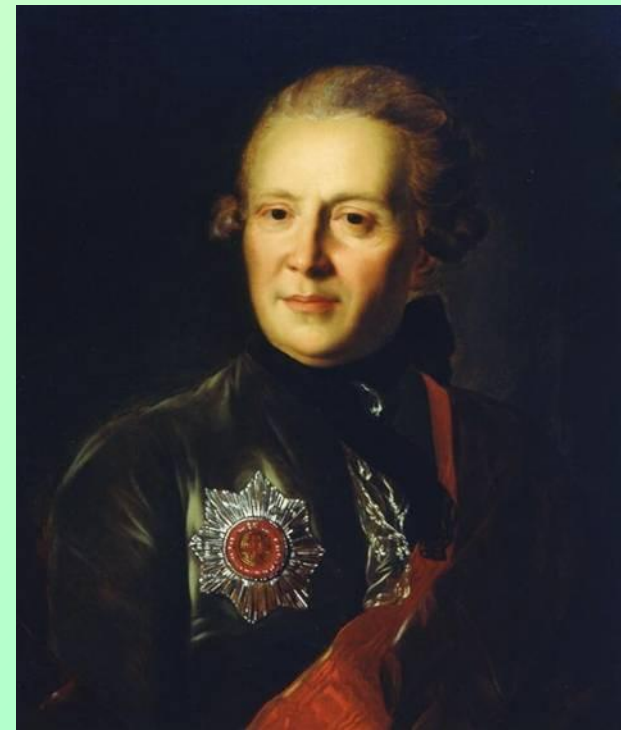
Александр Петрович Сумароков