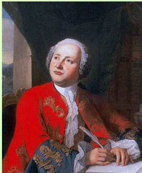
Михаил Васильевич Ломоносов