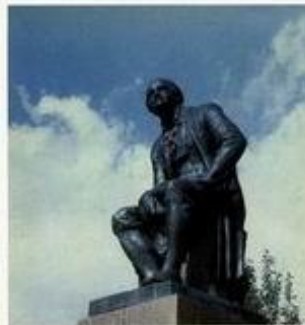
Памятник М.В.Ломоносову в г.Ленинграде. Скульптор И.И.Колосовский, 1955 г.