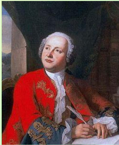
Михаил Васильевич Ломоносов