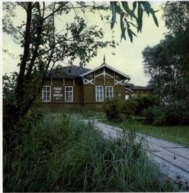
Экспозиция Музея М.В.Ломоносова в г.Ленинграде