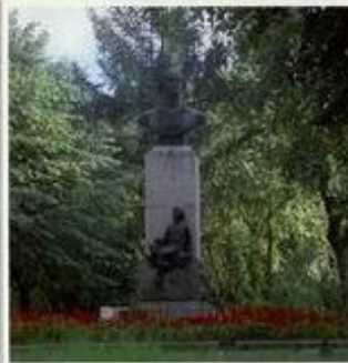
Памятник М.В. Ломоносову в г. Ломоносов. Скульптор Г.Д. Сидоров, 1955 г.

Указом Президиума Верховного Совета РСФСР город Ораниенбаум Ленинградской области в 1948 году был переименован в Ломоносов. Именем великого ученого названы: горный подвальный хребет в бассейне Северного Ледовитого океана, кратер на видимой стороне Луны, одна из малых планет и минерал.