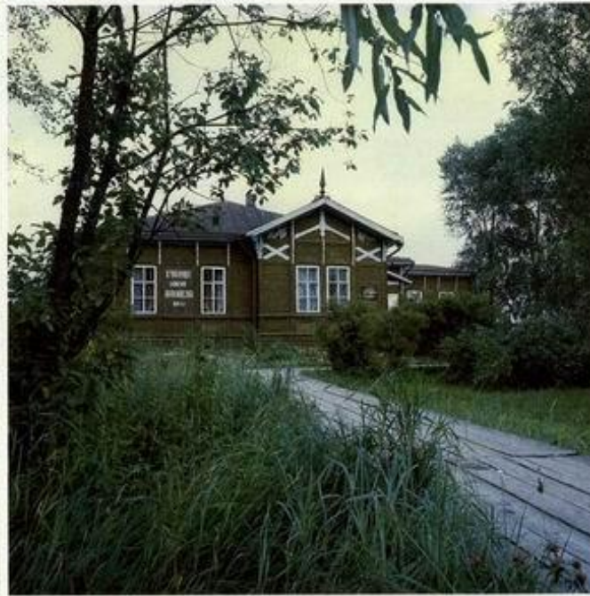
Экспозиция Музея М.В.Ломоносова в г.Ленинграде