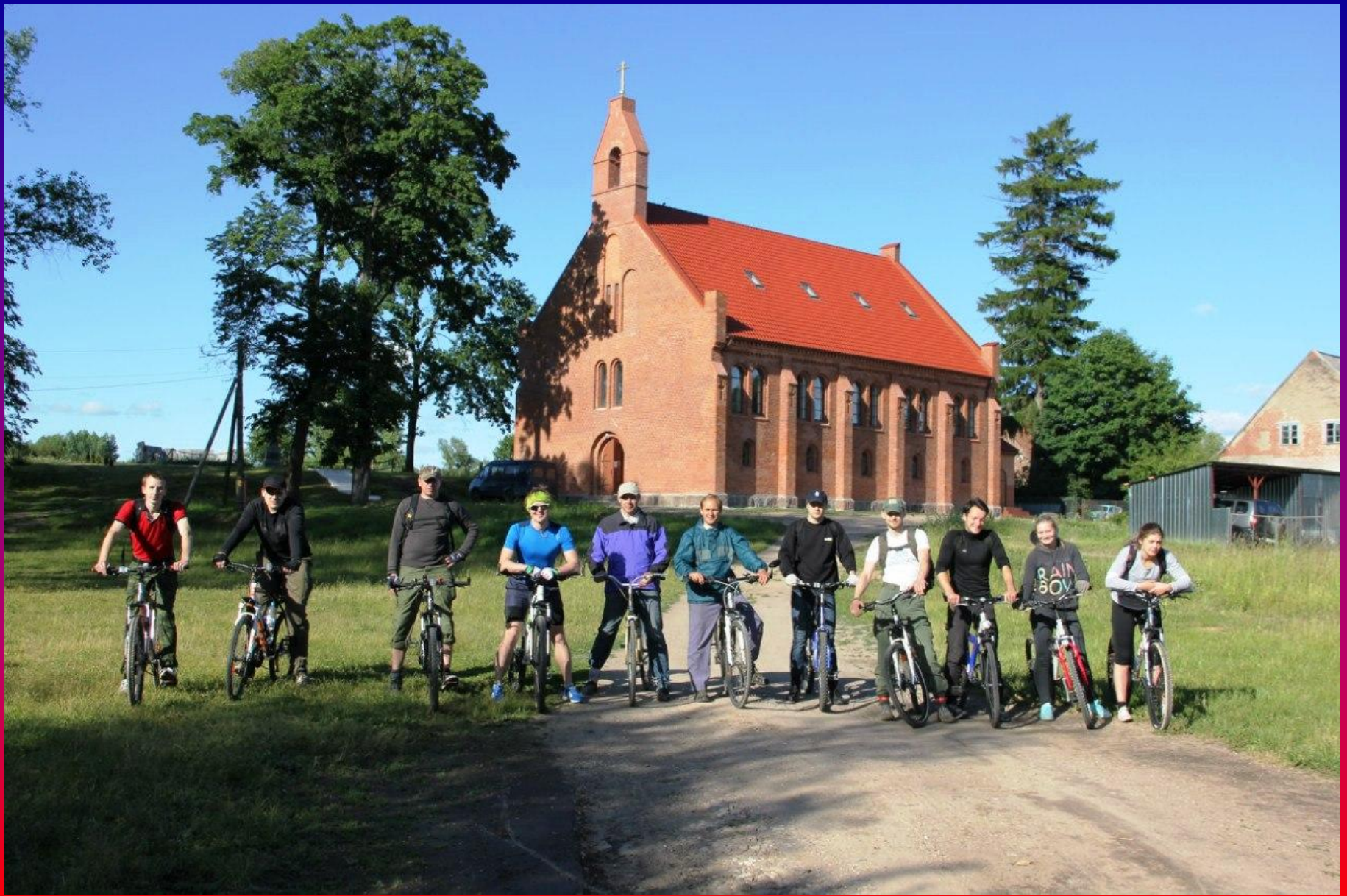
Восстановленная кирха в Краснолесье