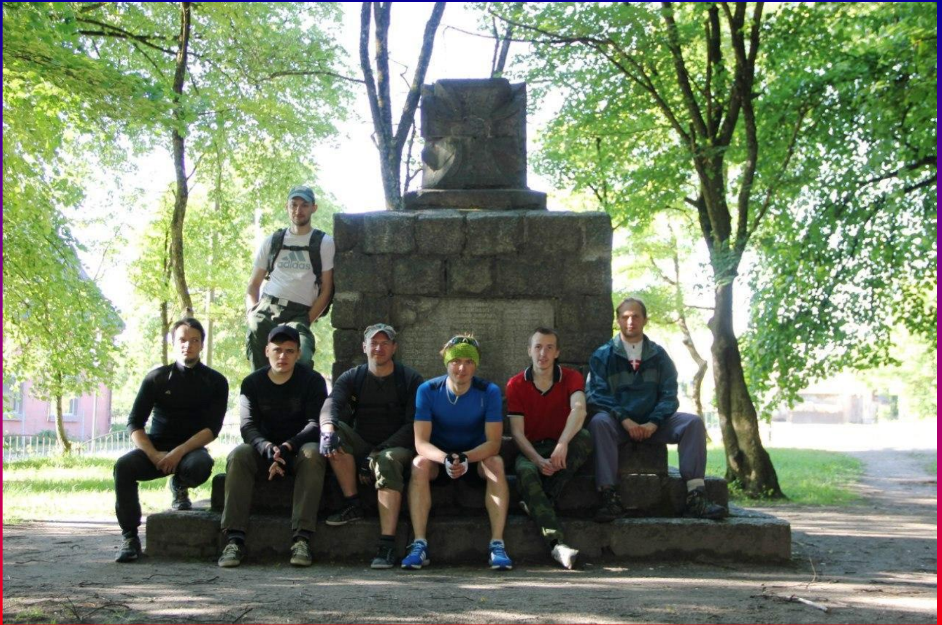
Памятник Первой Мировой войне в Краснолесье