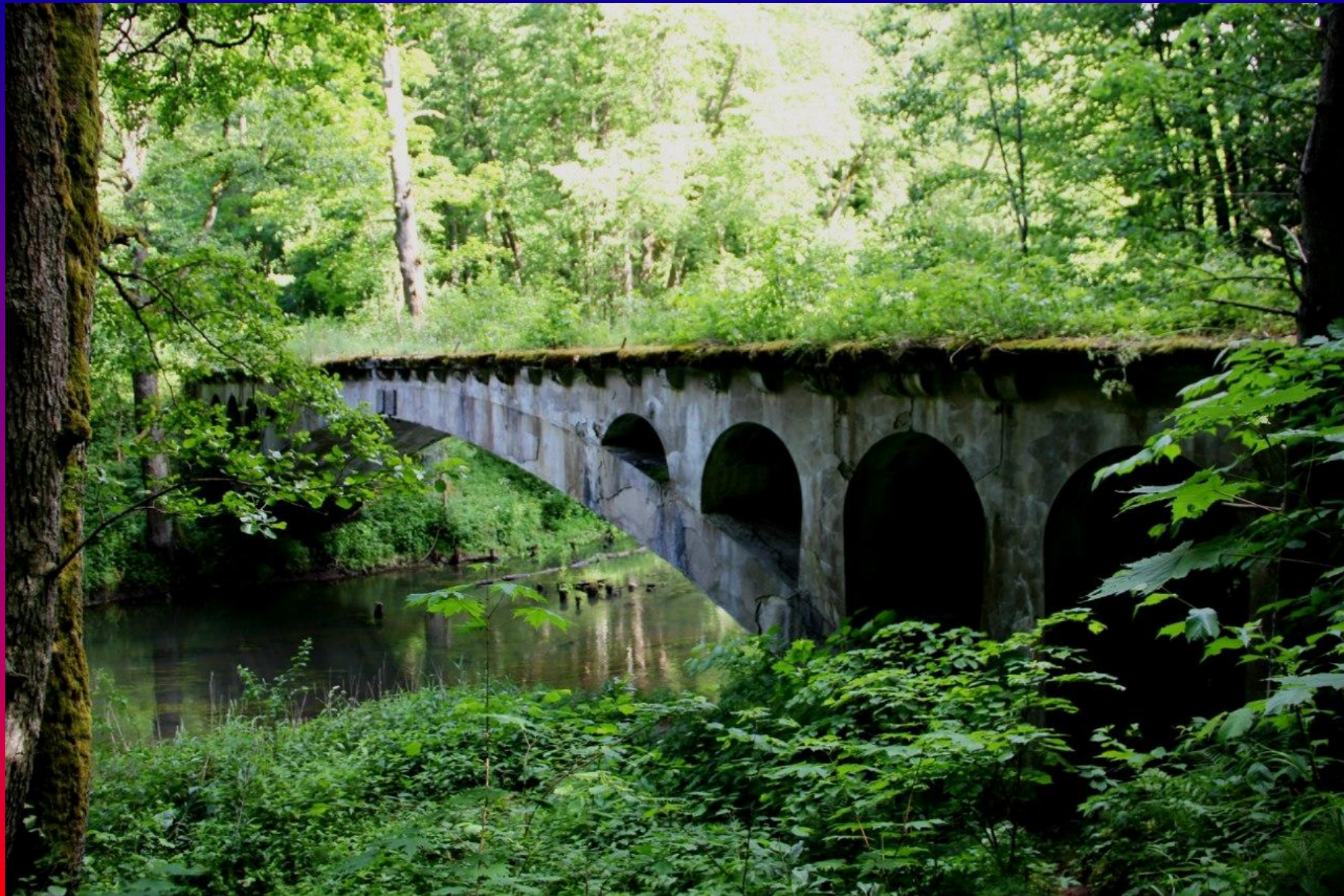
Один из старинных мостов через р. Красная