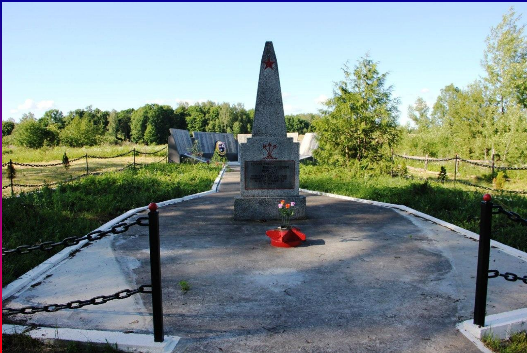
Памятник героям Великой Отечественной войны