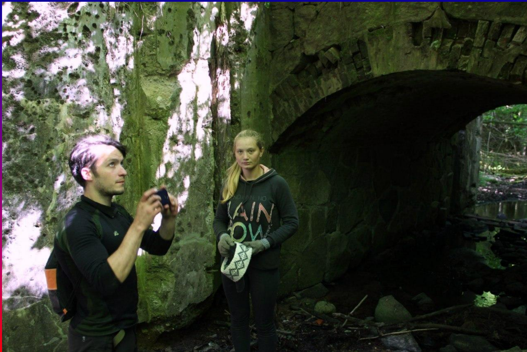
Под старинным мостом