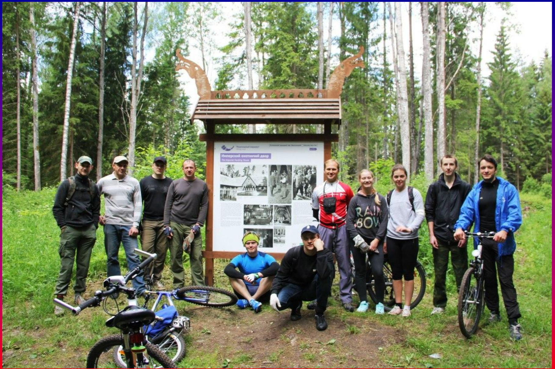
У информационного стенда на месте охотничьей резиденции кайзера