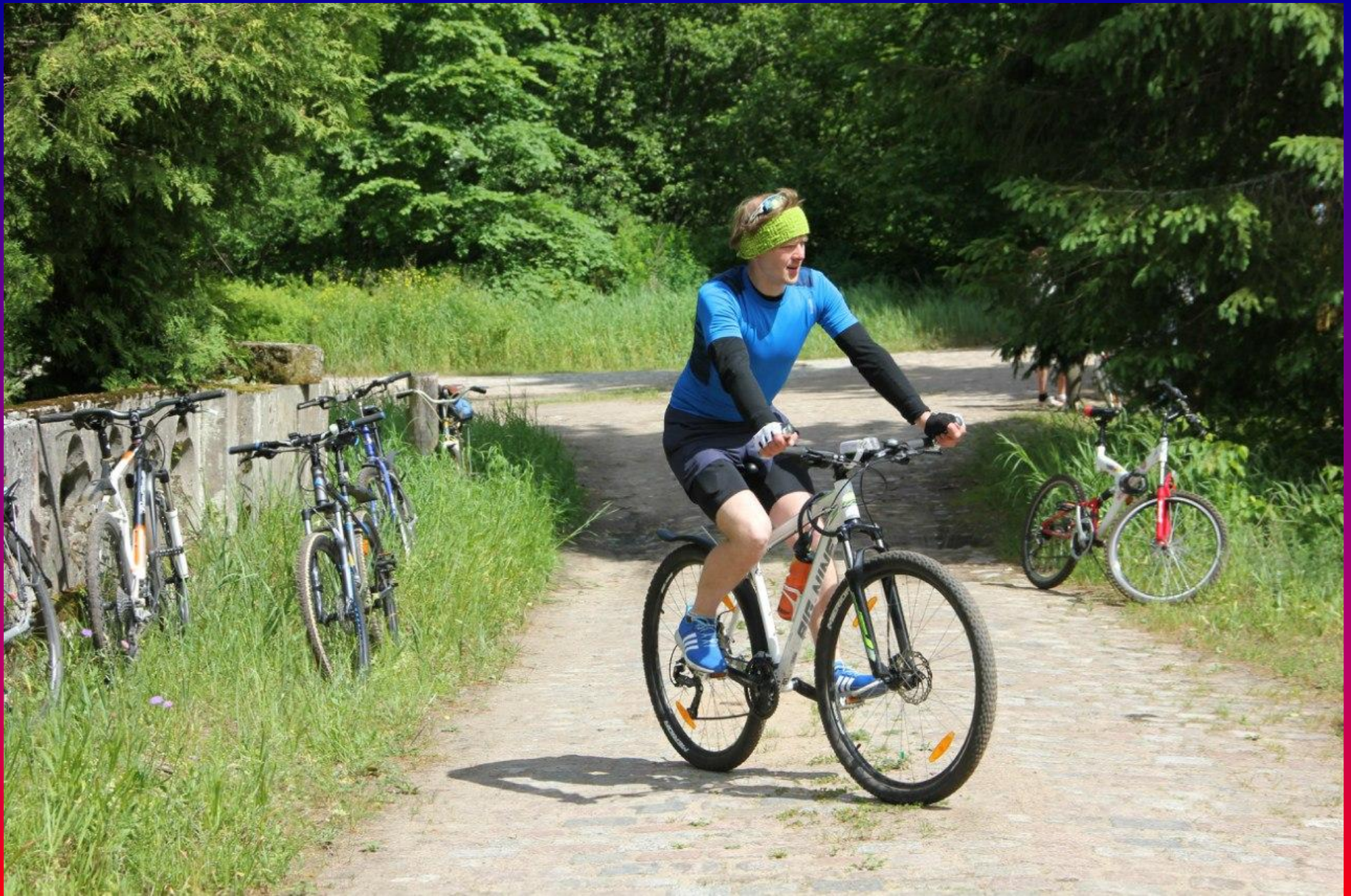
Андрюха на своем агрегате