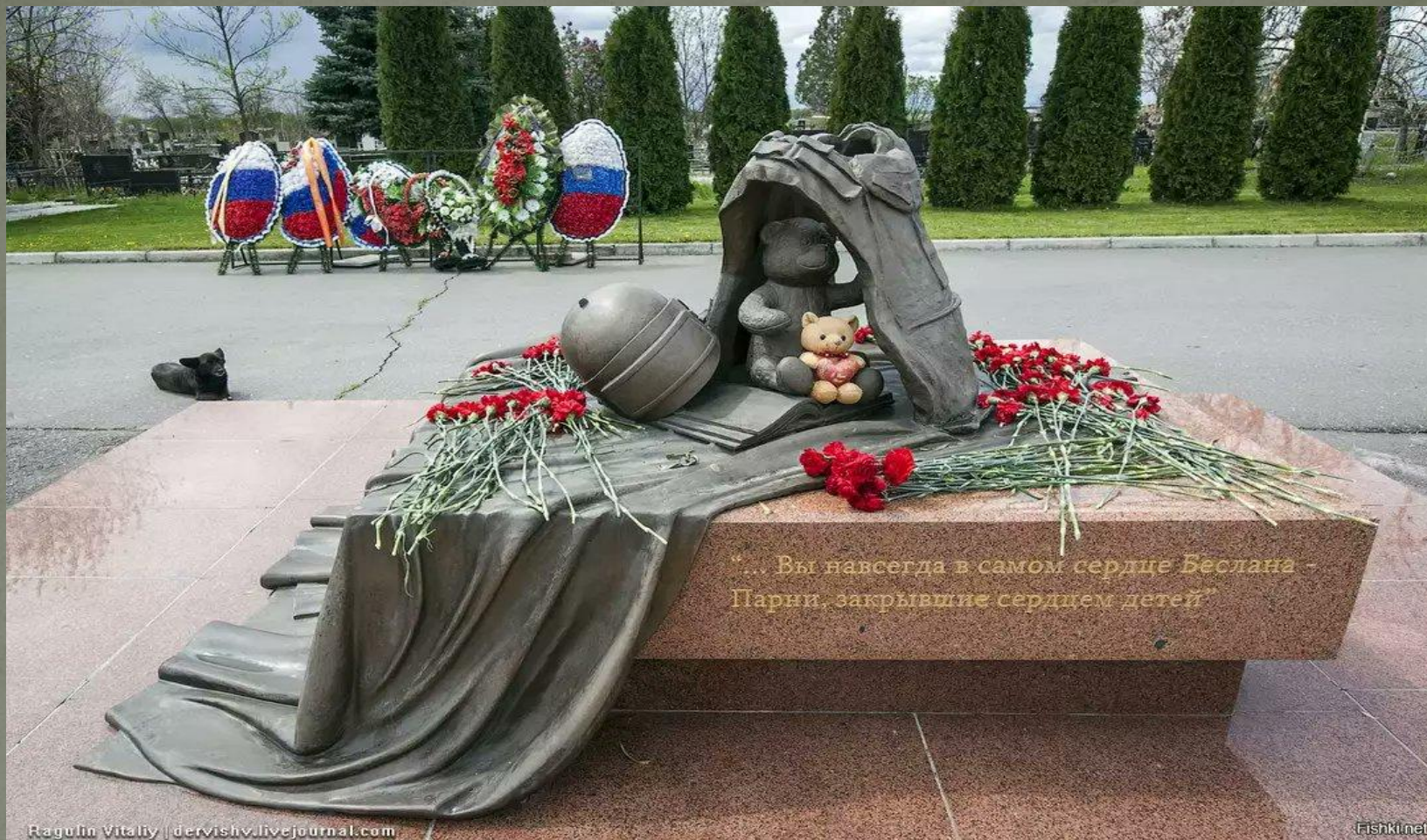
Памятник российским спецназовцам, погибшим при освобождении детей в Беслане.