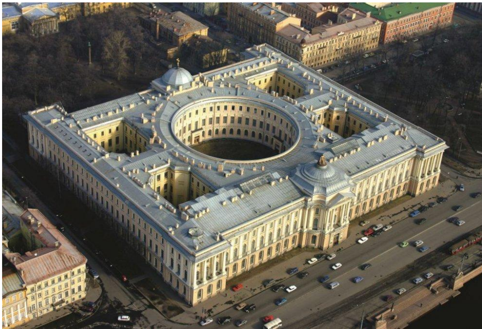
Академия художеств в Санкт-Петербурге