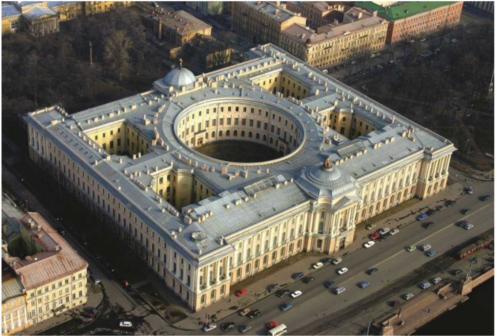
Академия художеств в Санкт-Петербурге