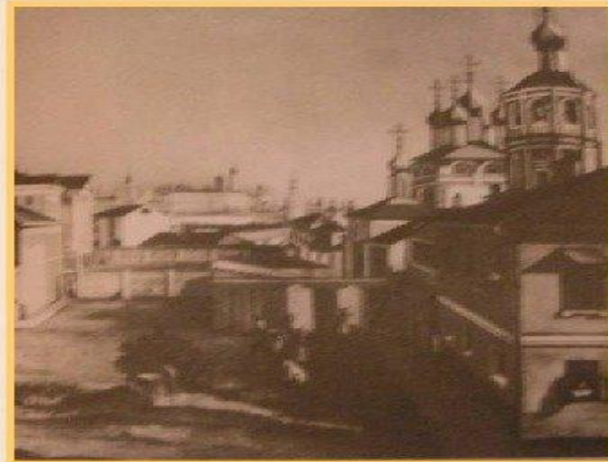
Деревня Новосёлки Орловской губернии