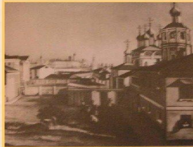
Деревня Новосёлки Орловской губернии