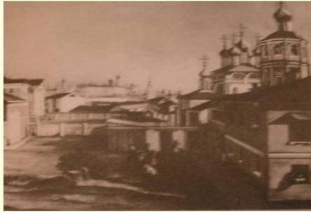
г. Мценск, XIX век

Афанасий Фет родился 23 ноября 1820 г. в деревне Новоселки Орловской губернии недалеко от города Мценска в родовом имении отца, Афанасия Неофитовича Шеншина.