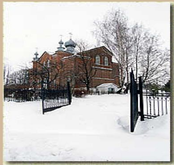
Церковь в селе Клейменове, где похоронен А.А. Фет.

Умер А. Фет 21 ноября (3 декабря н.с.) 1892 в Москве. По некоторым данным, его смерти от сердечного приступа предшествовала попытка самоубийства. Через три дня, 24 ноября, произошел обряд отпевания. Отпевали в университетской церкви. Потом гроб с телом Фета отвезли в село Клейменово Мценсконо уезда Орловской губернии, родовое имение Шеншиных. Там Фета и похоронили.