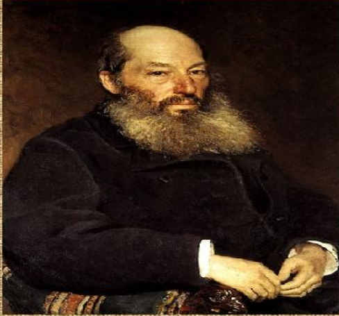
Портрет Фета кисти И.Е.Репина

В 1873 г. за Фетом была утверждена фамилия отца со всеми связанными с нею правами. Он получает дворянство и становится дворянином Шеншиным.