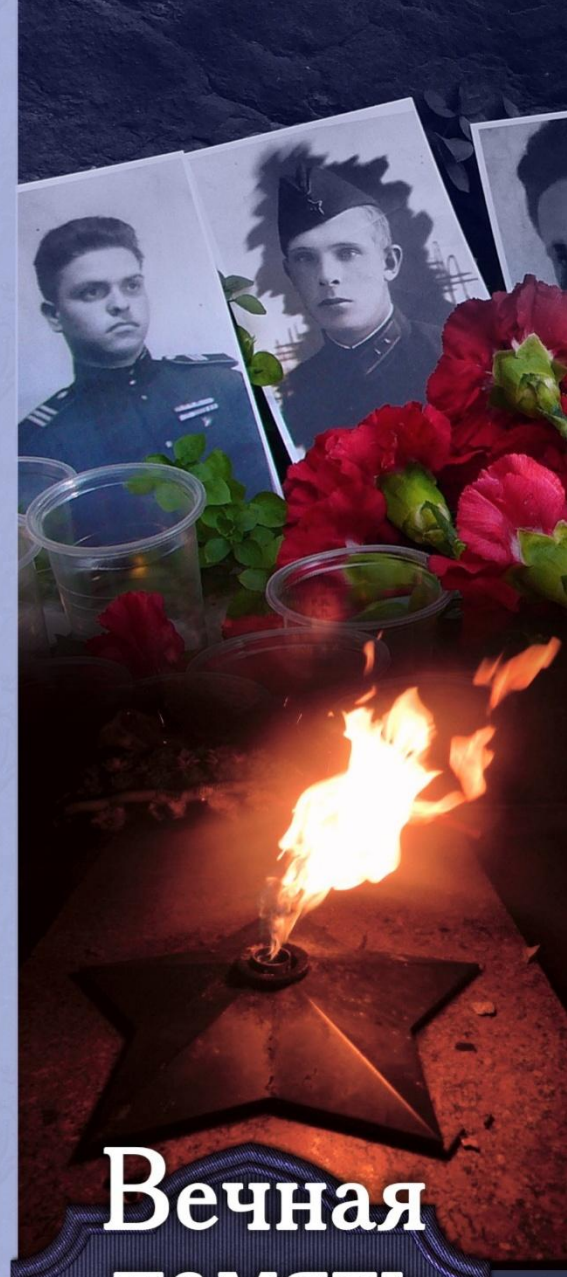
Фото Андрея Мурылева, май 2009.

Памятник П.М.Гаврилову установлен в городе Бресте (Белоруссия) на гарнизонном (мемориальном) кладбище. Установлен в 1981 году. Скульптор В.Летун, архитектор Ю.Казаков.