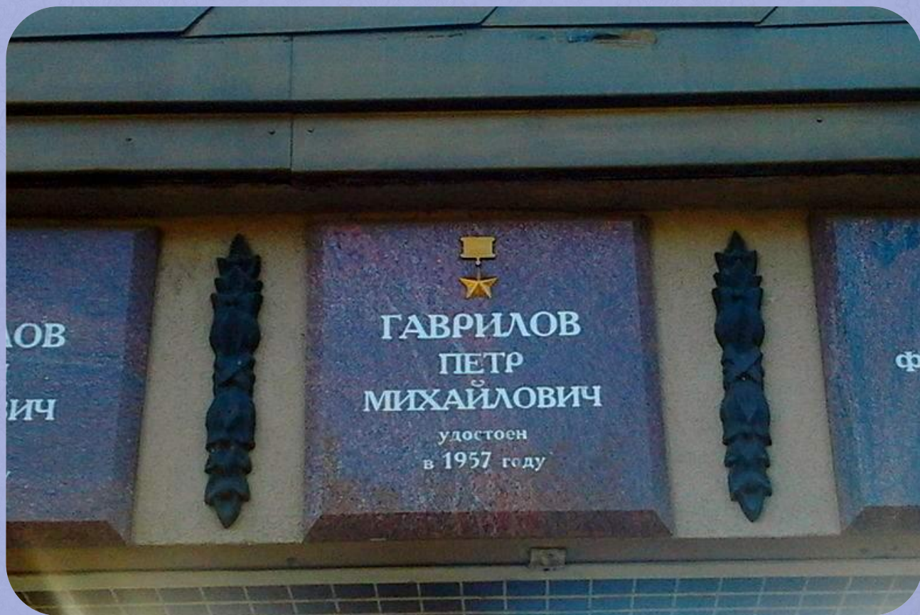
Мемориальная табличка в казанском Парке Победы