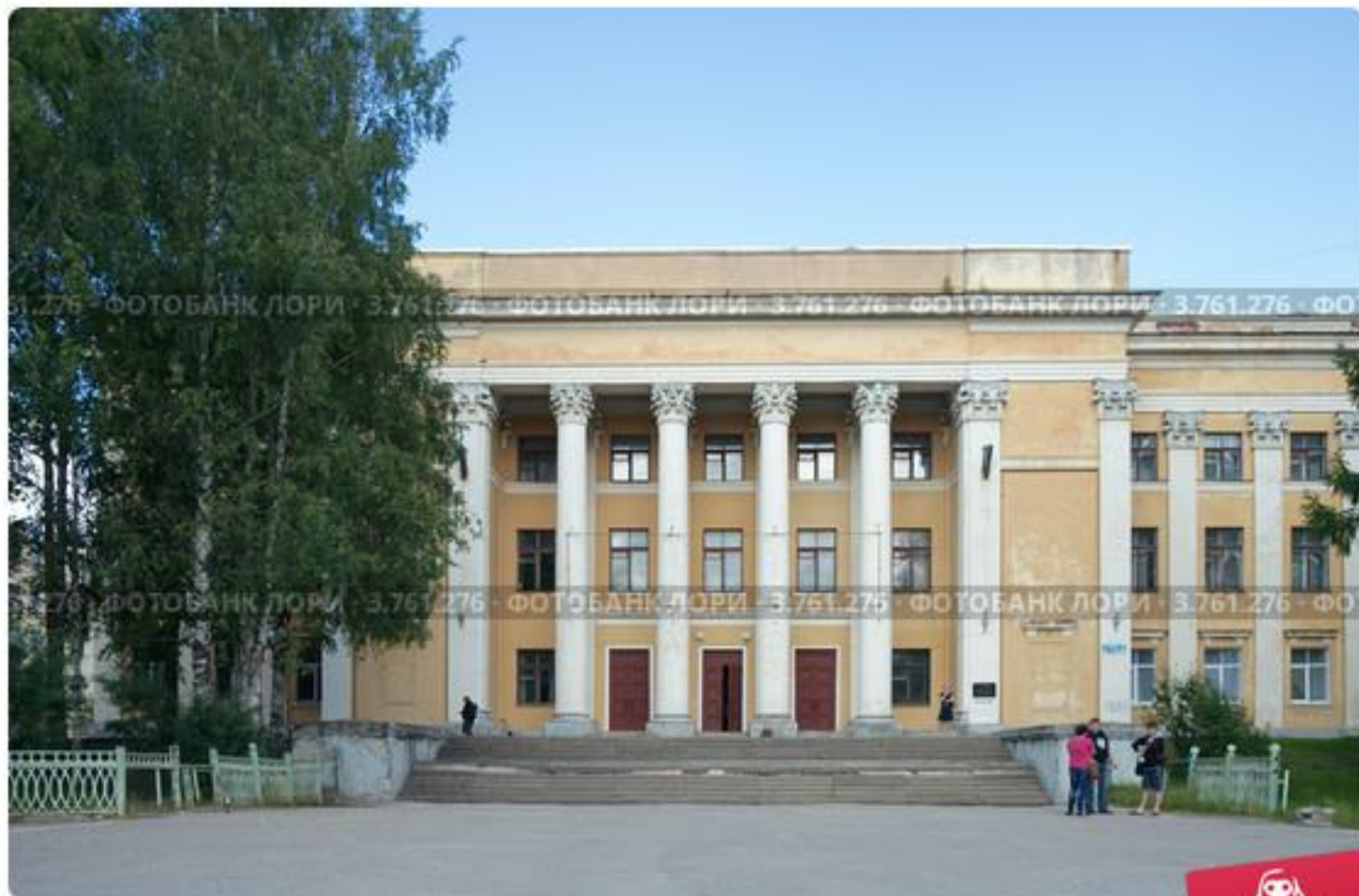
Центр культуры и досуга (дом культуры) в городе Сегеже (Карелия)