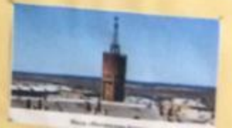
Сыктывкар, Собор Святого Иеронима и Иеронимовский монастырь