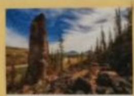
Родовое дерево Национальный парк