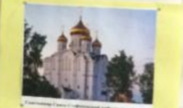
Сыктывкар, Собор Святого Иеронима и Иеронимовский монастырь