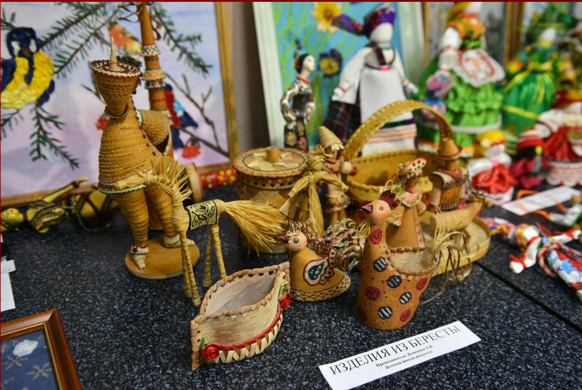
ИЗДЕЛИЯ ИЗ БЕРЕСТЫ Промодельщик: Демкина Т.Н. Детская школа искусств