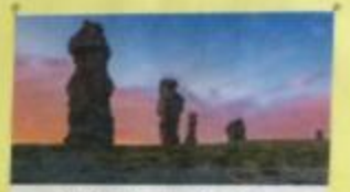
Камни в долине восточных берегов Ижора