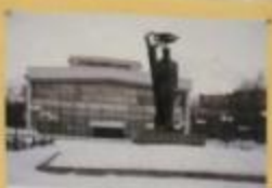
Сыктывкар, Центр культуры и искусства Республики Коми