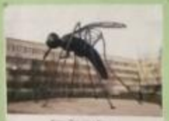
Город Троицкий Сельск