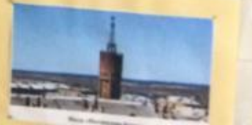
Исторический район Ижора