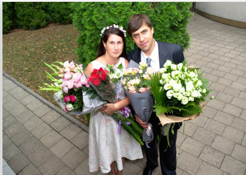
Свадьба дочери. Август, 2018г.