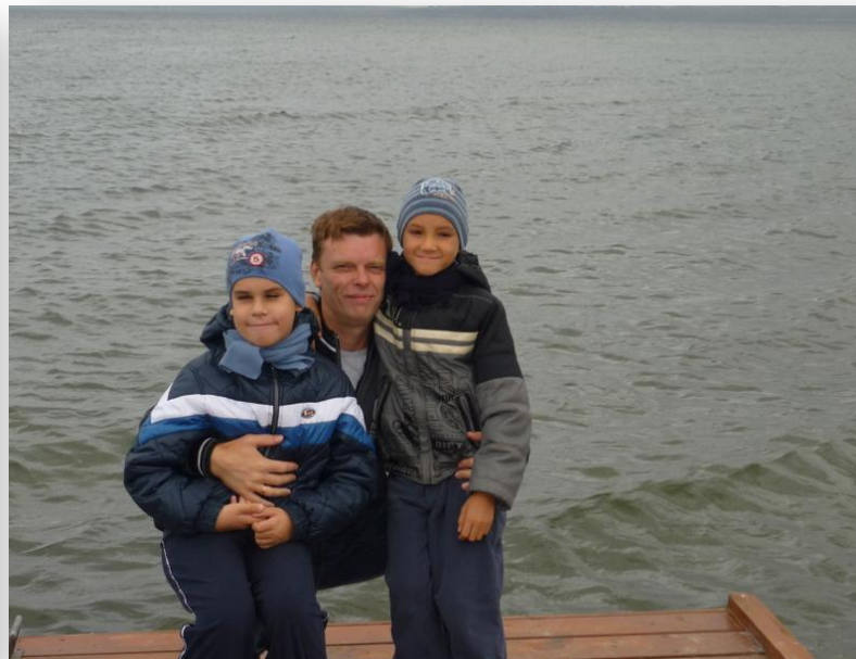
Осень 2011 года. Переславль- Залесский. Плещеево озеро.