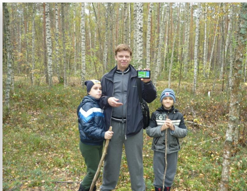
Осень 2012 года. С папой и навигатором в лесу не заблудимся!