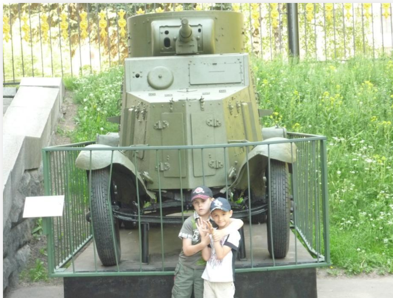
Лето 2011 года. Музей военной техники в Москве.