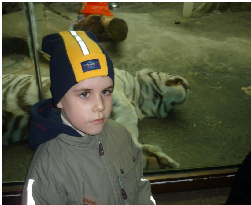
Московский зоопарк. Апрель 2010 года.