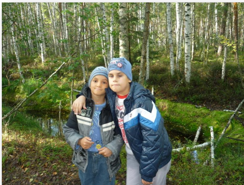
Осень 2012 года, лес.