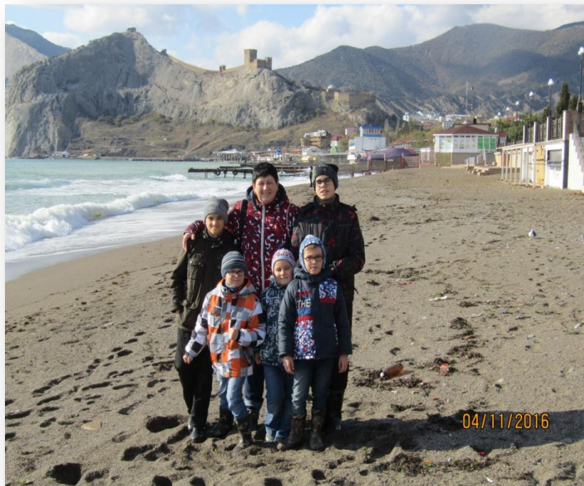
Осень 2016года, Судак, Крым.