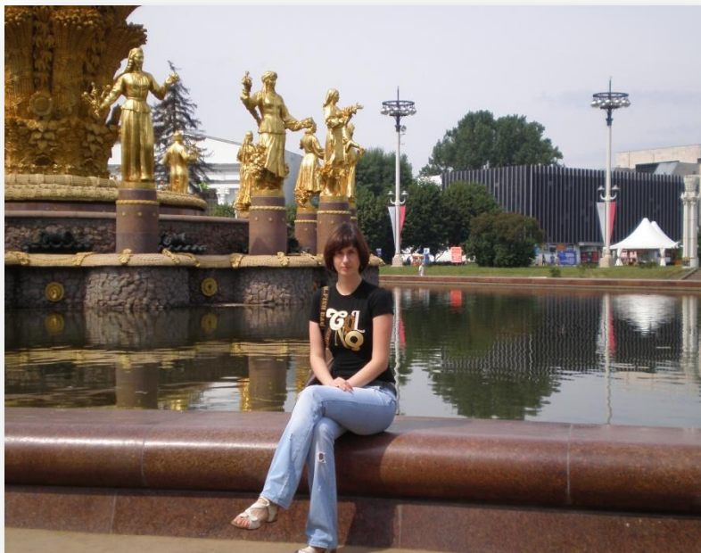
Дочь Евгения, 2009г. ВДНХ

НЕ МОГУ СКАЗАТЬ, ЧТО НАША ДОЧЬ И МОЯ МАМА, БЫЛИ «В ВОСТОРГЕ» ОТ НАШЕГО С МУЖЕМ РЕШЕНИЯ. НО НАМ С МУЖЕМ ВСЕ ЖЕ УДАЛОСЬ УБЕДИТЬ ИХ В ПРАВИЛЬНОСТИ И ВЗВЕШЕННОСТИ НАШЕГО РЕШЕНИЯ.