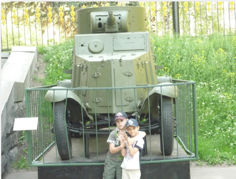
Лето 2011 года. Музей военной техники в Москве.