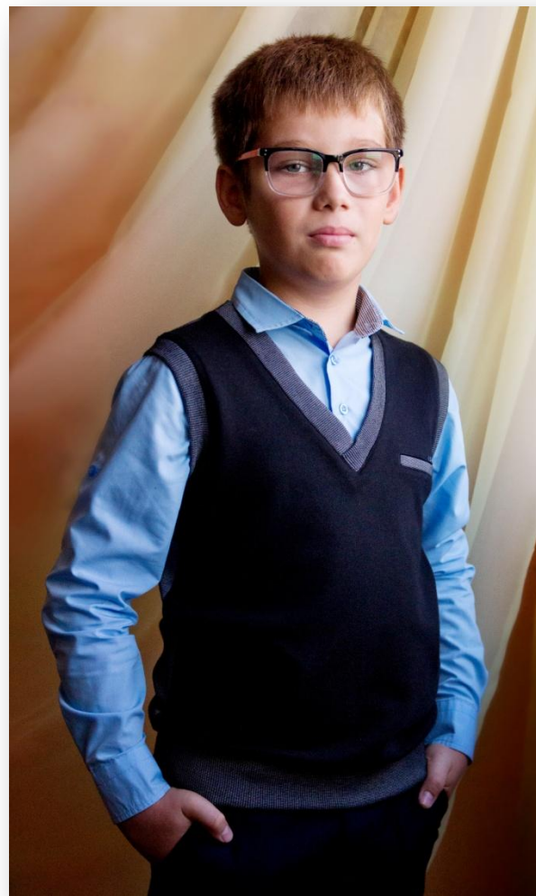
Сереза-младший, 11 лет.