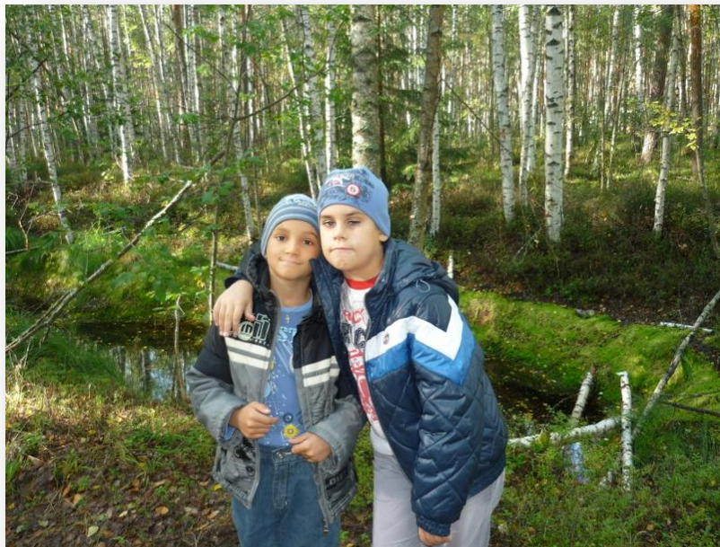
Осень 2012 года, лес.