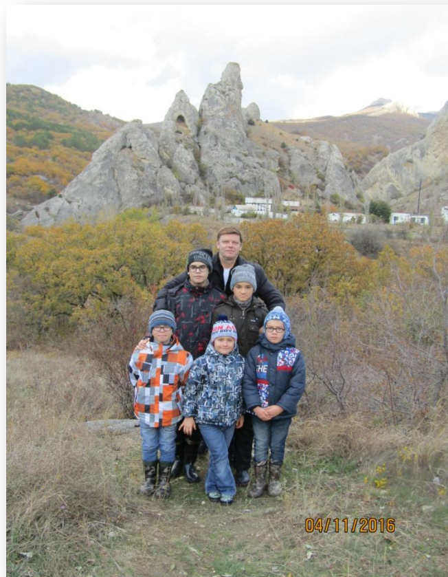
Осень 2016 года, Солнечная Долина, Крым.