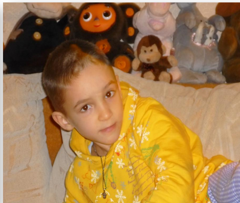
Сереза, 7 лет.