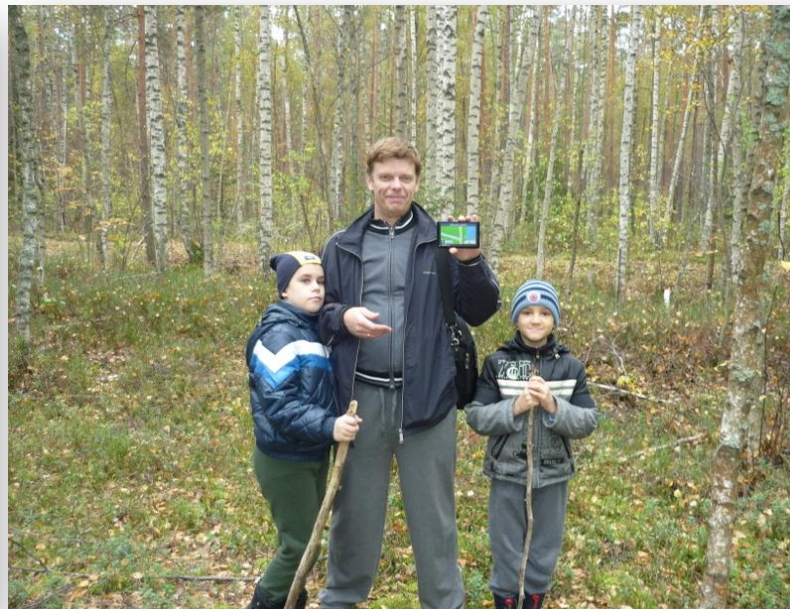
Осень 2012 года. С папой и навигатором в лесу не заблудимся!