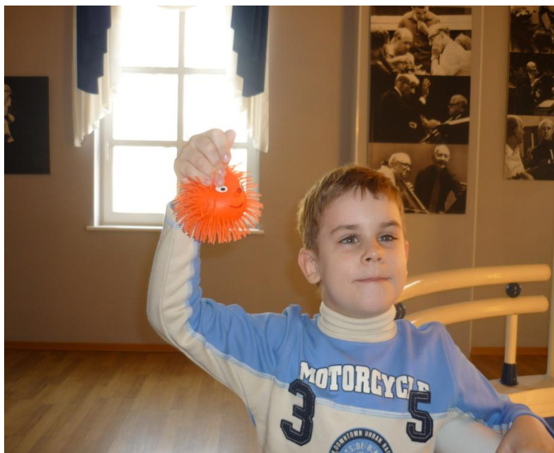
Центр Галины Вишневской, после концерта. Апрель 2010года.

ПОСЛЕ ОПЕРАЦИИ ОСТАЛИСЬ, К СОЖАЛЕНИЮ, СЕРЬЕЗНЫЕ ПОСЛЕДСТВИЯ, СЛИШКОМ БОЛЬШОЙ И «АГРЕССИВНОЙ» БЫЛА ОПУХОЛЬ. ЖЕНЕ ПРИШЛОСЬ ПЕРЕНЕСТИ ЕЩЕ НЕСКОЛЬКО ОПЕРАЦИЙ ПО ВОССТАНОВЛЕНИЮ И СОХРАНЕНИЮ ЗРЕНИЯ, КУРСЫ РЕАБИЛИТАЦИИ И ПРОВЕРКИ МЫ РЕГУЛЯРНО ПРОХОДИМ И ПО СЕЙ ДЕНЬ. НО ЖИЗНЬ ПРОДОЛЖАЕТСЯ, И НАШ СЫН КАЖДЫЙ ДЕНЬ РАДУЕТ НАС.