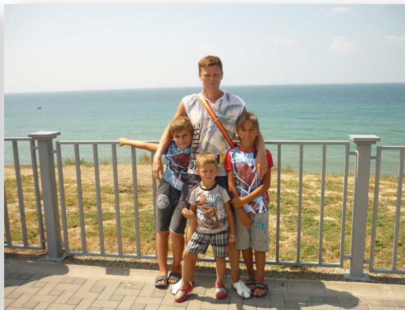
Лето 2013года. Анапа, Высокий берег, у маяка.