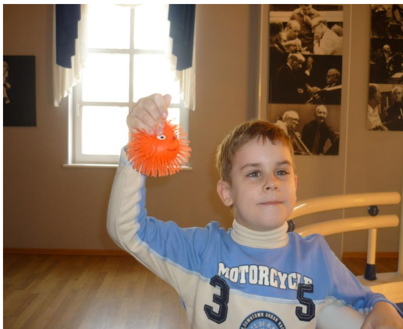
Центр Галины Вишневской, после концерта. Апрель 2010 года.

ПОСЛЕ ОПЕРАЦИИ ОСТАЛИСЬ, К СОЖАЛЕНИЮ, СЕРЬЕЗНЫЕ ПОСЛЕДСТВИЯ, СЛИШКОМ БОЛЬШОЙ И «АГРЕССИВНОЙ» БЫЛА ОПУХОЛЬ. ЖЕНЕ ПРИШЛОСЬ ПЕРЕНЕСТИ ЕЩЕ НЕСКОЛЬКО ОПЕРАЦИЙ ПО ВОССТАНОВЛЕНИЮ И СОХРАНЕНИЮ ЗРЕНИЯ, КУРСЫ РЕАБИЛИТАЦИИ И ПРОВЕРКИ МЫ РЕГУЛЯРНО ПРОХОДИМ И ПО СЕЙ ДЕНЬ. НО ЖИЗНЬ ПРОДОЛЖАЕТСЯ, И НАШ СЫН КАЖДЫЙ ДЕНЬ РАДУЕТ НАС.