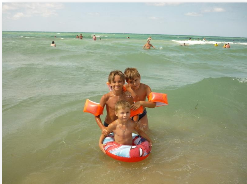
Лето 2013года. Витязево. Анапа.