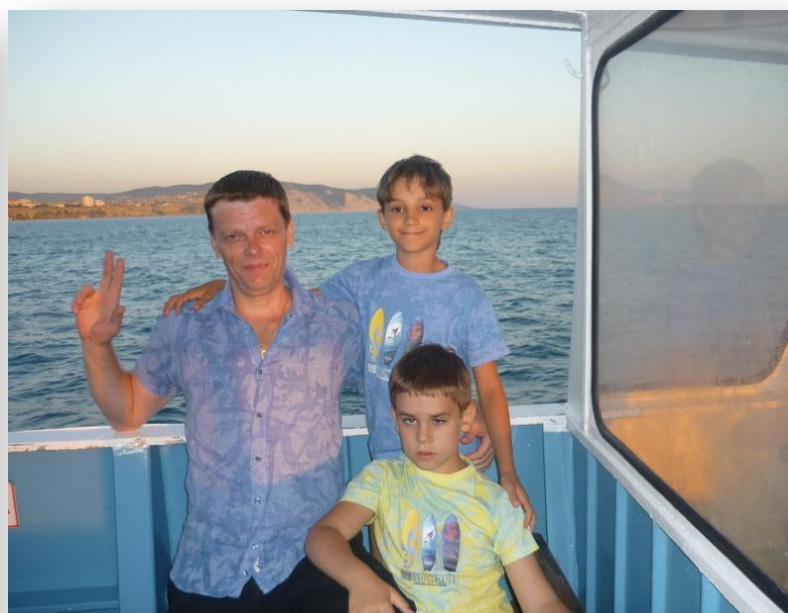
Лето 2012 года, Анапа. На катере.