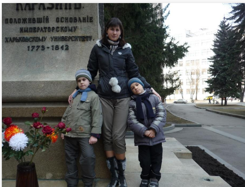
Весна 2012года. Старшая сестра с младшими братьями.