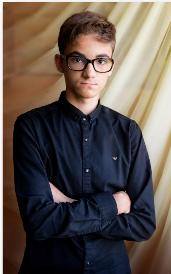
Сереза-старший, 16 лет.