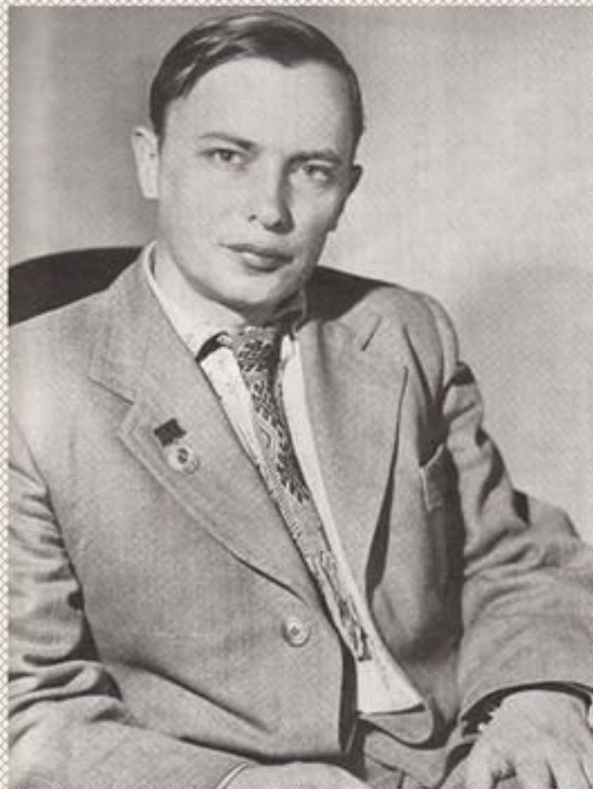
А. Куляшоў - лаўрэат Дзяржаўнай прэміі СССР. Мінск, 1946 г.

У 1946 годзе ён становіцца лаўрэатам Дзяржаўнай прэміі СССР за паэму «Сцяг брыгады», а ў 1949 годзе паўторна атрымлівае названую прэмію за паэму «Новае рэчышча».