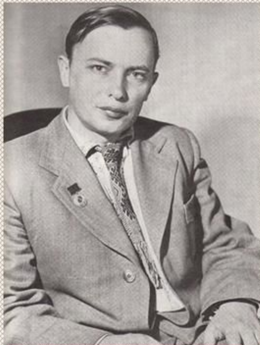
А. Куляшоў - лаўрэат Дзяржаўнай прэміі СССР. Мінск, 1946 г.

У 1946 годзе ён становіцца лаўрэатам Дзяржаўнай прэміі СССР за паэму «Сцяг брыгады», а ў 1949 годзе паўторна атрымлівае названую прэмію за паэму «Новае рэчышча».