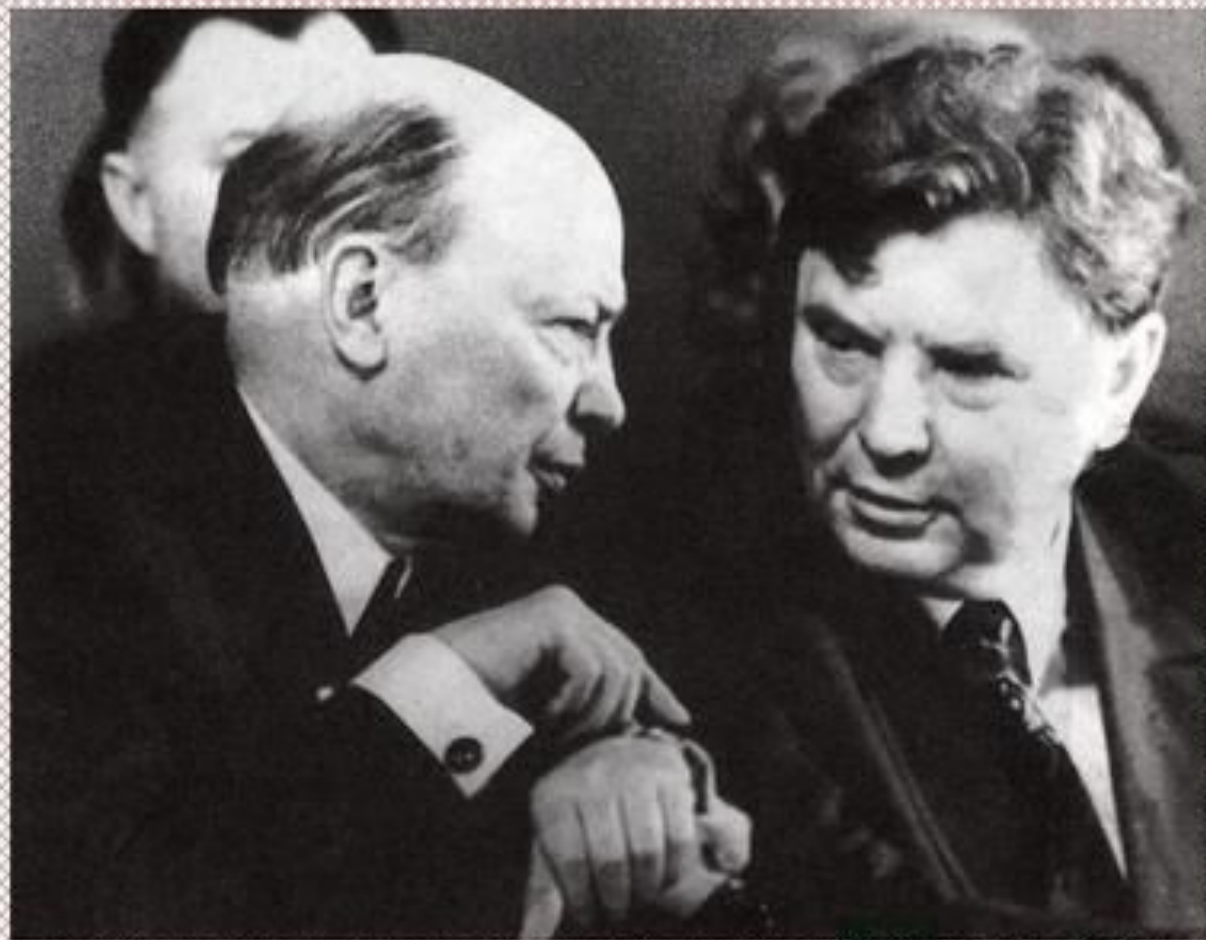
А. Куляшоў з Максімам Танкам. 1975 г.