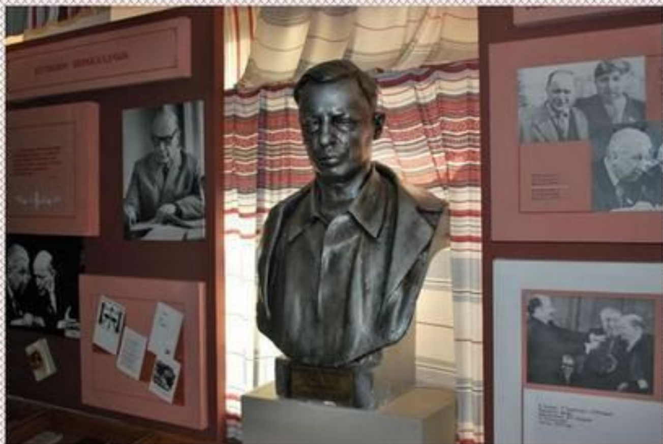
Літаратурны музей імя Аркадзя Куляшова. Новасаматэвіцкая сярэдняя школа.