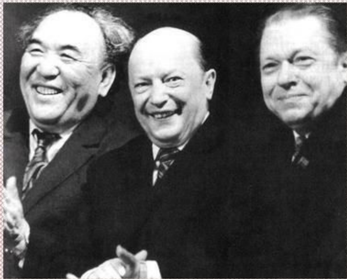
Давід Кугульцінаў, Аркадзь Куляшоў, Пімен Панчанка. 1973 г

У 1961 г. у складзе дэлегацыі БССР удзельнічаў у рабоце XVI сэсіі Генеральнай Асамблеі ААН.