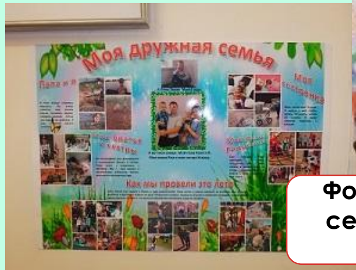
Фотогазеты «Моя дружная семья», «Мы со спортом – друзья»