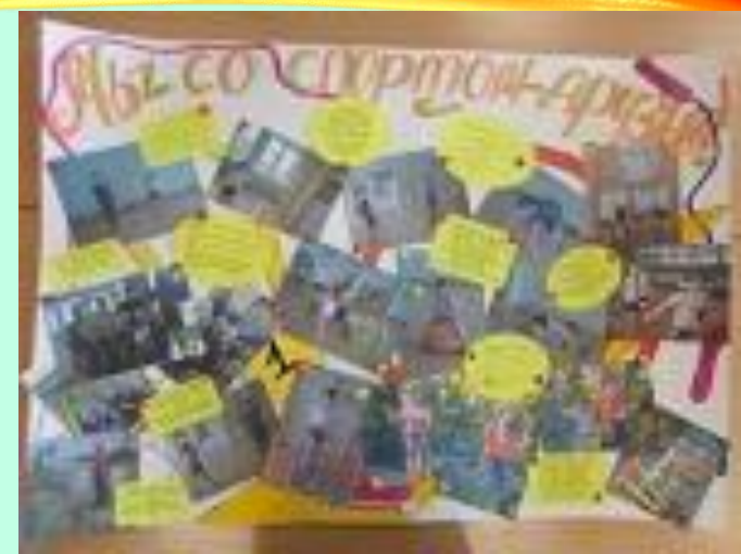
Фотогазеты «Моя дружная семья», «Мы со спортом – друзья»