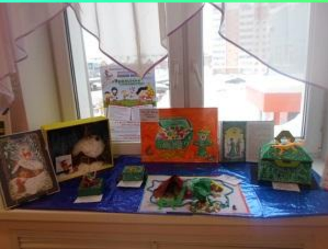
Выставка «Уральские самоцветы»