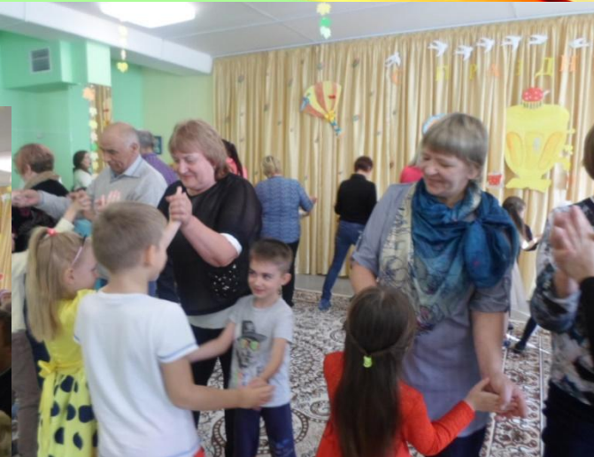
Праздник «День пожилого человека»