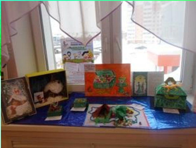
Выставка «Уральские самоцветы»