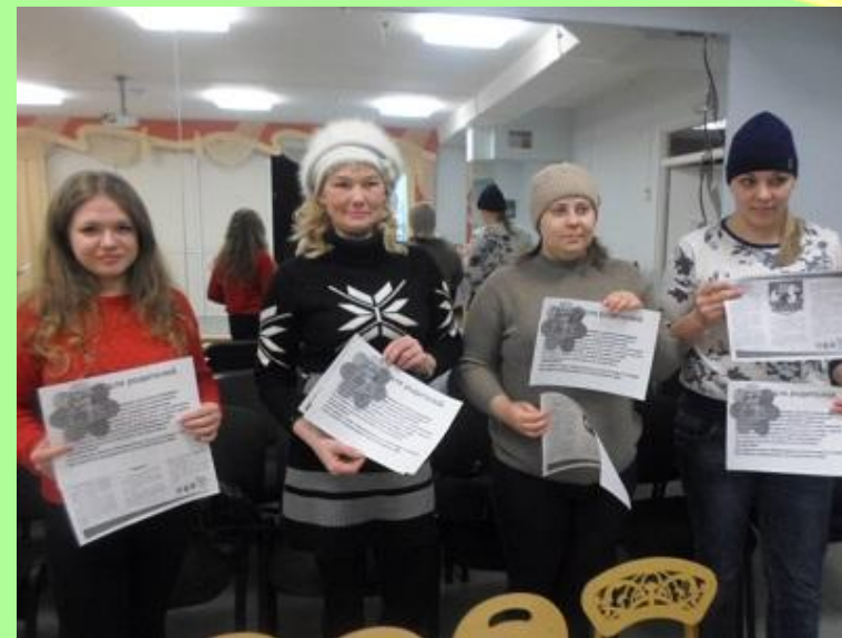
Вручение памяток по воспитанию толерантности в семье