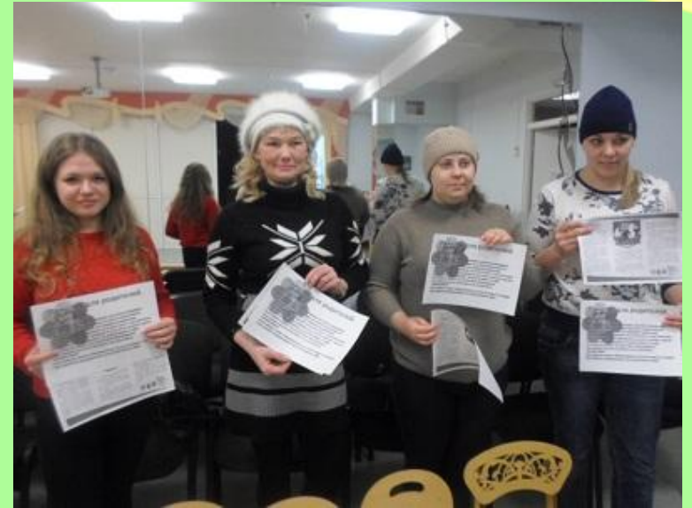
Вручение памяток по воспитанию толерантности в семье