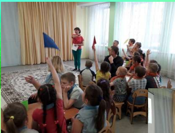
Игра Брейн –ринг «Профессии»