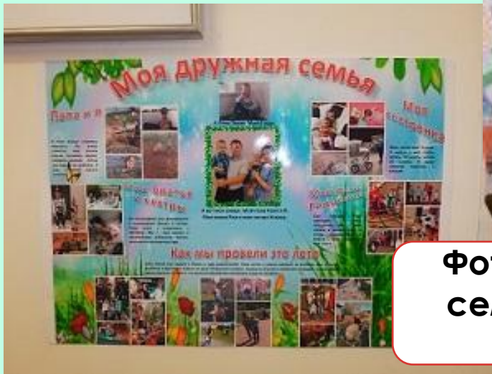
Фотогазеты «Моя дружная семья», «Мы со спортом – друзья»