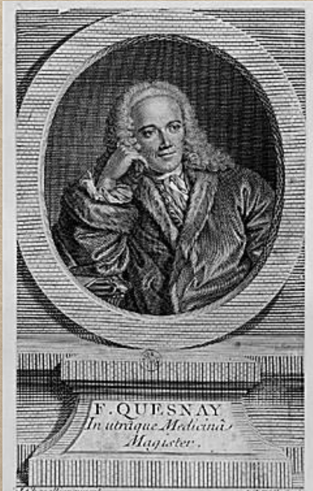
Франсуа Кенэ 1694 - 1774

Физиократия (др. греч. φύσις — природа; κράτος — сила, власть, «власть природы»)