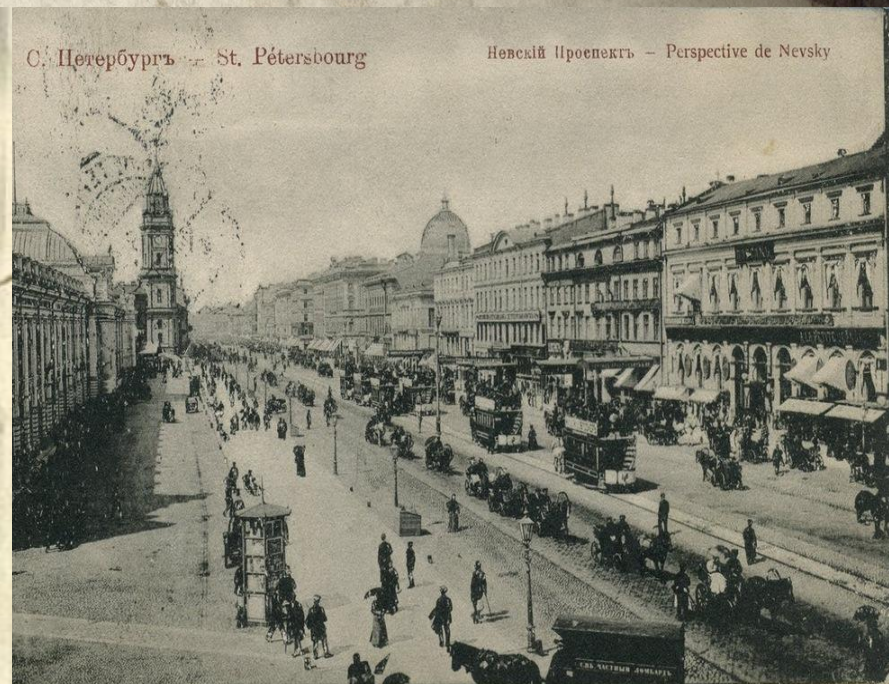
С. Петербургъ — St. Pétersbourg