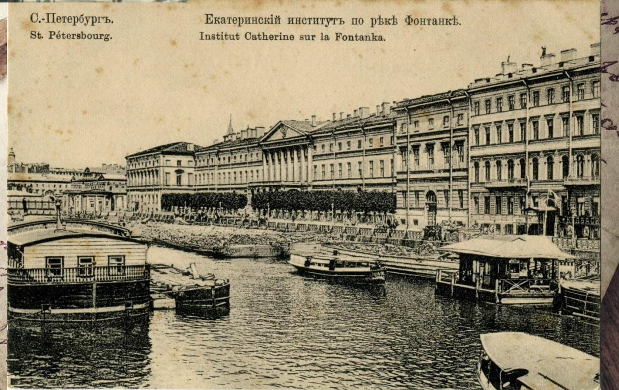
С.-Петербургъ. St. Pétersbourg.