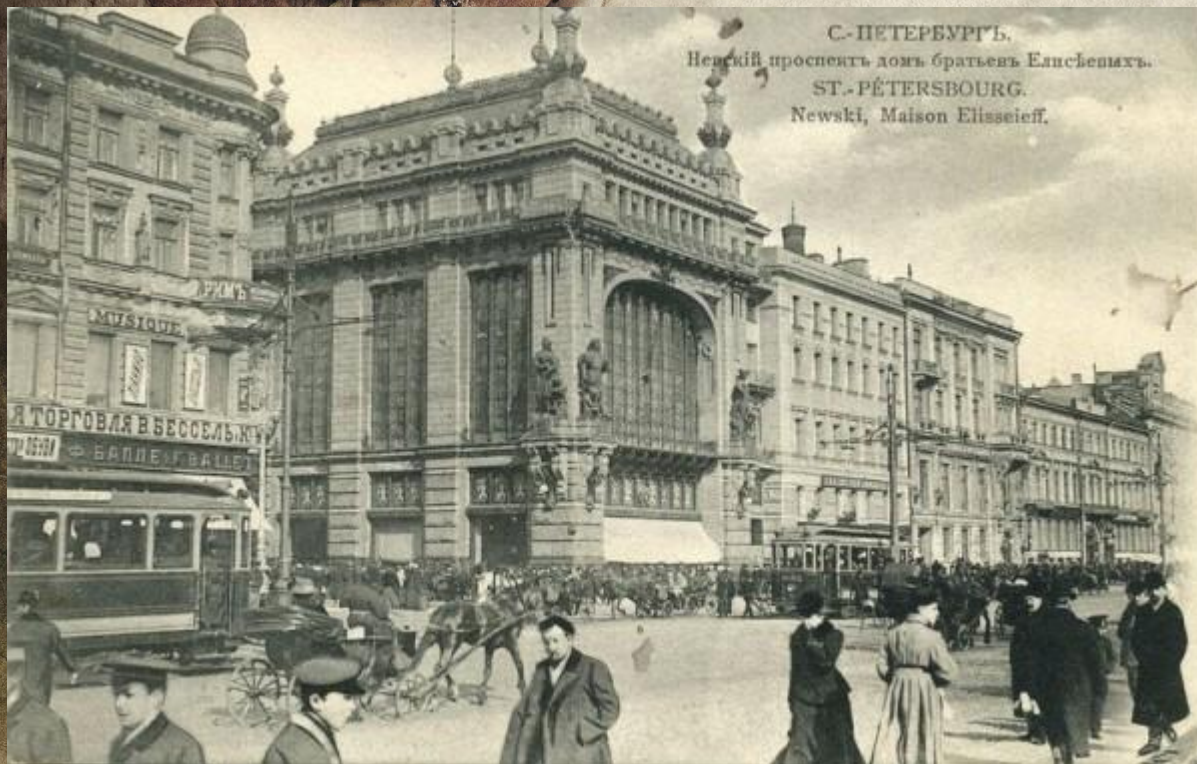
С.-ПЕТЕРБУРГЪ. Невскій проспектъ домъ братьевъ Елисеиныхъ. ST.-PÉTERSBOURG. Newski, Maison Elissieff.