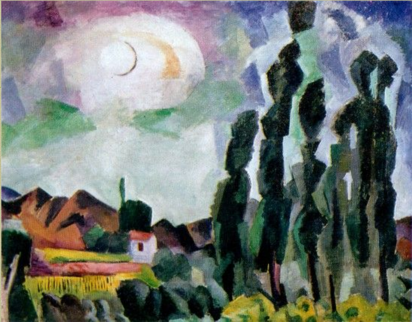
Солнце. Крым. Козы. 1916