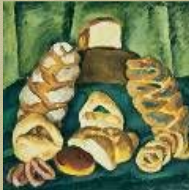
Хлебы на зеленом. 1913