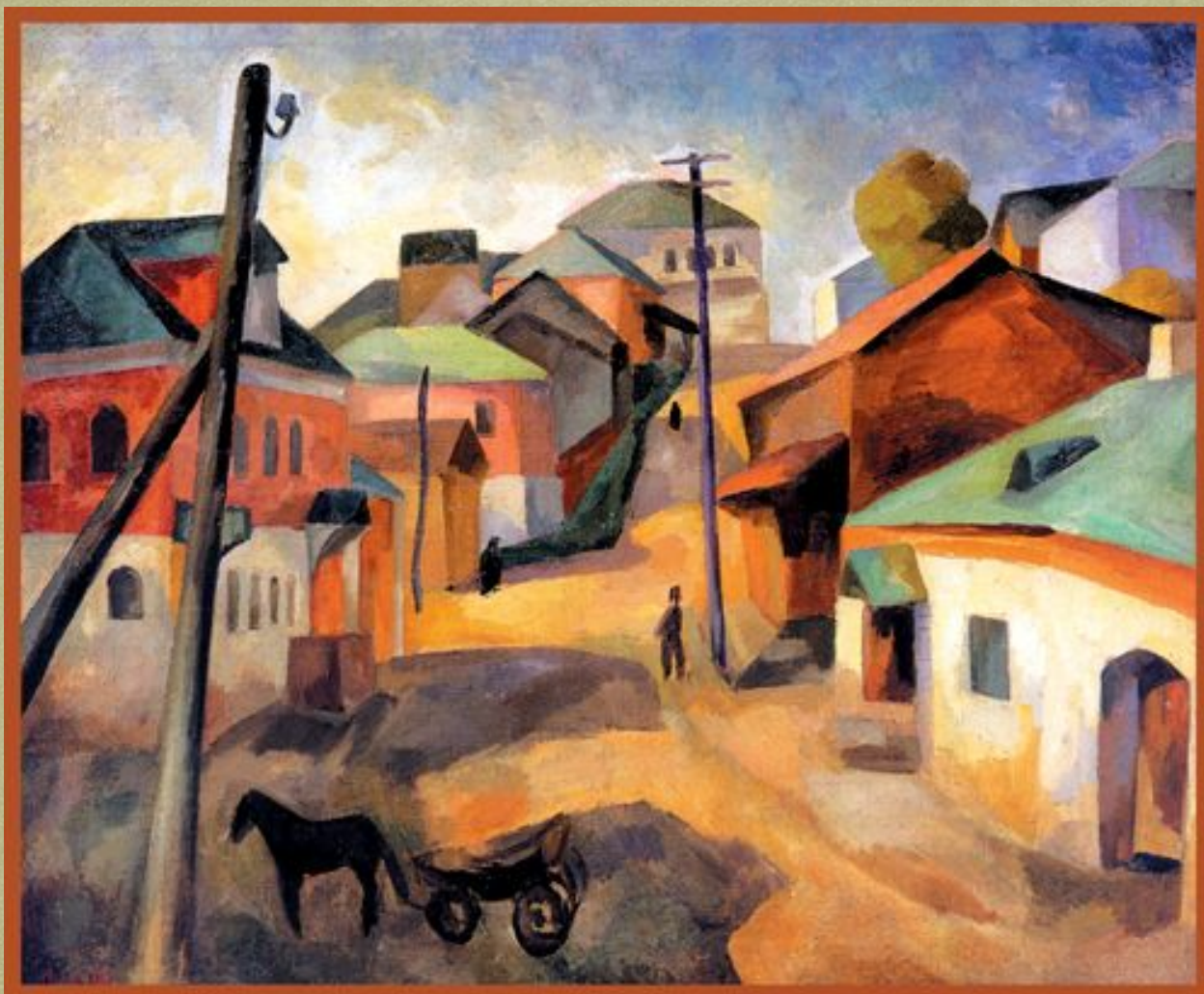
Старая Руза, 1913