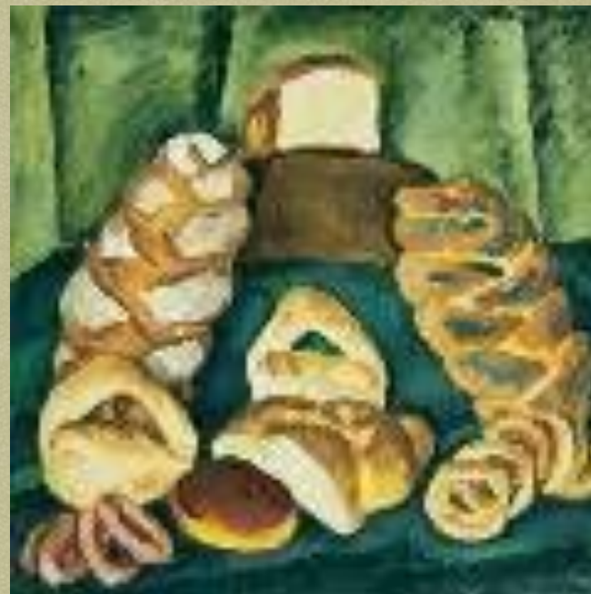
Хлебы на зеленом. 1913