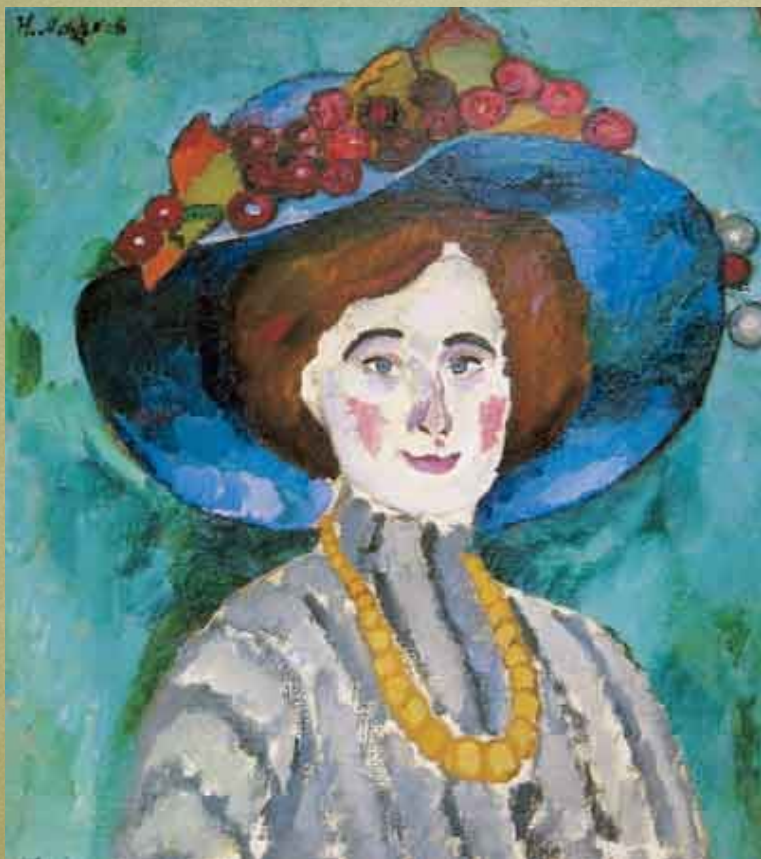
Дама в шляпе. 1909.