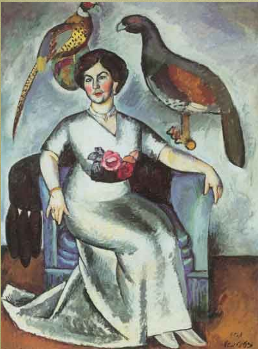
Портрет дамы с фазанами. 1911.