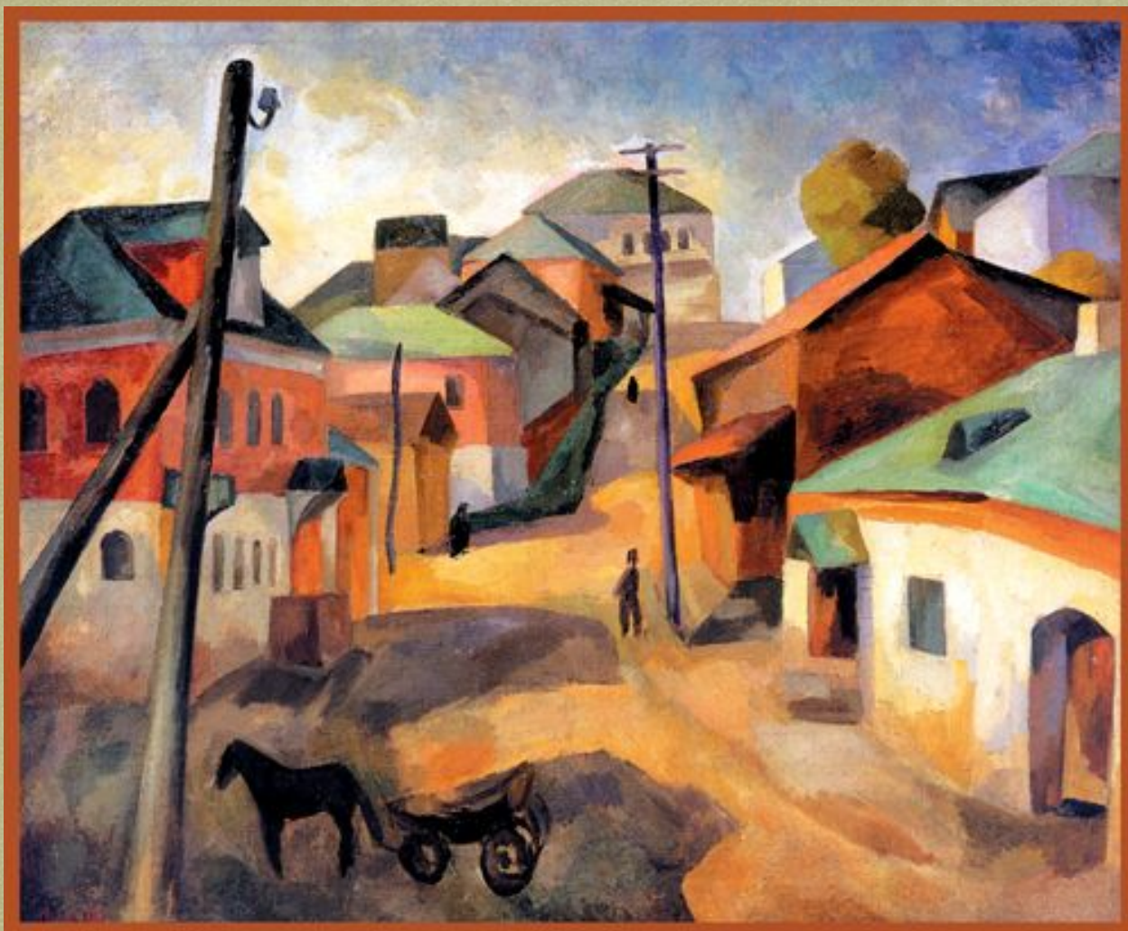
Старая Руза, 1913