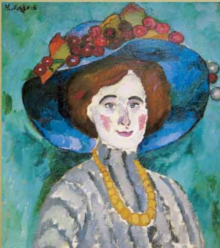
Дама в шляпе. 1909.