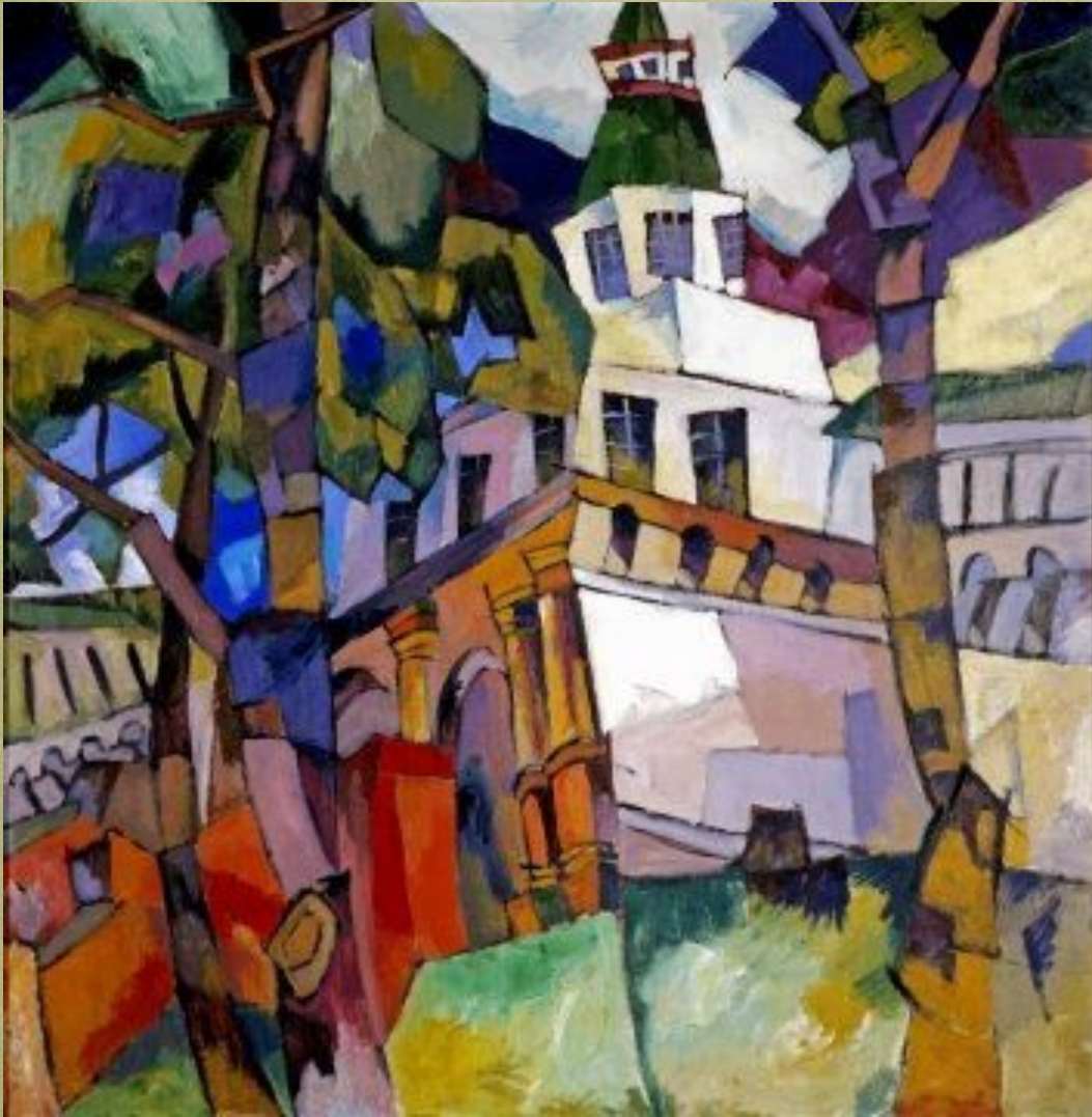
Ворота с башней. Новый Иерусалим. 1917