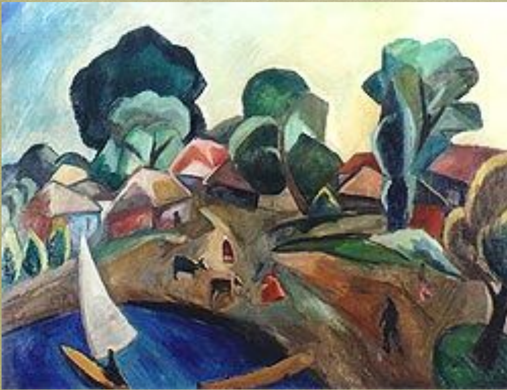
Пейзаж с парусом, 1912