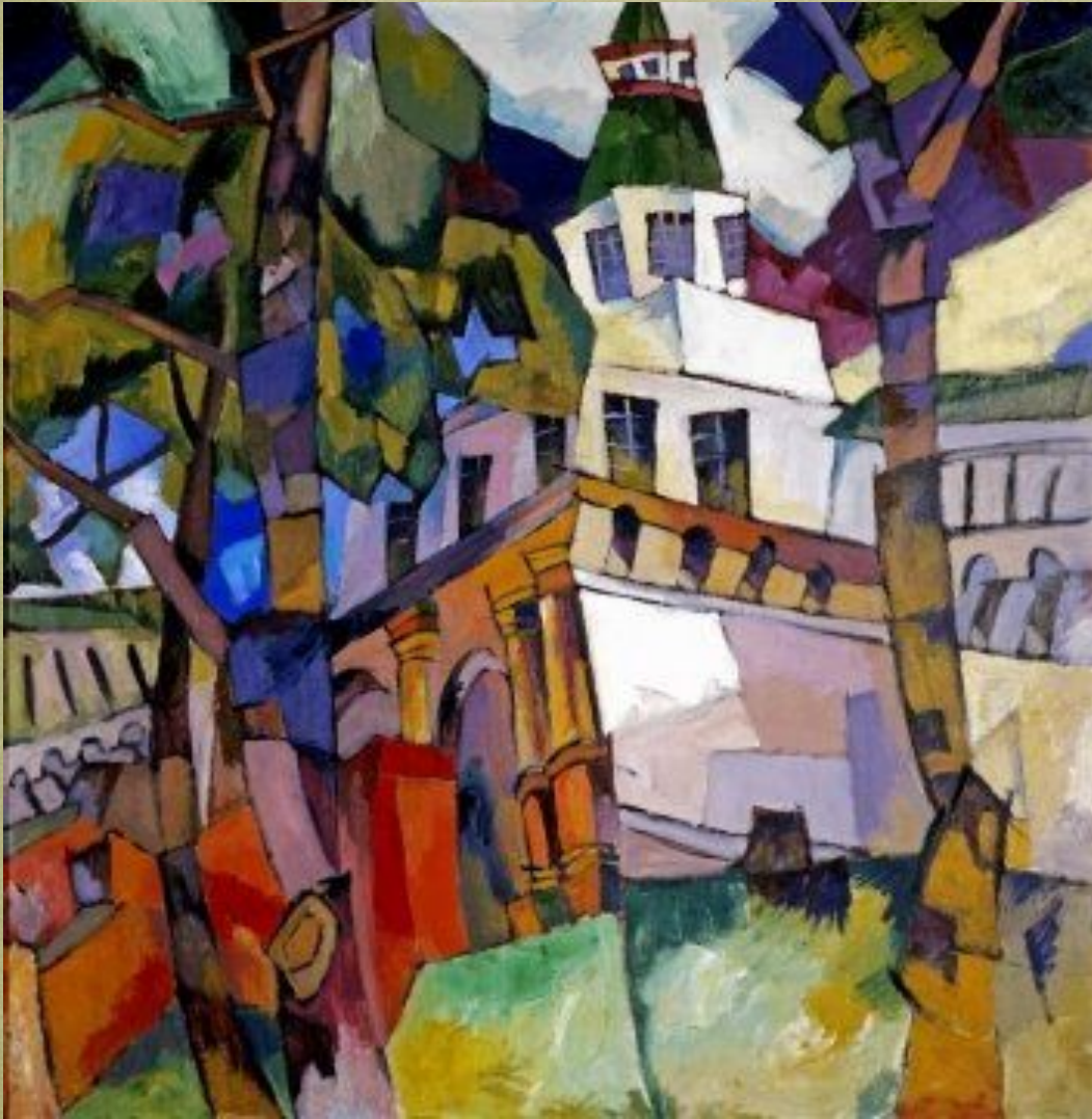
Ворота с башней. Новый Иерусалим. 1917