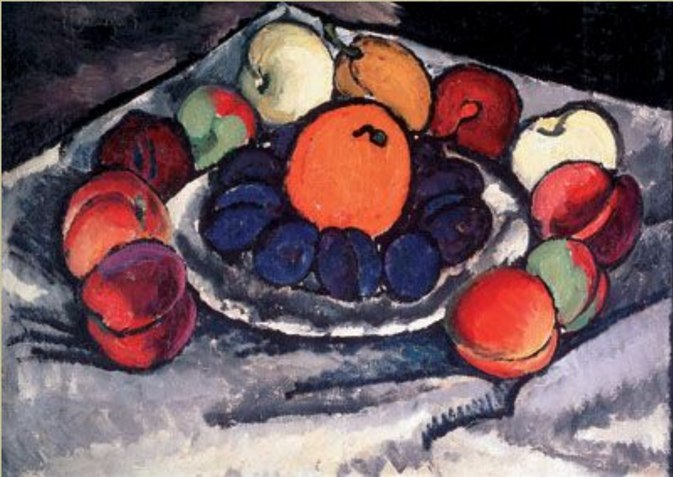
□ Фрукты на блюде. 1926