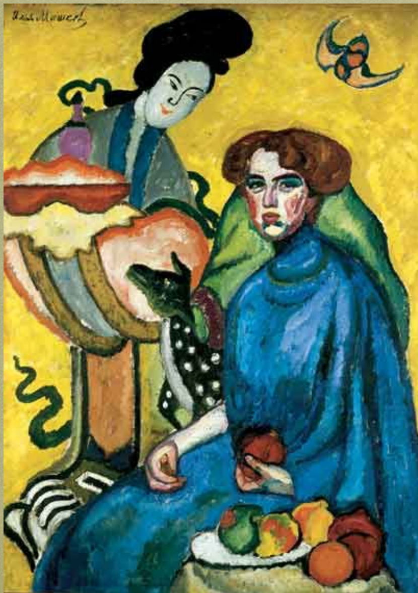
Портрет Е.И.Киркальди. 1910