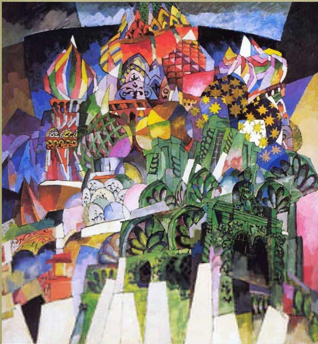
Василий Блаженный. 1913