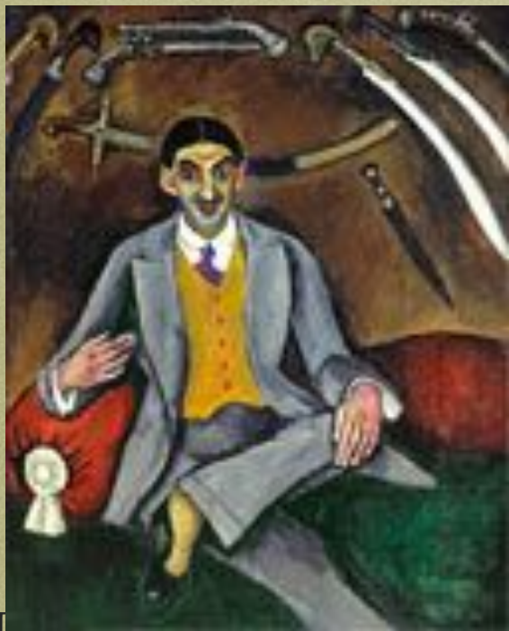
Портрет художника Г.Б.Якулова. 1910