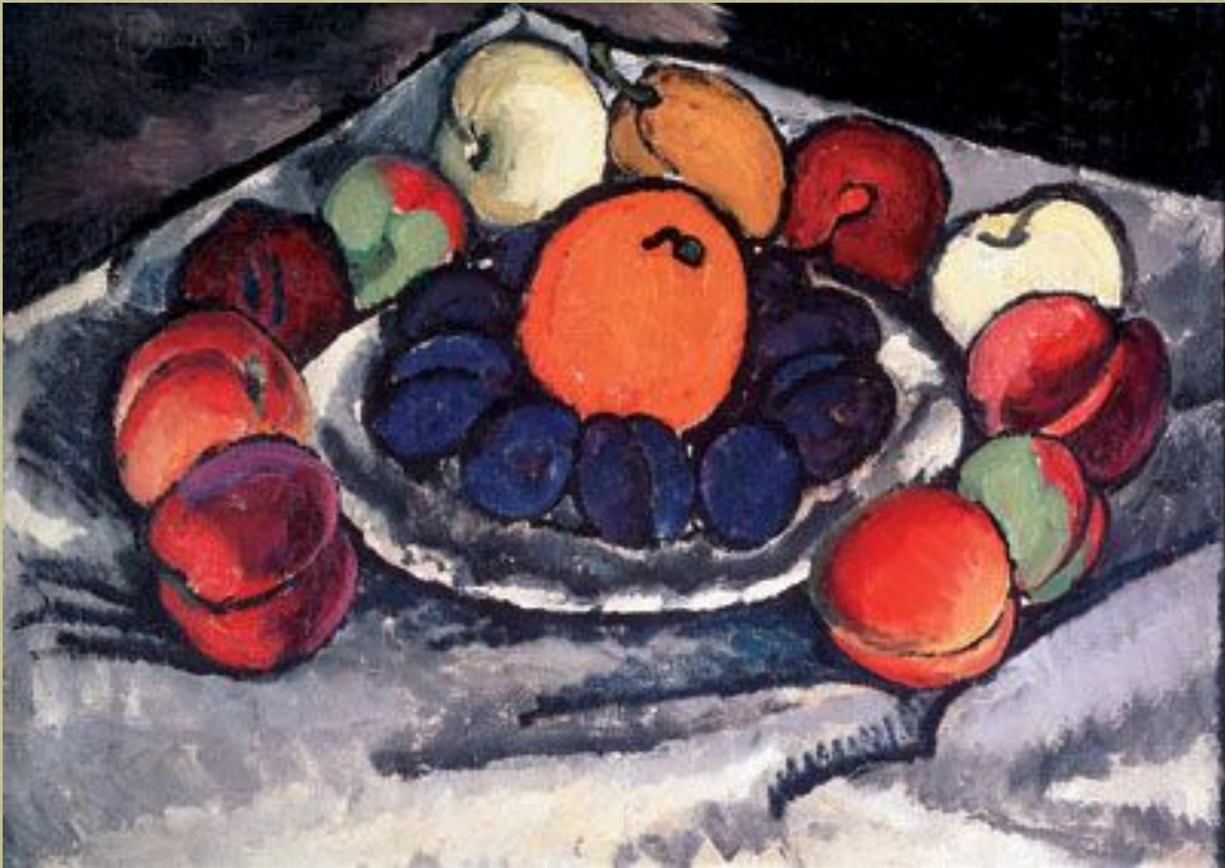
□ Фрукты на блюде. 1926