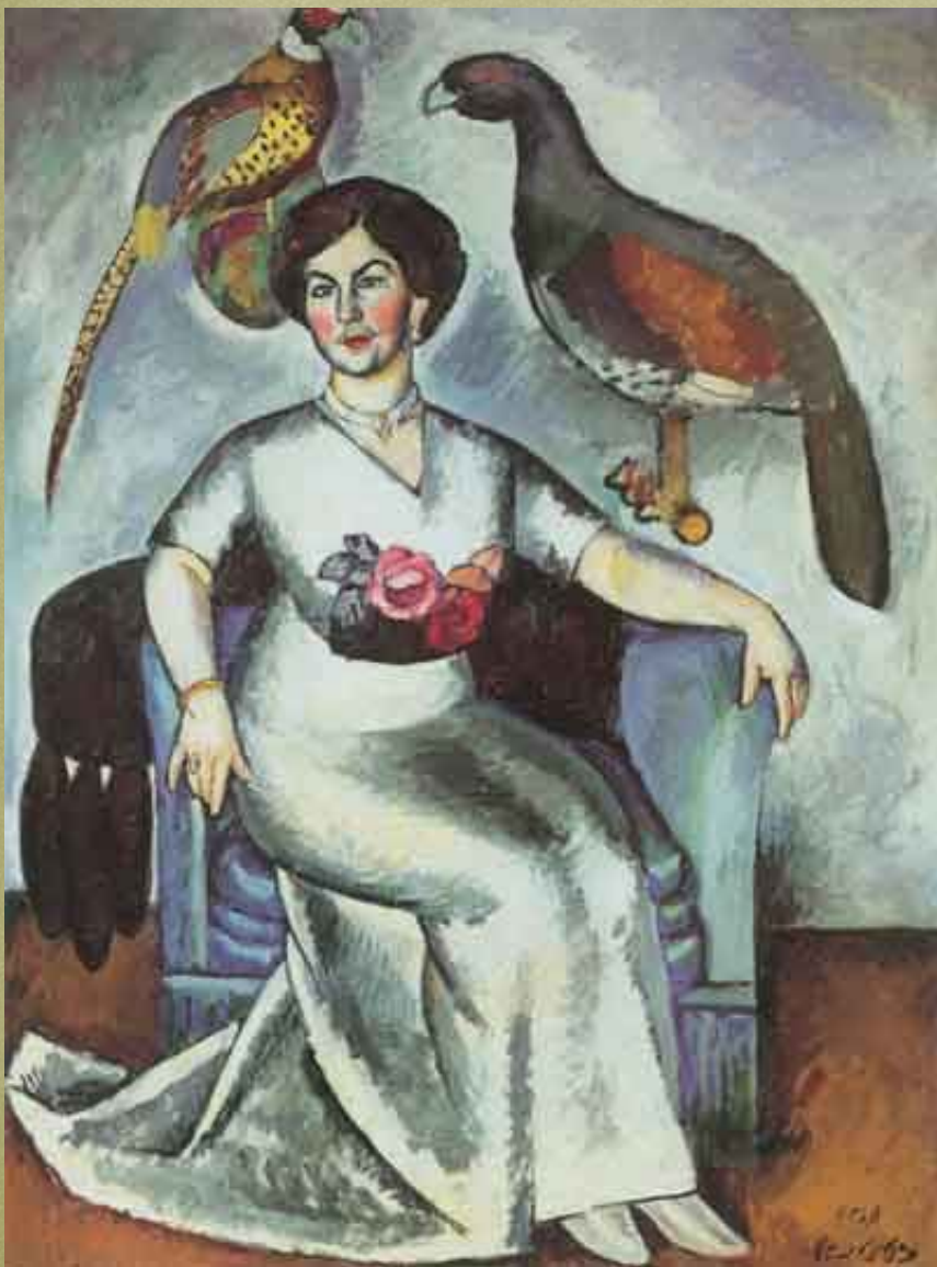
Портрет дамы с фазанами. 1911.