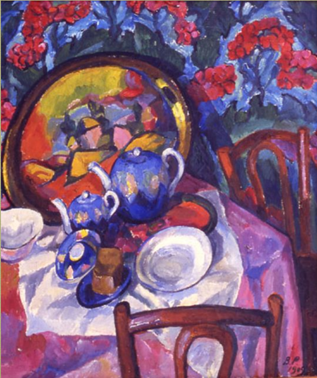
Натюрморт «Трактирная посуда».1909