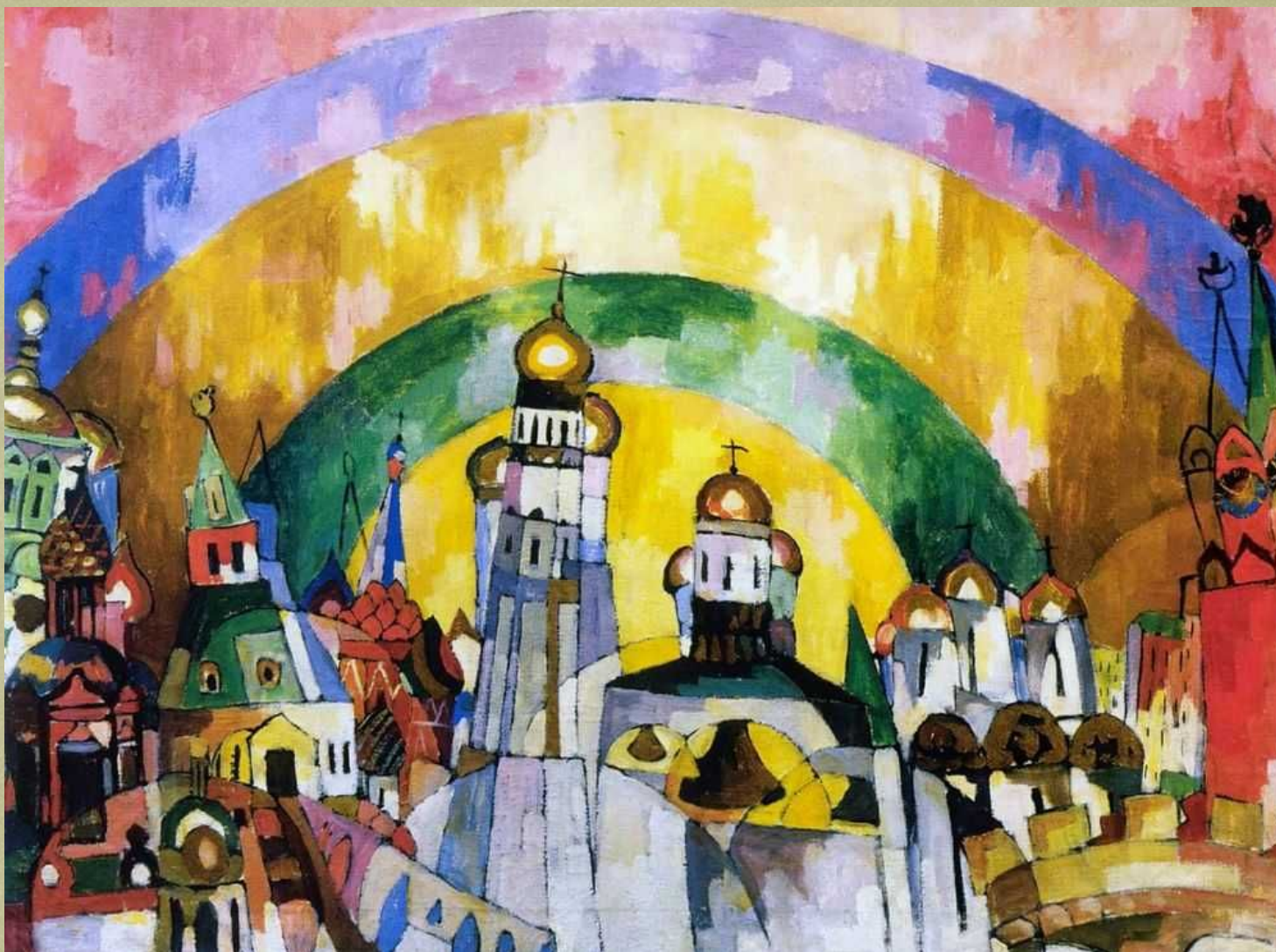
Небосвод (Декоративная Москва). 1915