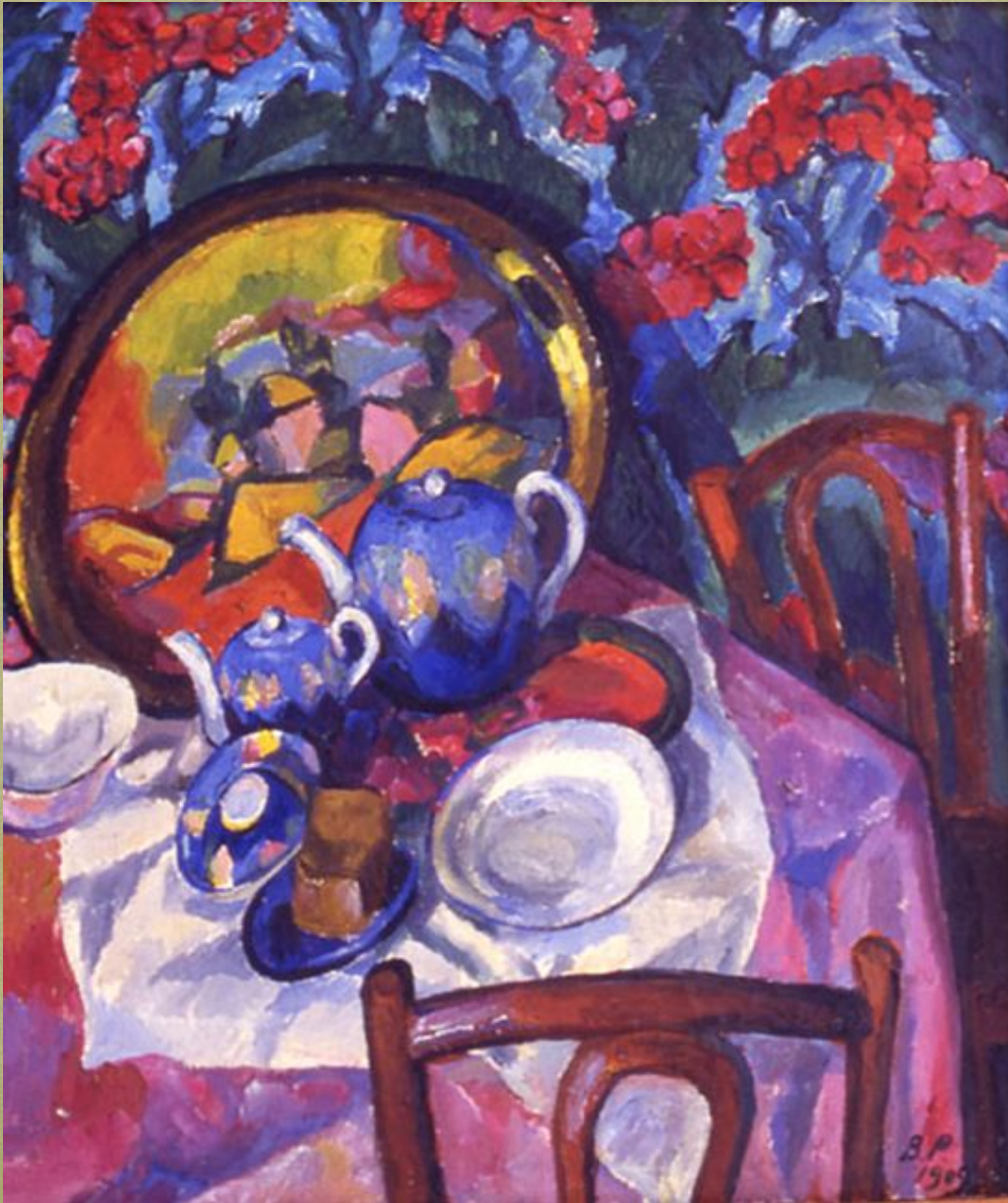
Натюрморт «Трактирная посуда».1909