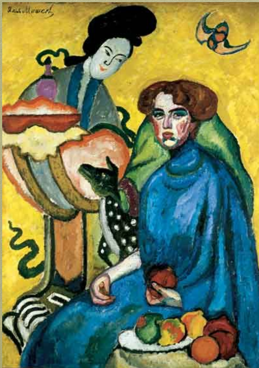
Портрет Е.И.Киркальди. 1910