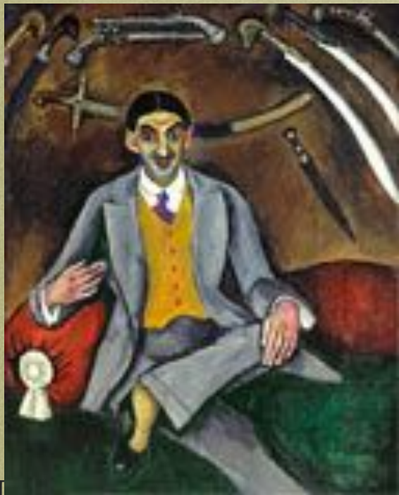
Портрет художника Г.Б.Якулова. 1910