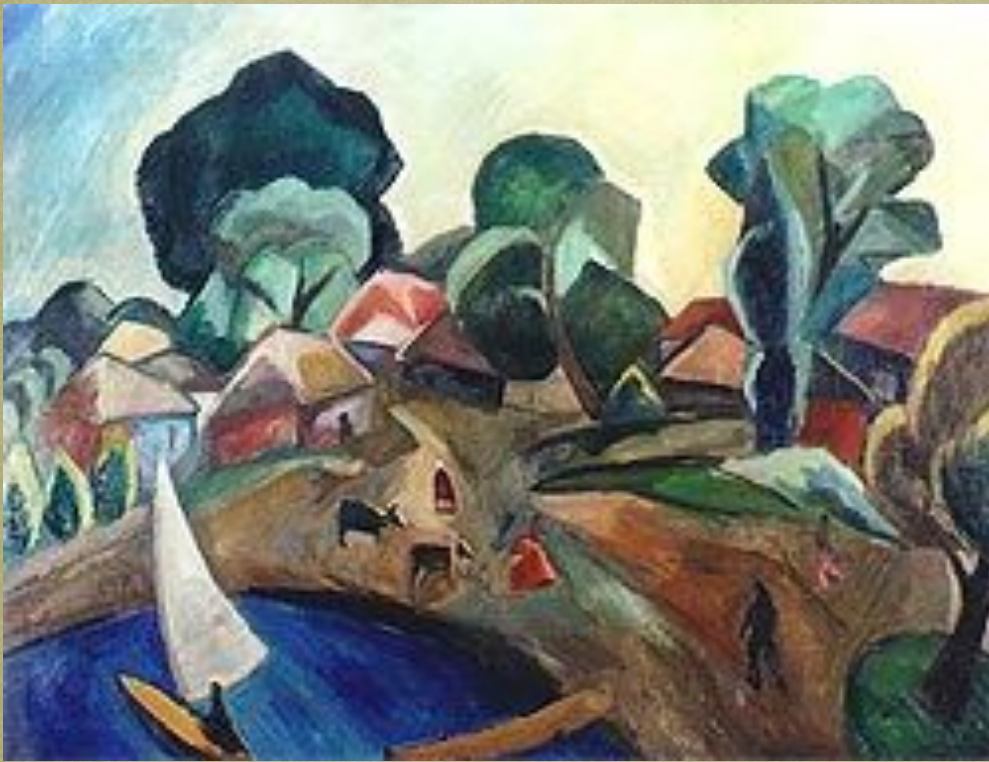
Пейзаж с парусом, 1912