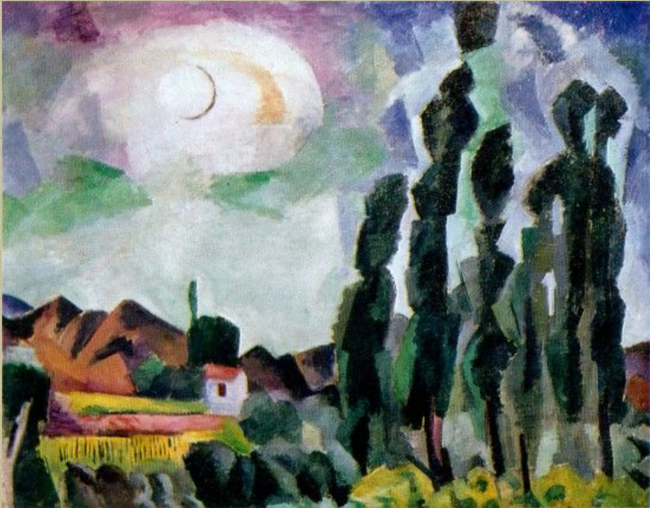
Солнце. Крым. Козы. 1916