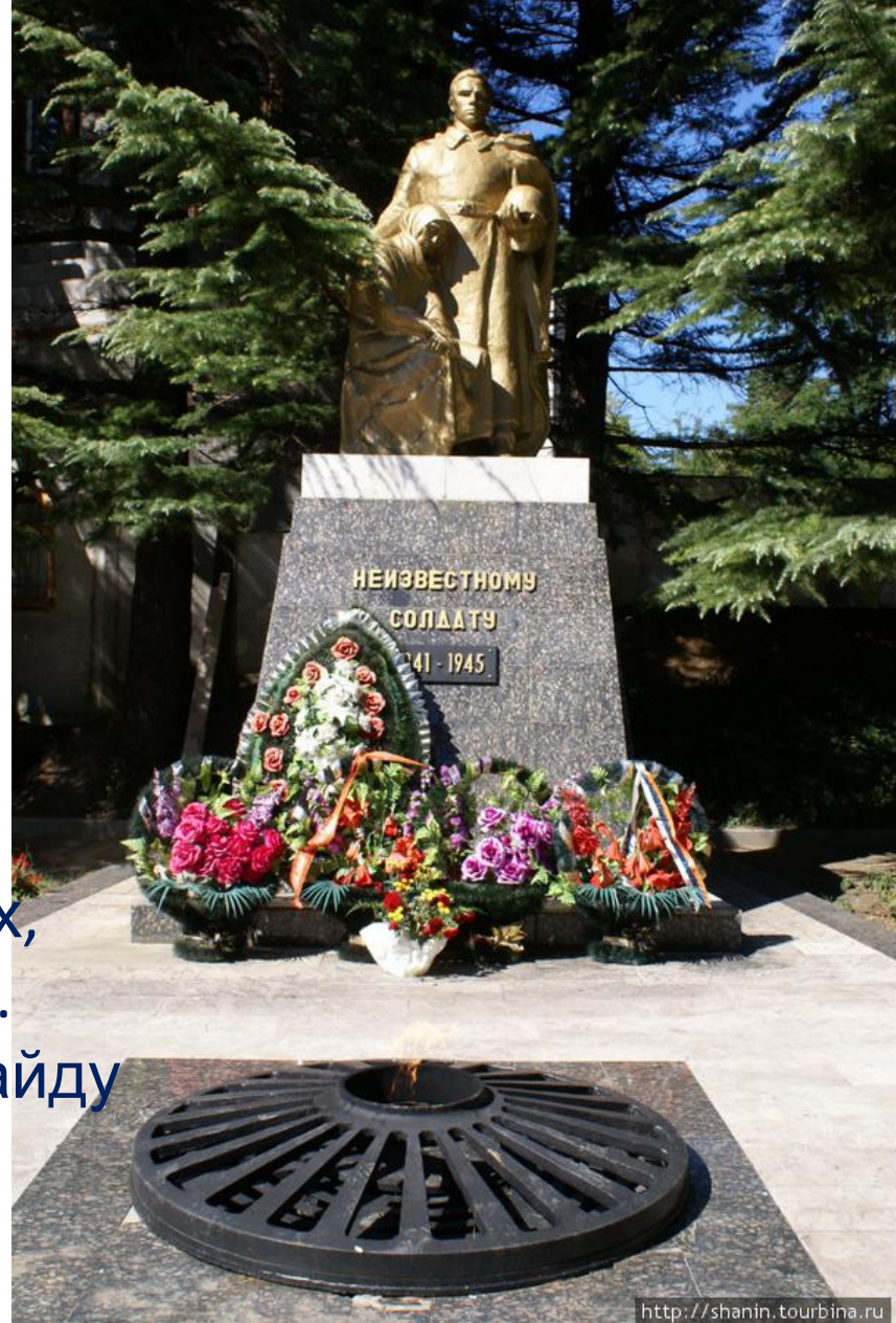
Памятник в Туапсе