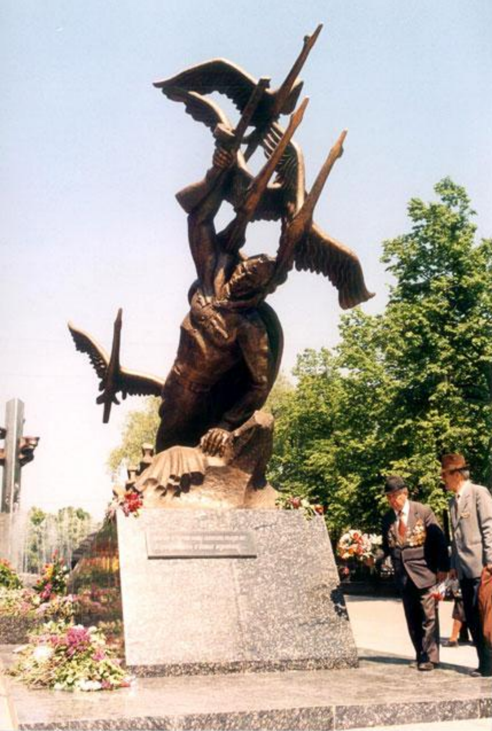
Мемориальный комплекс Героям Великой Отечественной войны, памятник Неизвестному солдату. Луганск