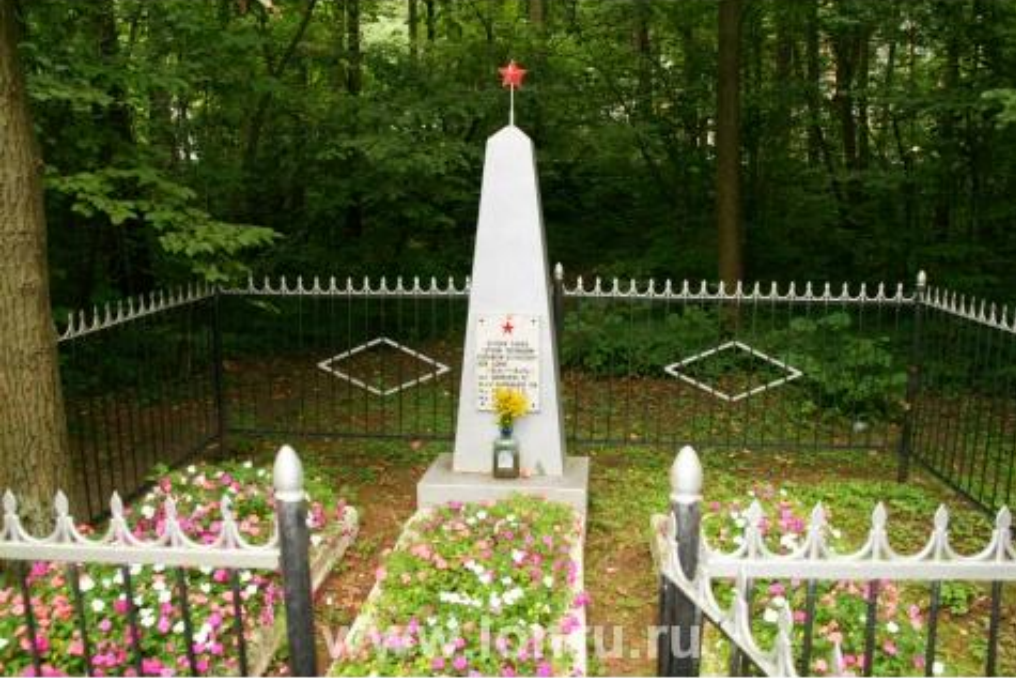
Жуковка - могила неизвестному солдату , погибшему во время Великой Отечественной войны