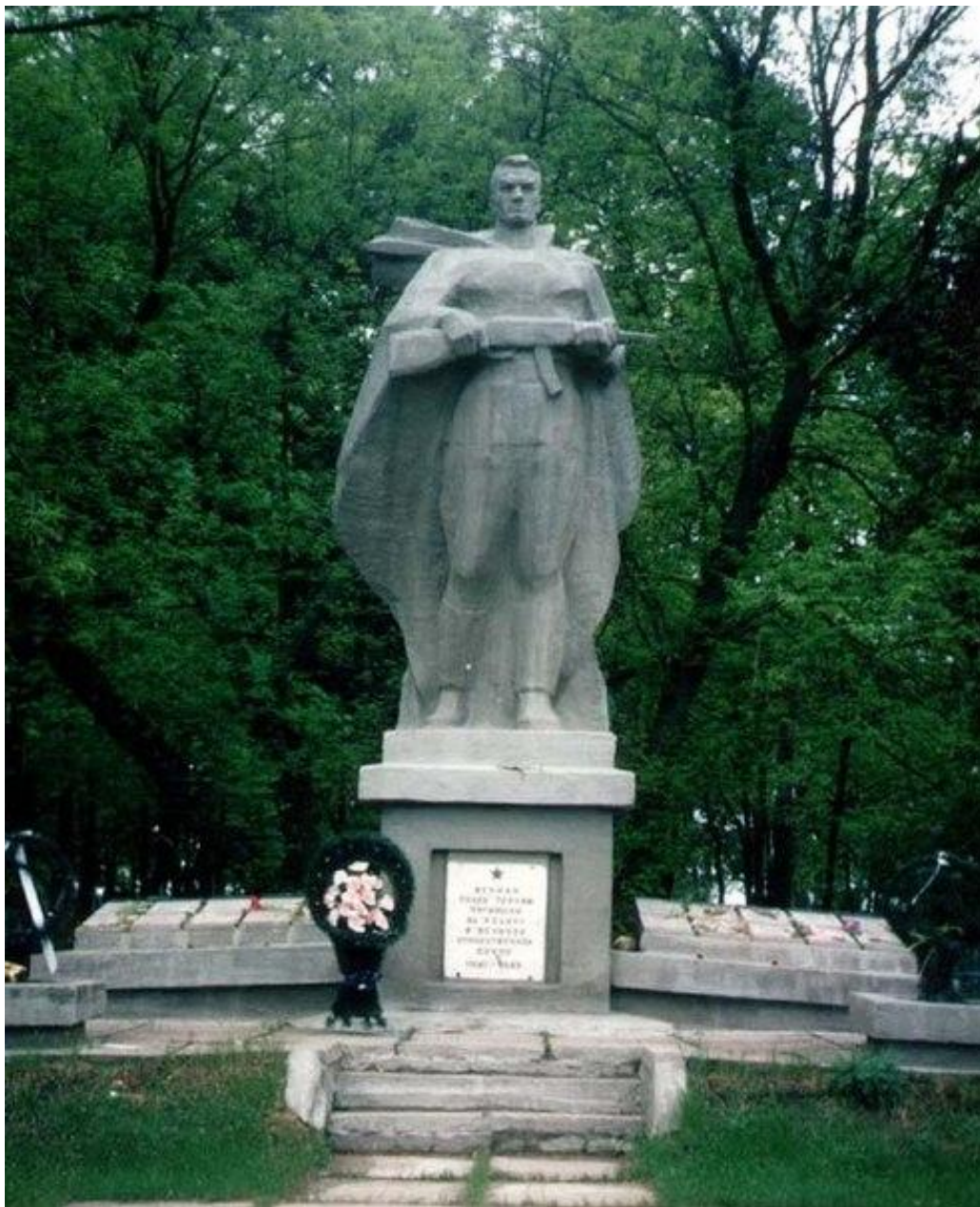
Памятник в Рогачеве