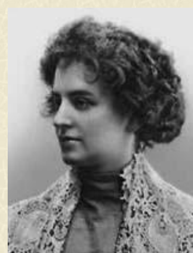
Гиппиус З. Н.