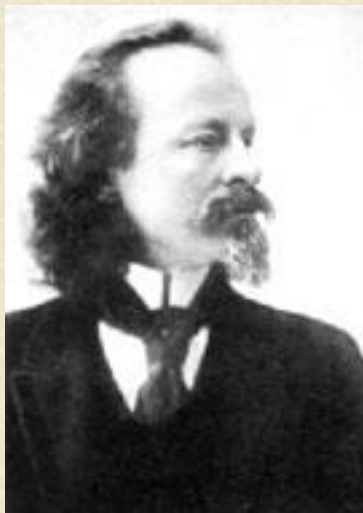
Бальмонт К. Д.