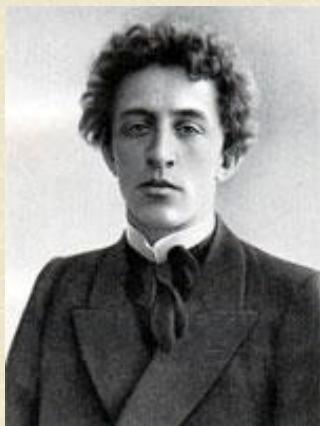
Блок А. А.