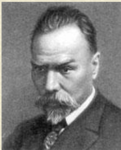
Брюсов В. Я.