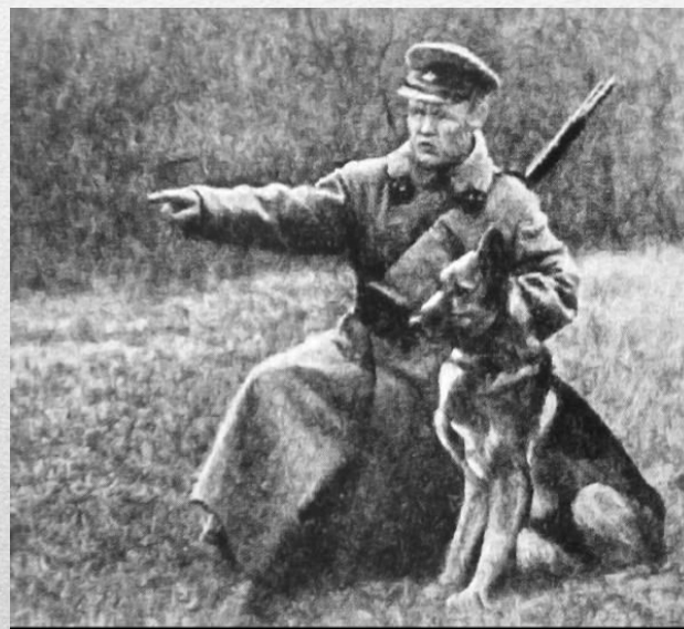
СОВЕТСКИЙ СЛЕДОПЫТ НИКИТА КАРАЦУПА И ЕГО ЛЕГЕНДАРНЫЙ ИНГУС