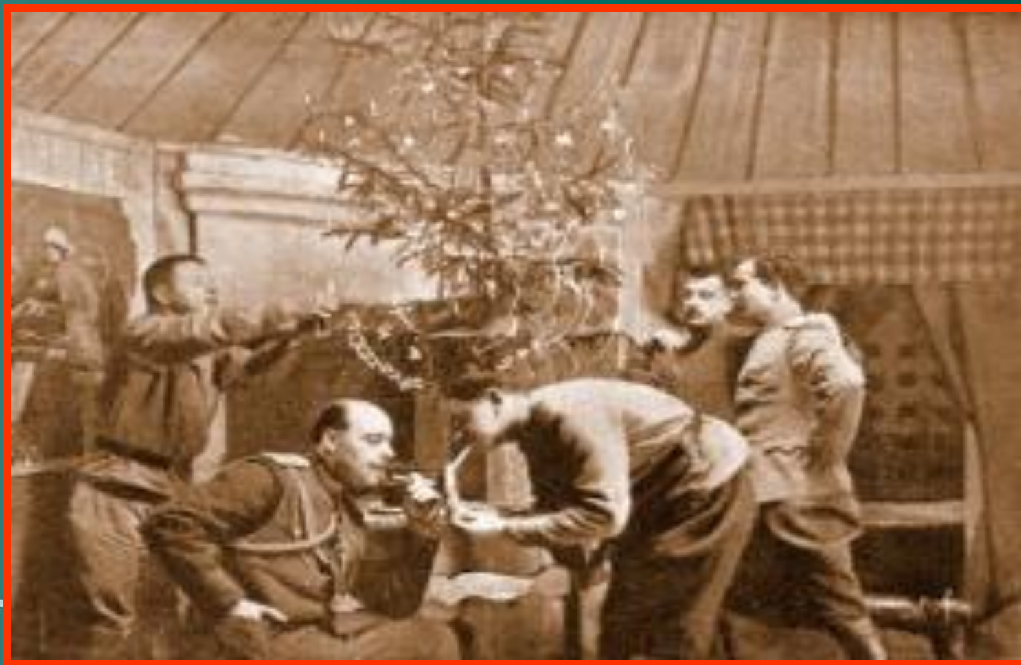
Ёлка в землянке. Новый 1917 год.