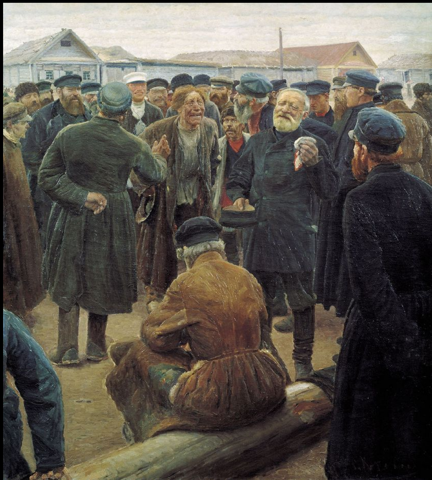
С.А.Коровин "На миру" 1903г