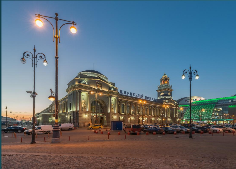
Московская железная дорога