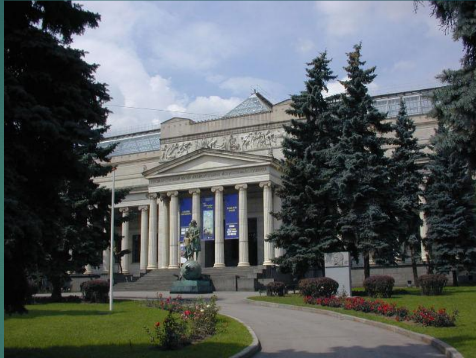
Государственный музей изобразительных искусств имени А. С. Пушкина