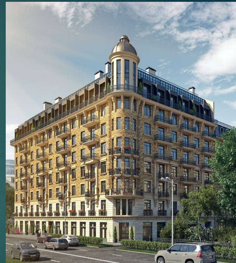
ЖК «Дом на Кирочной»