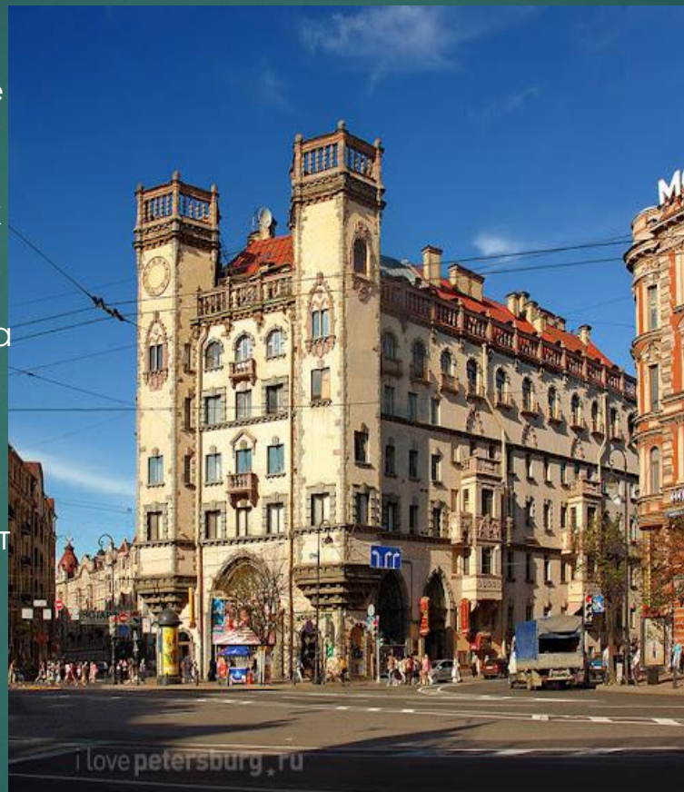
К. И. Розенштейна. «Дом с башнями»

Ретроспективизм — традиционалистское направление в архитектуре первой половины XX века, основанное на освоении архитектурного наследия прошлых эпох, от ренессанса и древнерусского зодчества до классицизма первой трети XIX века (ампира) Ретроспективизм — всемирное, но при этом глубоко национальное явление. В каждой стране складывались свои школы, свои стили, поэтому не существует однозначного перевода терминов и понятий, связанных с этим направлением. Термин ретроспективизм — сугубо российский)