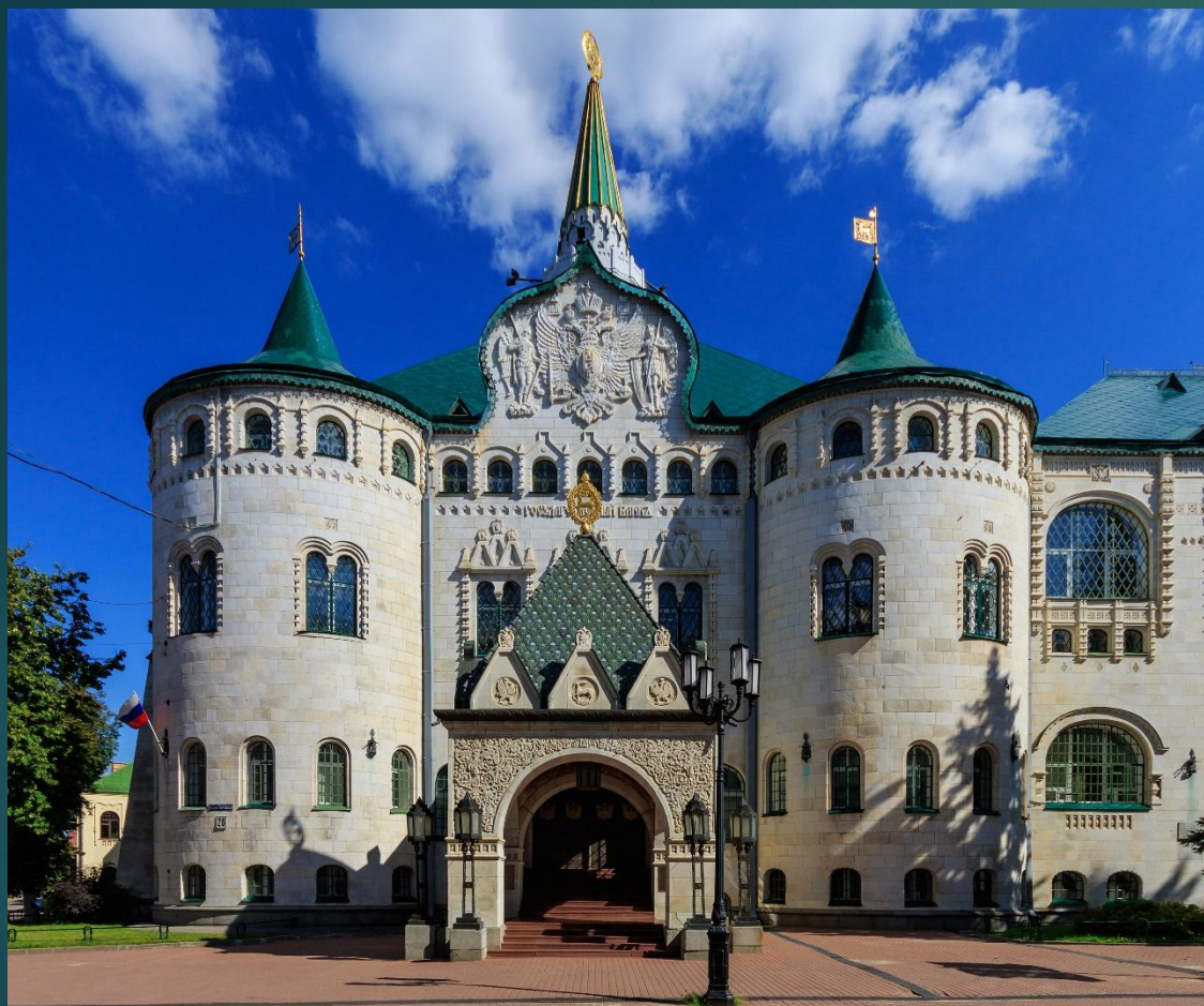
Здание Государственного Банка в Нижнем Новгороде