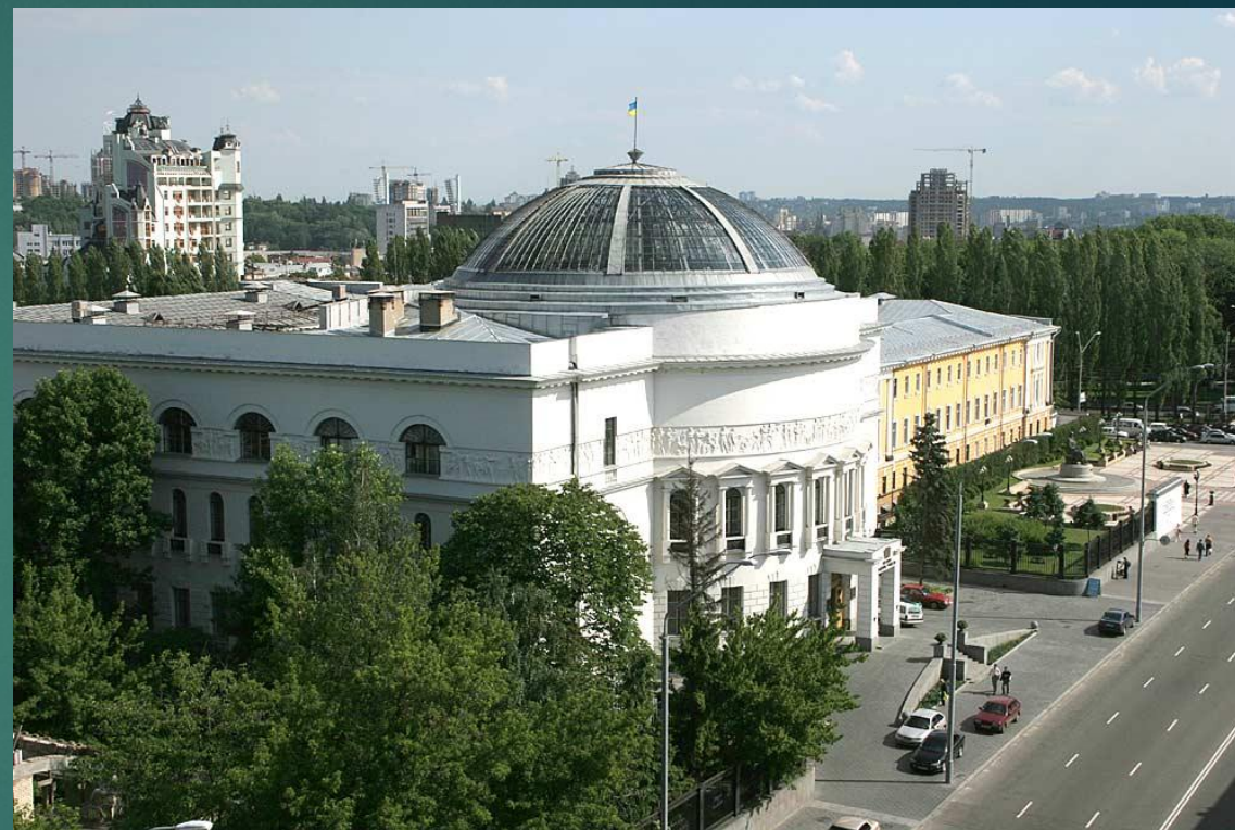
Дом учителя в Киеве