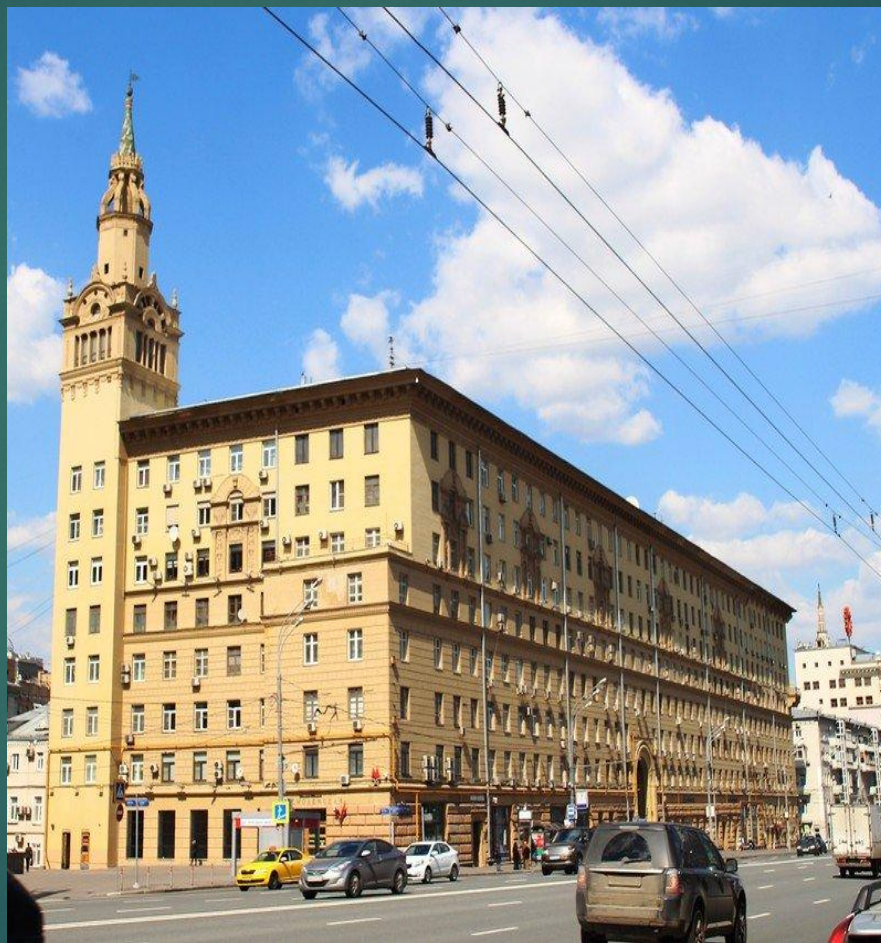
Дом работников НКВД на Смоленской площади

В 1945 году, после окончания Второй мировой войны, постановлением Правительства была создана Архитектурная мастерская-школа академика архитектуры И. В. Жолтовского.