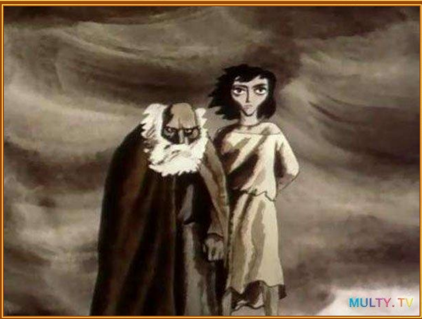
Р. Л. Стивенсон «Вересковый мед»