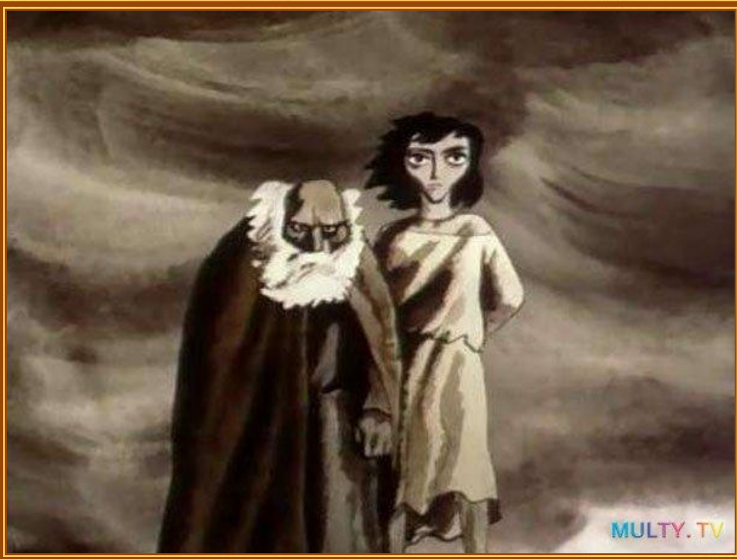
Р. Л. Стивенсон «Вересковый мед»