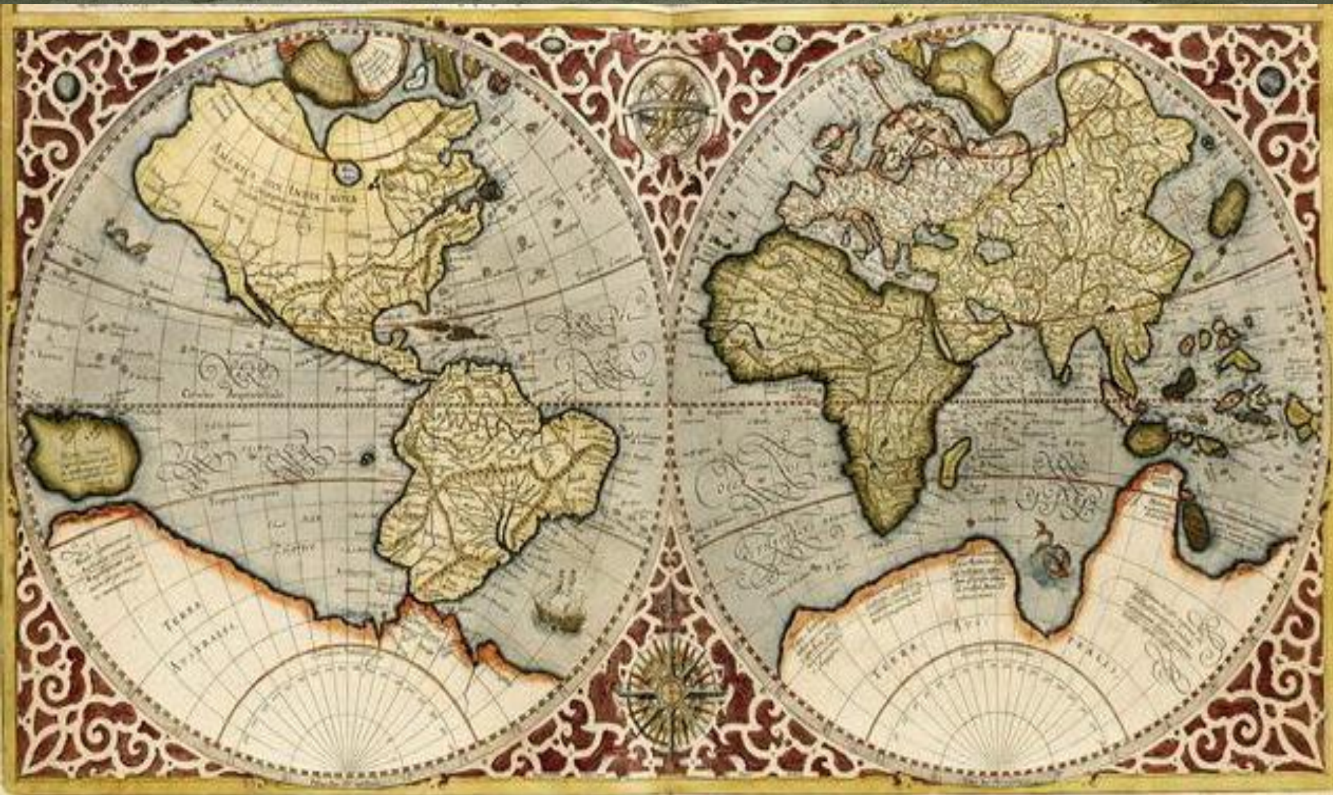
Карта капитана Врунгеля