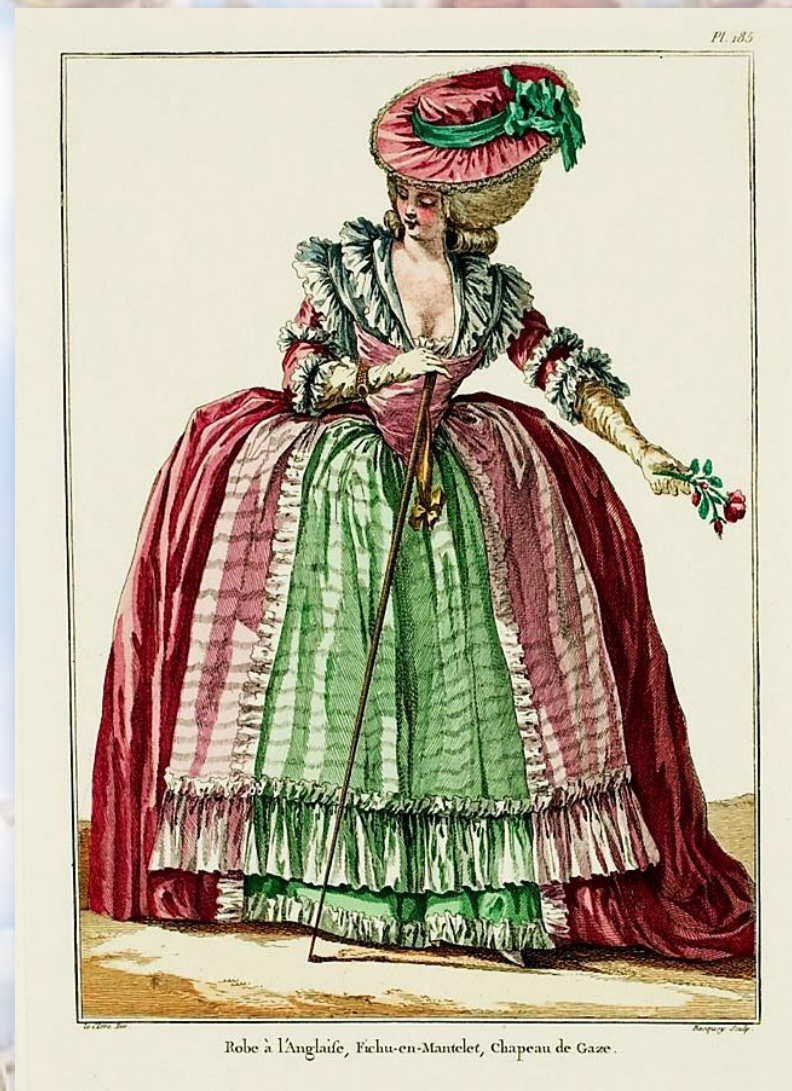
Robe à l'Anglaise, Fichu-en-Mantelet, Chapeau de Gaze.