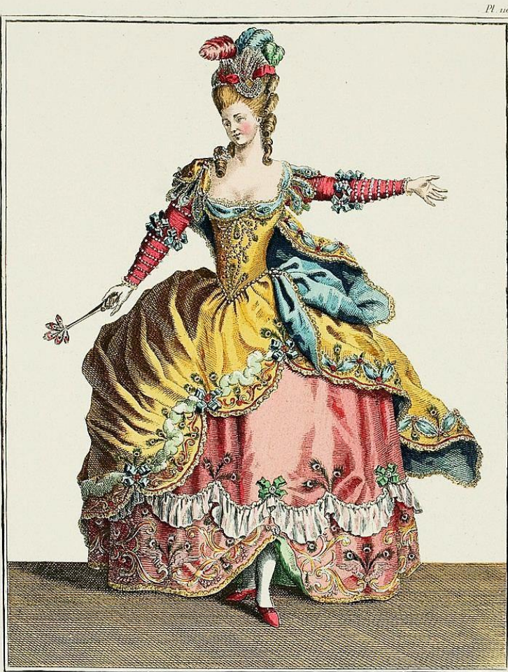
Reine des Sylphes, Dans le Ballet des Elémens &c.