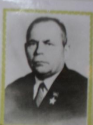
СТЕЦКО Иван Степанович