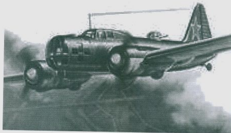
Скоростной бомбардировщик /на одном из них воевал Худяков И.С./