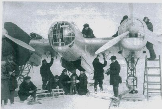
Будни военного аэродрома /1939 г. – 1940г./