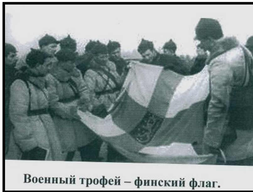
Военный трофей – финский флаг.