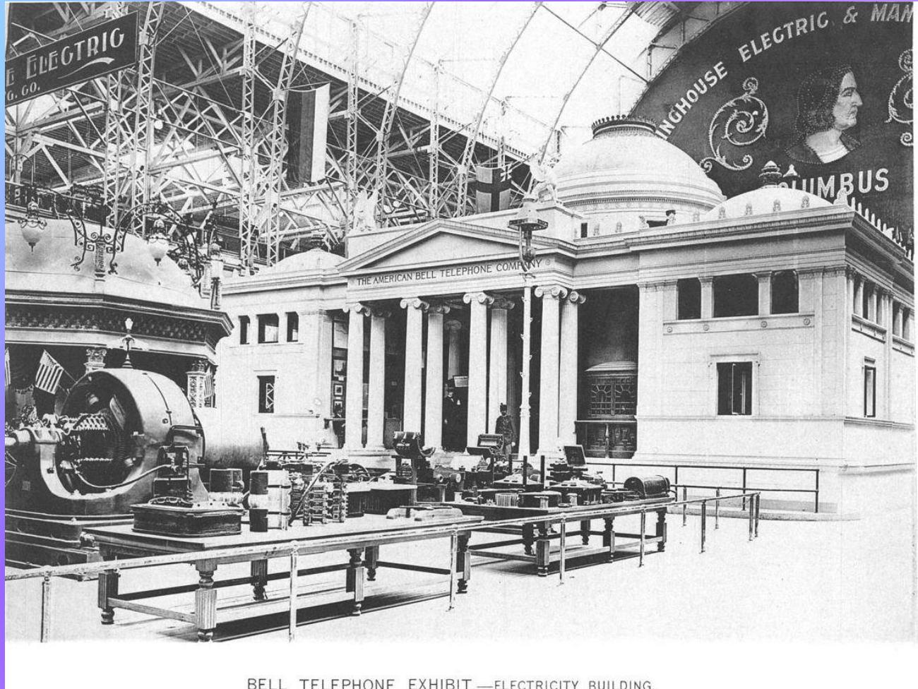
BELL TELEPHONE EXHIBIT — ELECTRICITY BUILDING.

На международной художественно-промышленной выставке 1893 г. в Чикаго русское фабрично-заводское производство было представлено весьма широко. Группа русских фабрично-заводских экспонатов включала разделы сельскохозяйственных орудий и машин, горного дела и металлургии, машинного производства и способов передвижения - судов, железный дорог, экипажей и промышленного производства.