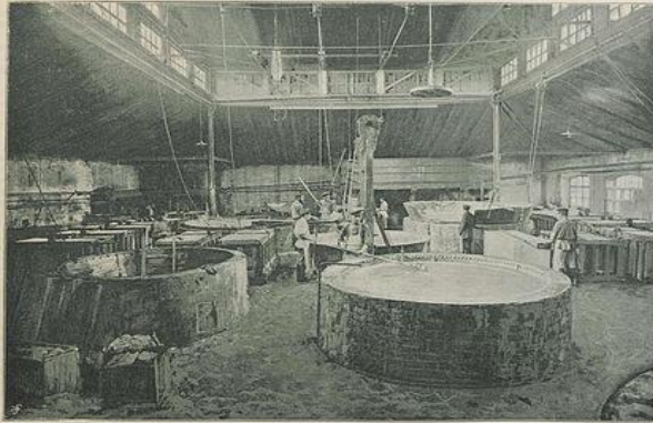
Мыловарня. Авторства Э. Голца.

С большим размахом была организована в 1896 году промышленная и художественная выставка в Нижнем Новгороде. Она была расположена на окском берегу и занимала очень большую территорию. Отдел машиностроения представлял необычайно широкий круг экспонатов.