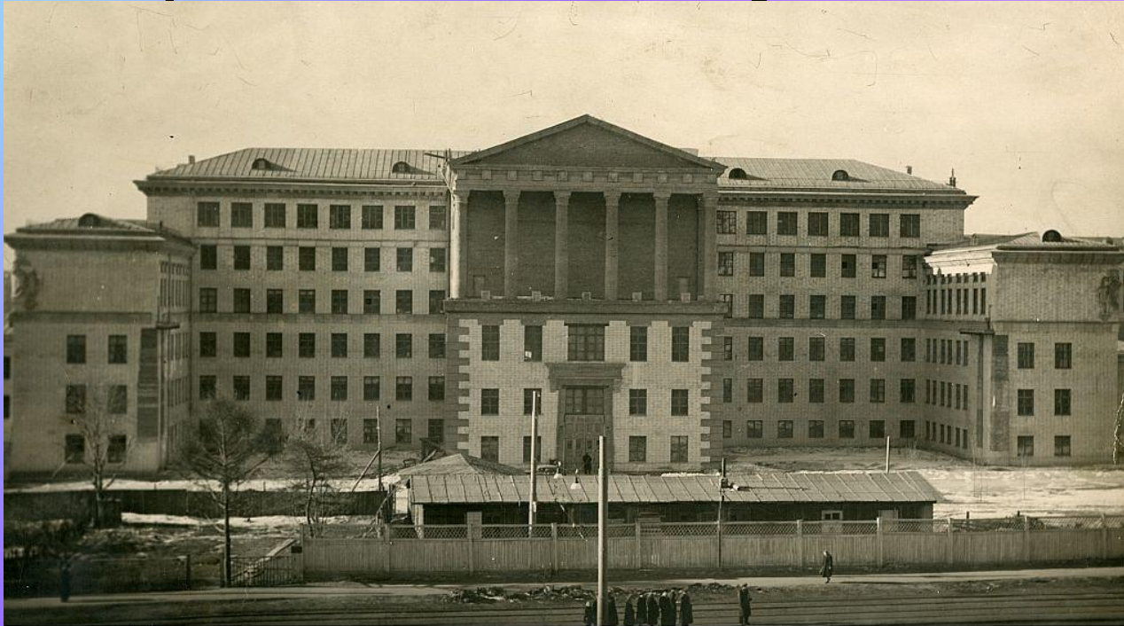
Строительство здания Московского высшего художественно-промышленного училища (б.Строгановское). 1956-1958 гг.