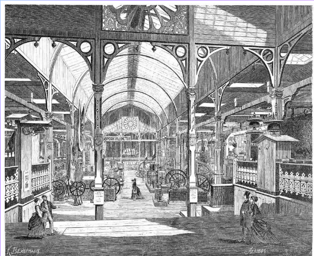
Железное производство и машинное отделение: I. Главный отделъ машинъ. (Рисун. из деп. А. О. Дашкевъ, гравир. К. Вейерманъ).

Намного значительнее предыдущих по своим масштабам была выставка 1870г. в Петербурге, открывая в литейном Соляном городке на набережной реки Фонтанки напротив летнего сада. На ней демонстрировалось 3122 экспоната.