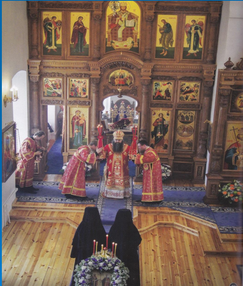
Митрополит Нижегородский и Арзамасский. Освящение престола.