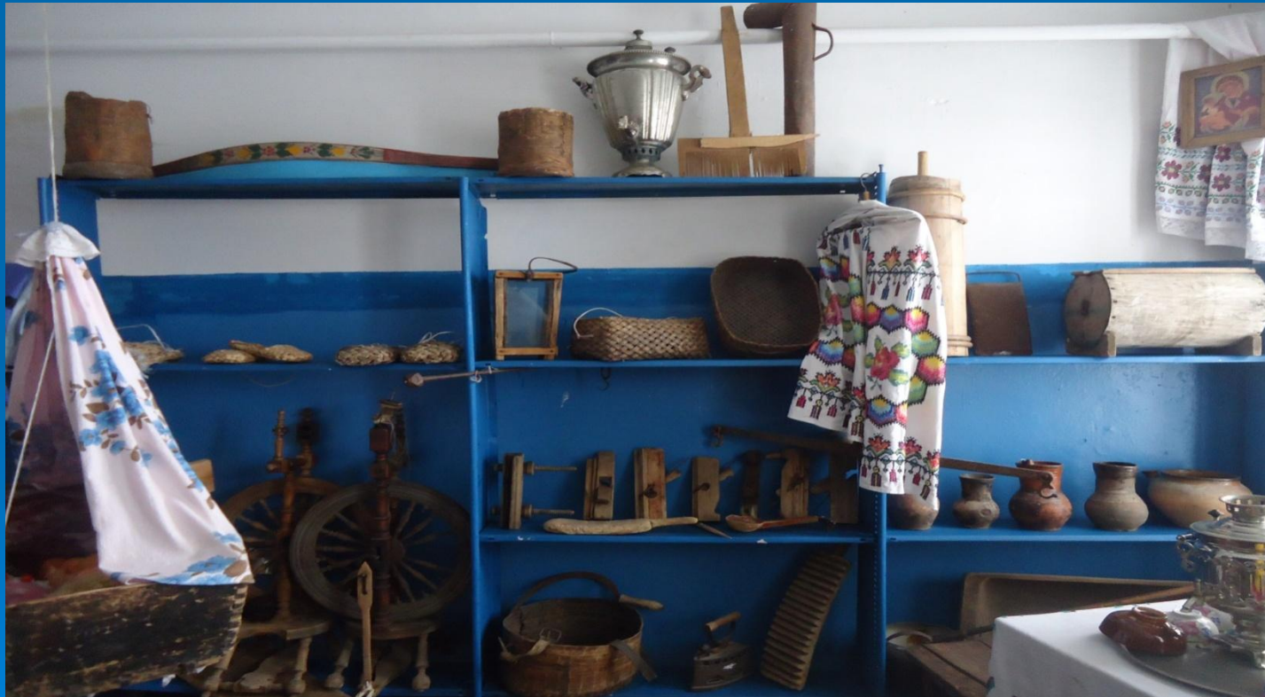
«Русская горница» в Доме Культуры

В «Русской горнице» при местном Доме Культуры имеются образцы старинных кошелей, которые были переданы сюда местными старожилами и бережно здесь хранятся.