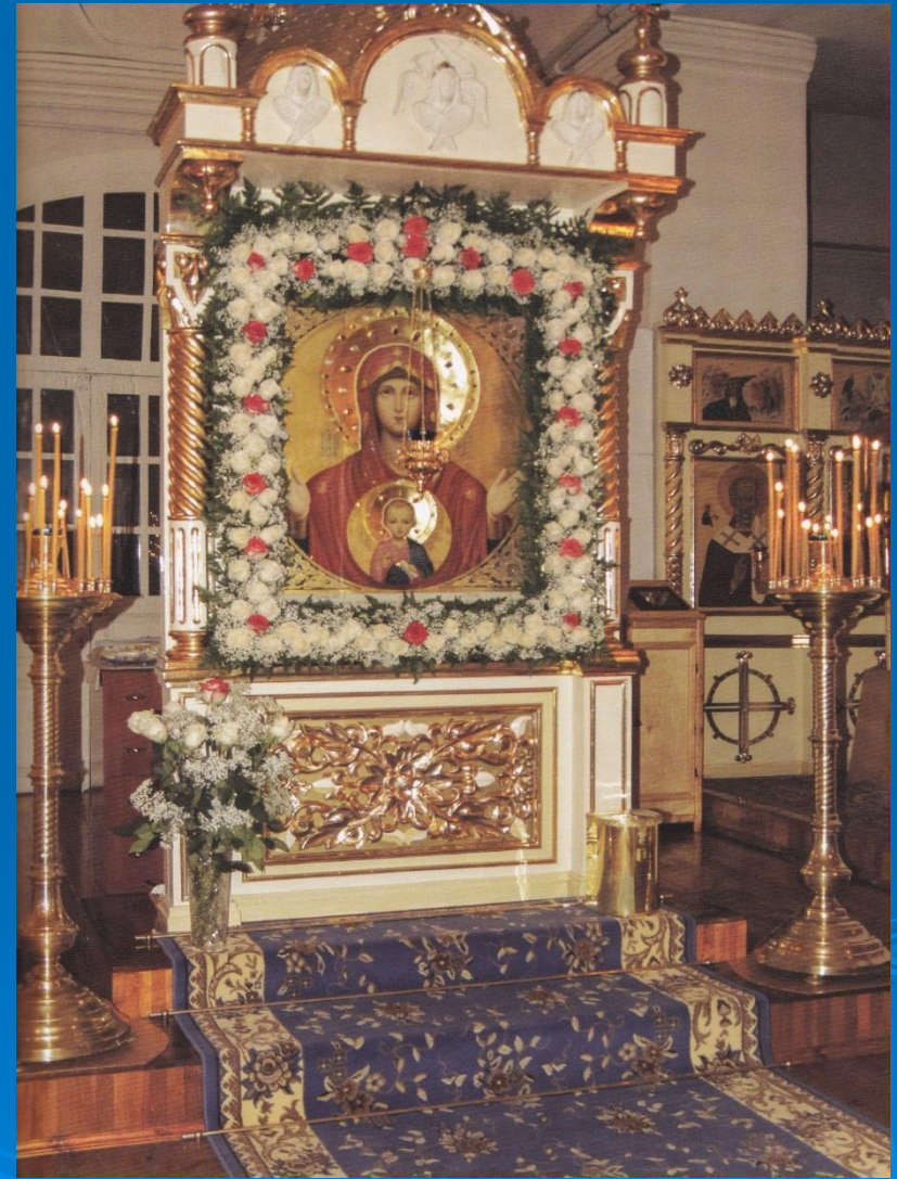
Икона Божией Матери «Знамение»