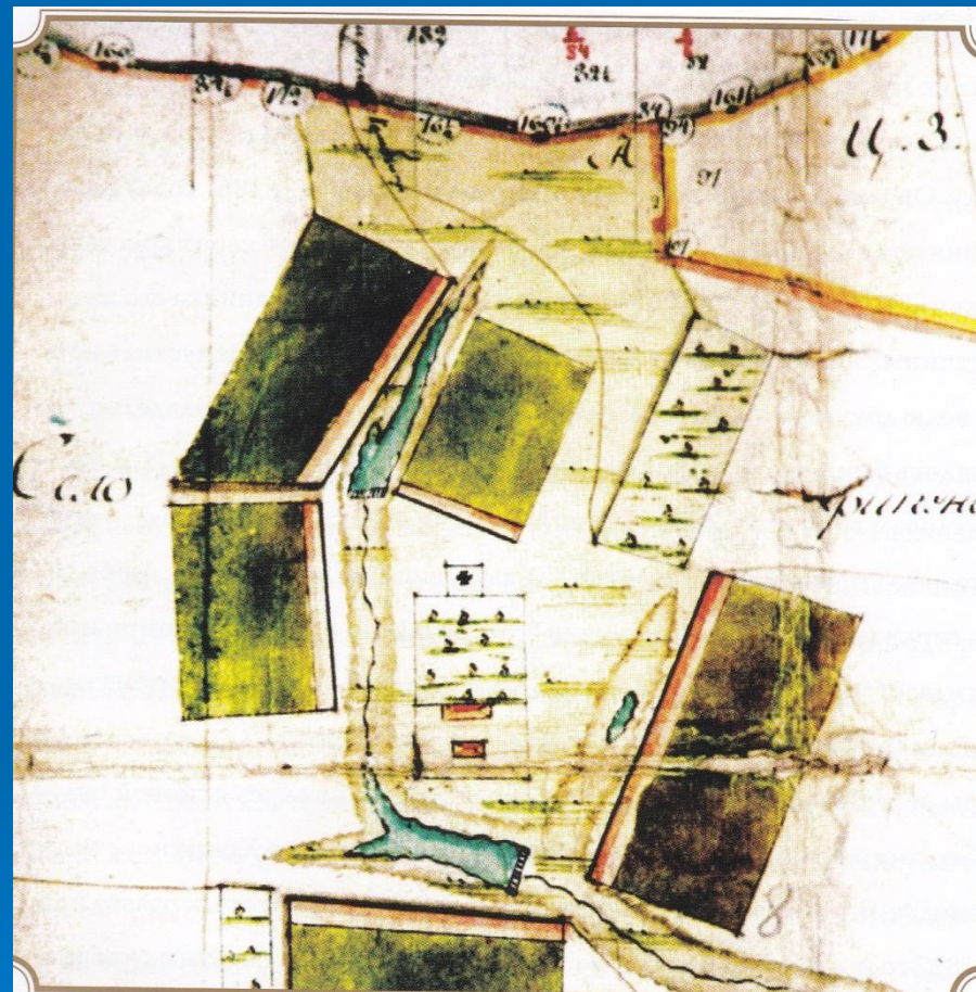
План села Хрипуново. 1829 год.