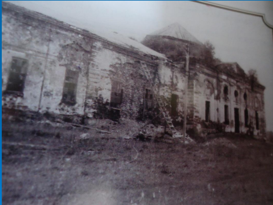
Знаменский храм перед восстановлением

В 1993 году разрушенный храм был передан Свято – Троицкому Серафимо – Дивеевскому монастырю, восстановлен и отреставрирован.