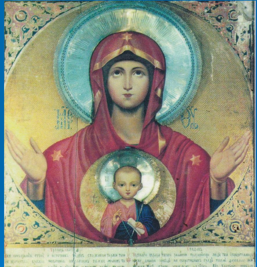
Икона Божией Матери «Знамение»

Основной праздник в честь иконы Божией Матери «Знамение» отмечается 10 декабря – в день празднования Новгородской и Серафимо – Понетаевской икон «Знамение».