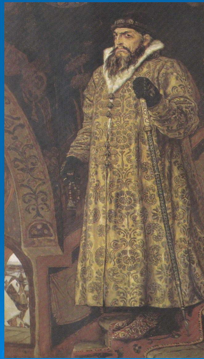
Царь Иван Васильевич Грозный

Письменные источники и предания, бытующие среди жителей села, свидетельствуют о том, что село возникло в период царствования Ивана Грозного, во время третьего похода на Казань в 1552 г.