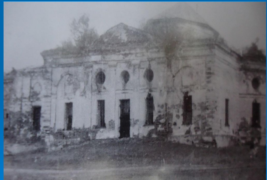
Вид церкви до восстановления