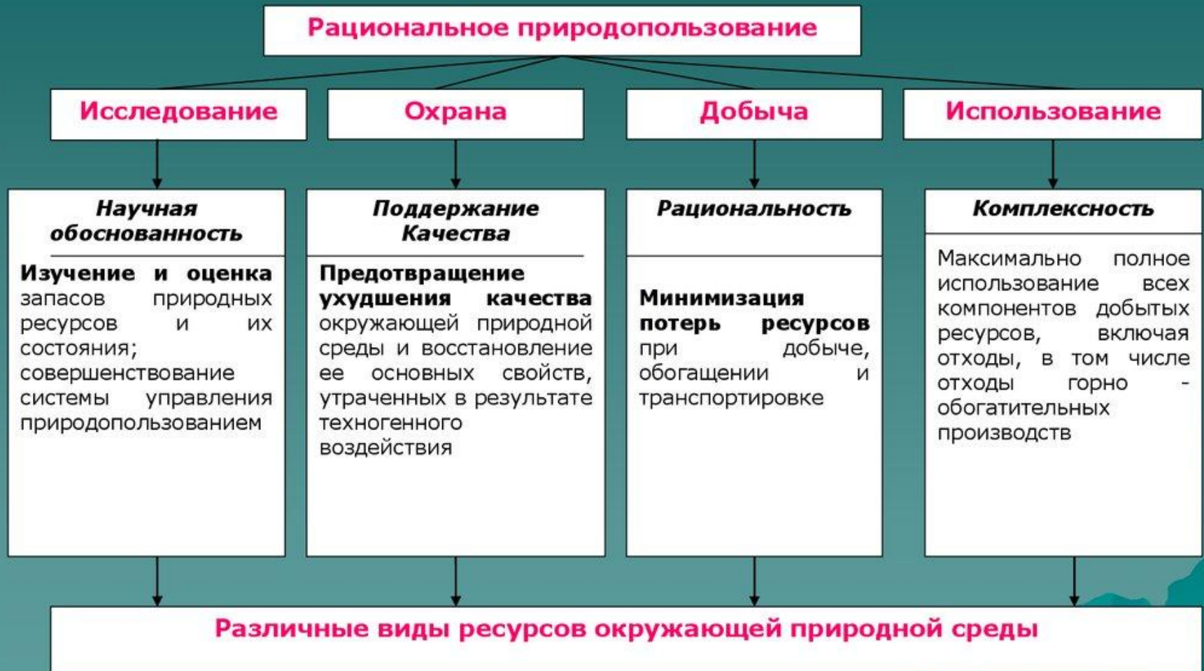
Схема основных принципов реализации рационального природопользования