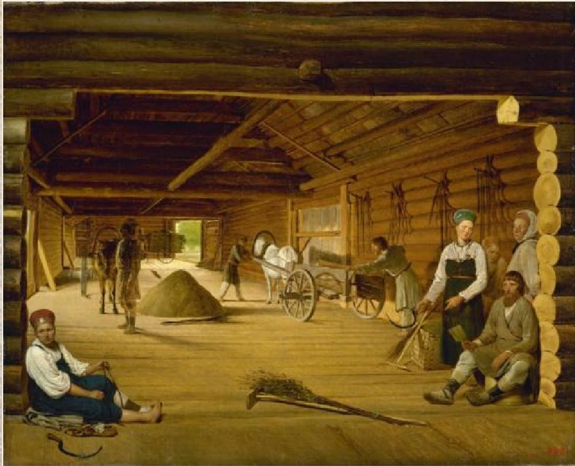
А.Г. Венецианов «Гумно» (1821)