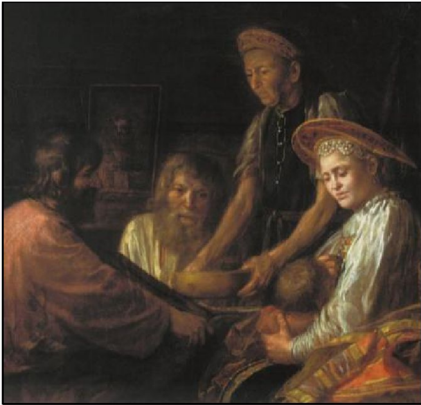
М. Шибанов «Крестьянский обед» (фрагмент, 1774)