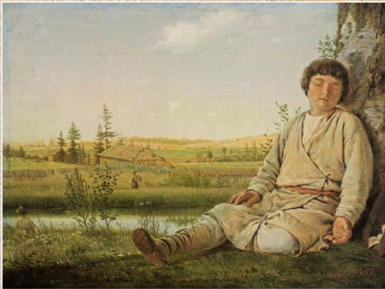
А.Г. Венецианов «Спящий пастушок» (1823-1824)