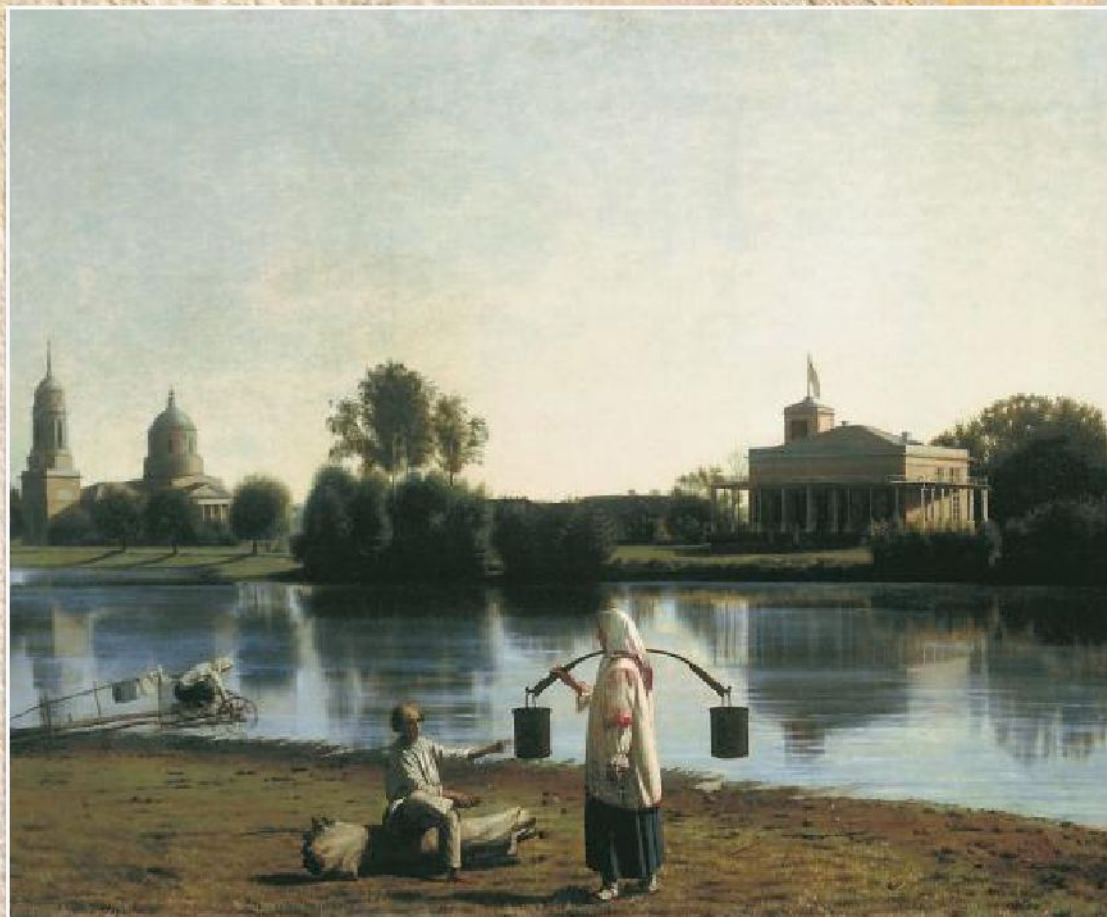
Г.В. Сорока «Вид в имени Спасское Тамбовской губернии» (ок.1840)