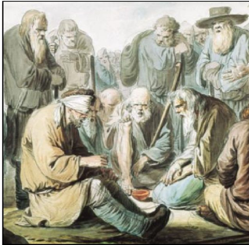
И.А. Ерменёв «Поющие слепцы» (фрагмент, ок. 1775)

Русский живописец. Один из родоначальников бытового жанра в русском искусстве.