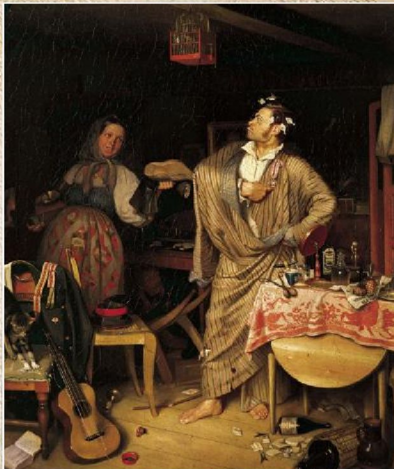
П.А. Федотов «Свежий кавалер» (1846)