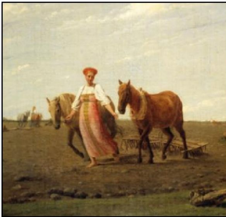
А.Г. Венецианов «На пашне. Весна» (фрагмент, ок.1820)

В противовес академической живописи в русском искусстве начинают появляться жанровые произведения, имеющие демократическую направленность.