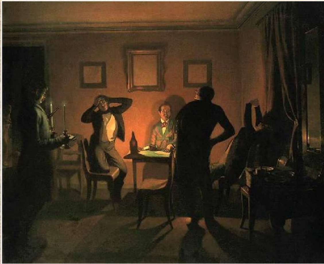
П.А. Федотов «Игроки» (1852)