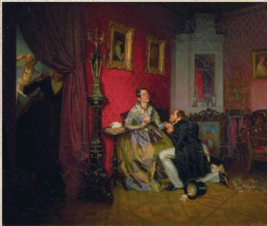
П.А. Федотов «Разборчивая невеста» (1847)