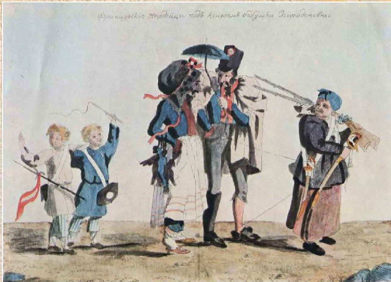
А.Г. Венецианов «Французские гвардейцы под конвоем бабушки Спиридоновны» (1813)