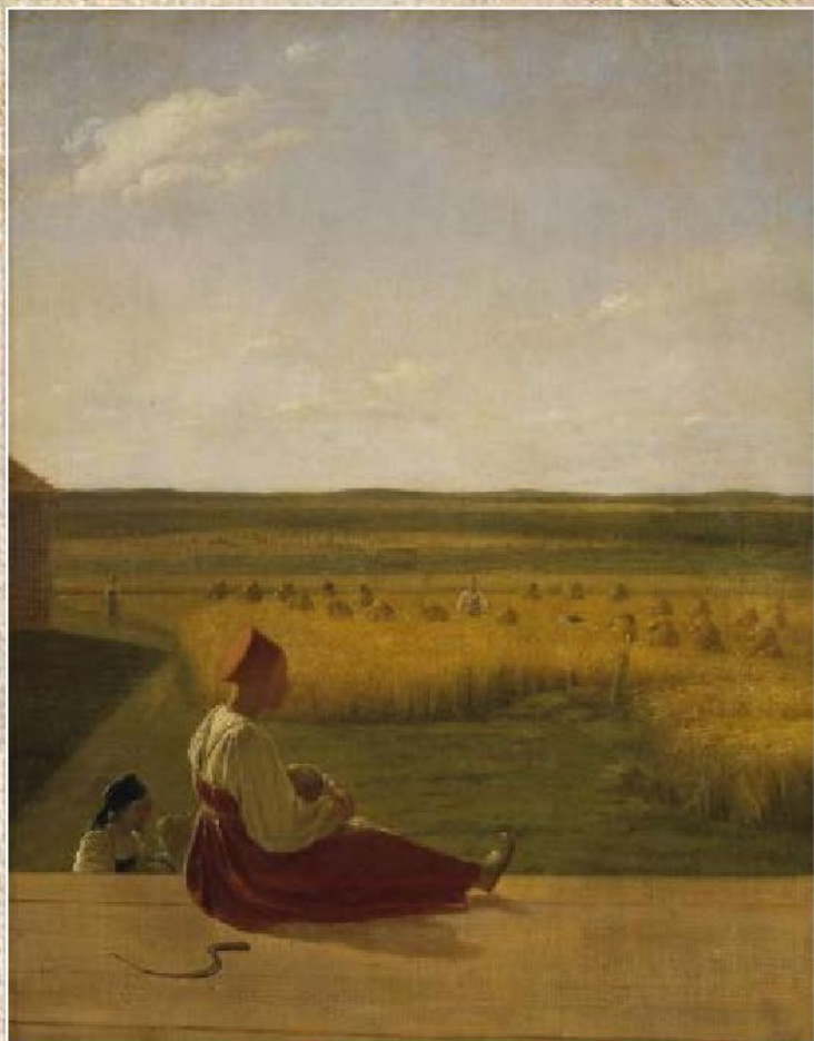
А.Г. Венецианов «На жатве. Лето» (ок.1820)