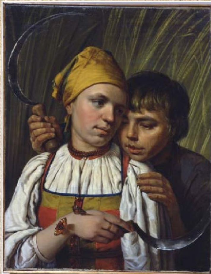
А.Г. Венецианов «Жнецы» (ок. 1825)