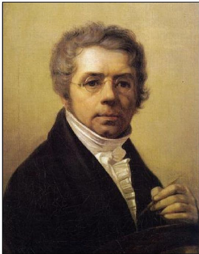
А.Г. Венецианов «Автопортрет» (1811)