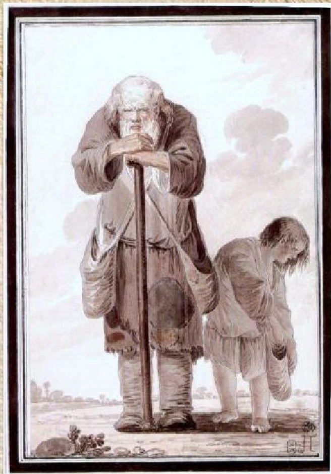
И.А. Ерменёв «Старик-нищий с мальчиком-поводырем» (из серии «Нищие», ок. 1775)