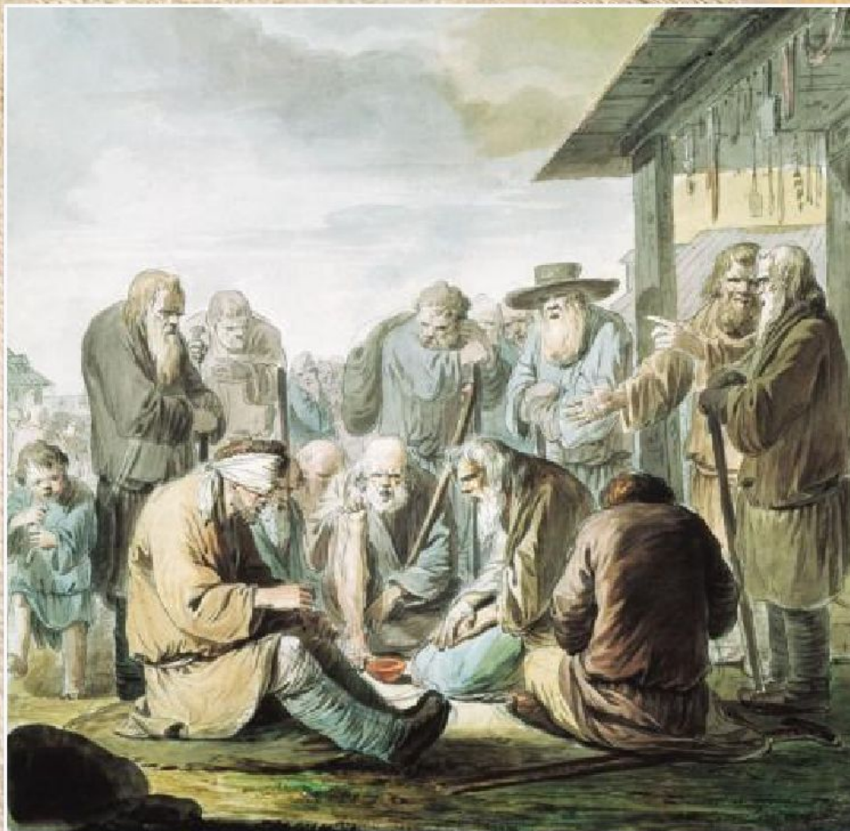
И.А. Ерменёв «Поющие слепцы» (из серии «Нищие», ок. 1775)