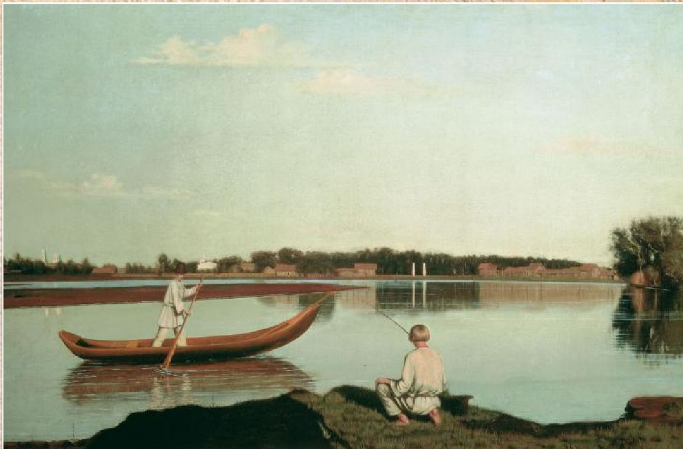
Г.В. Сорока «Рыбаки. Вид в Спасском» (ок.1840)