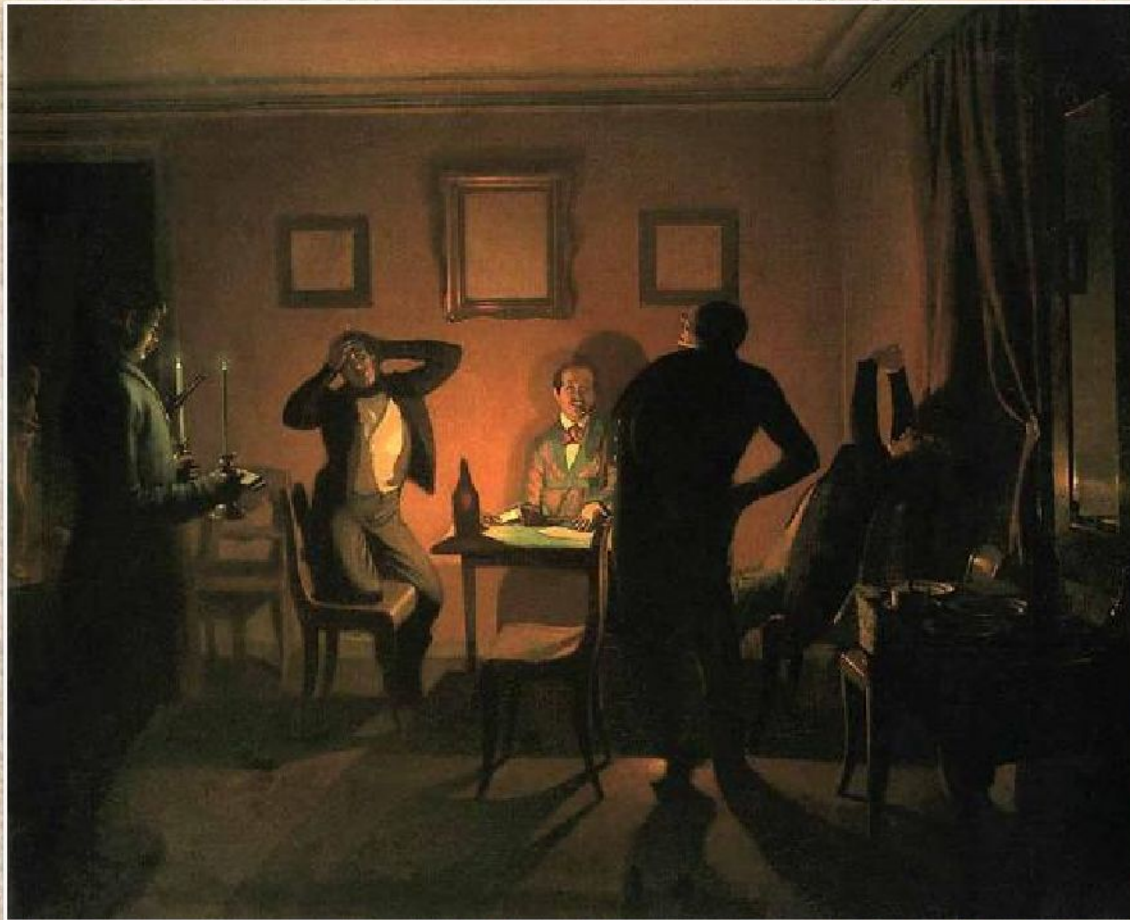
П.А. Федотов «Игроки» (1852)