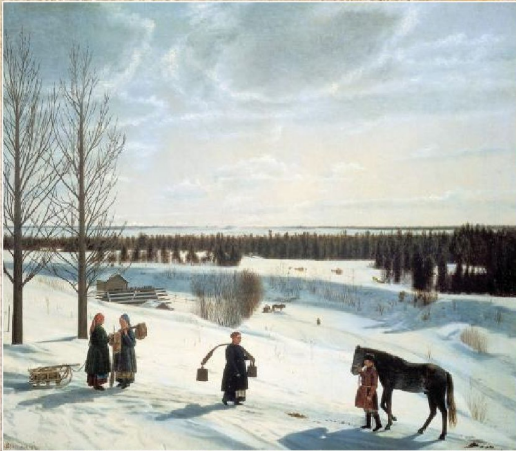
Н.С. Крылов «Русская зима» (1827)