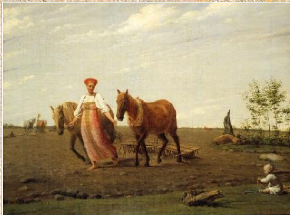
А.Г. Венецианов «На пашне. Весна» (ок.1820)

Выполнить в рабочей тетради описание одного из ярких примеров русской жанровой живописи XIX века.