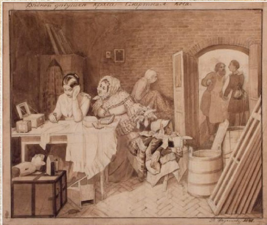
П.А. Федотов «Бедной девушке краса – смертная коса» (1846)