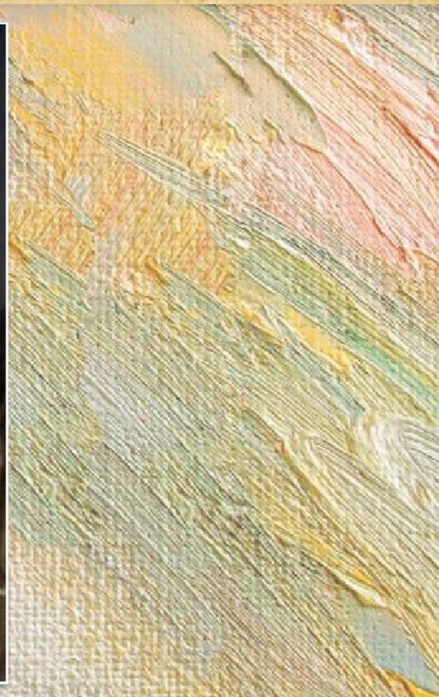
А.Г. Венецианов «Захарка» (1825)