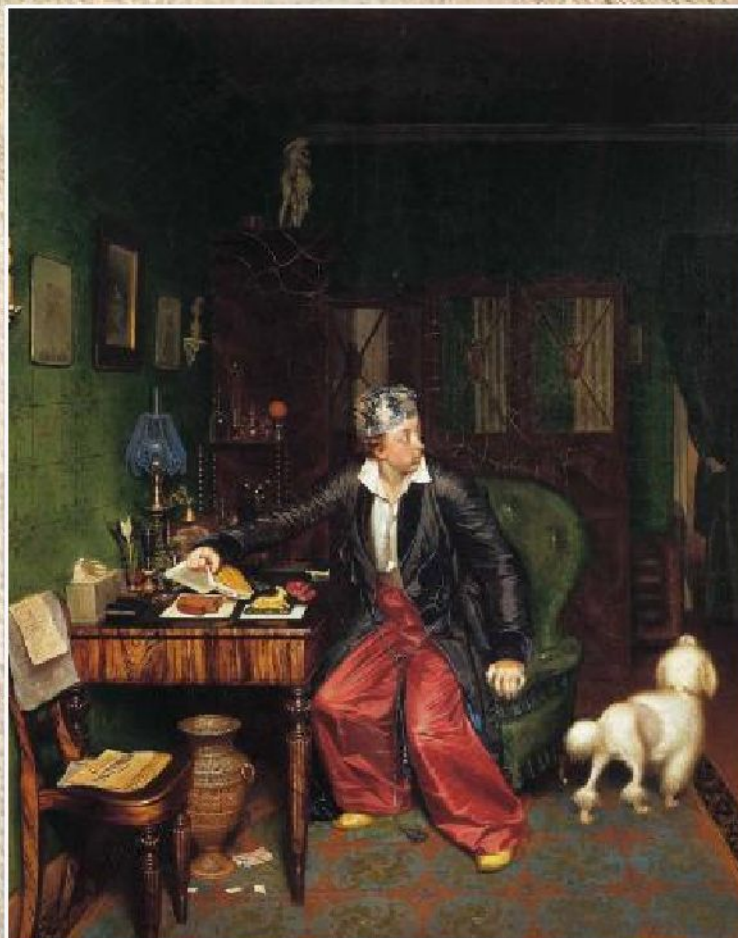
П.А. Федотов «Завтрак аристократа» (1849 - 1850)