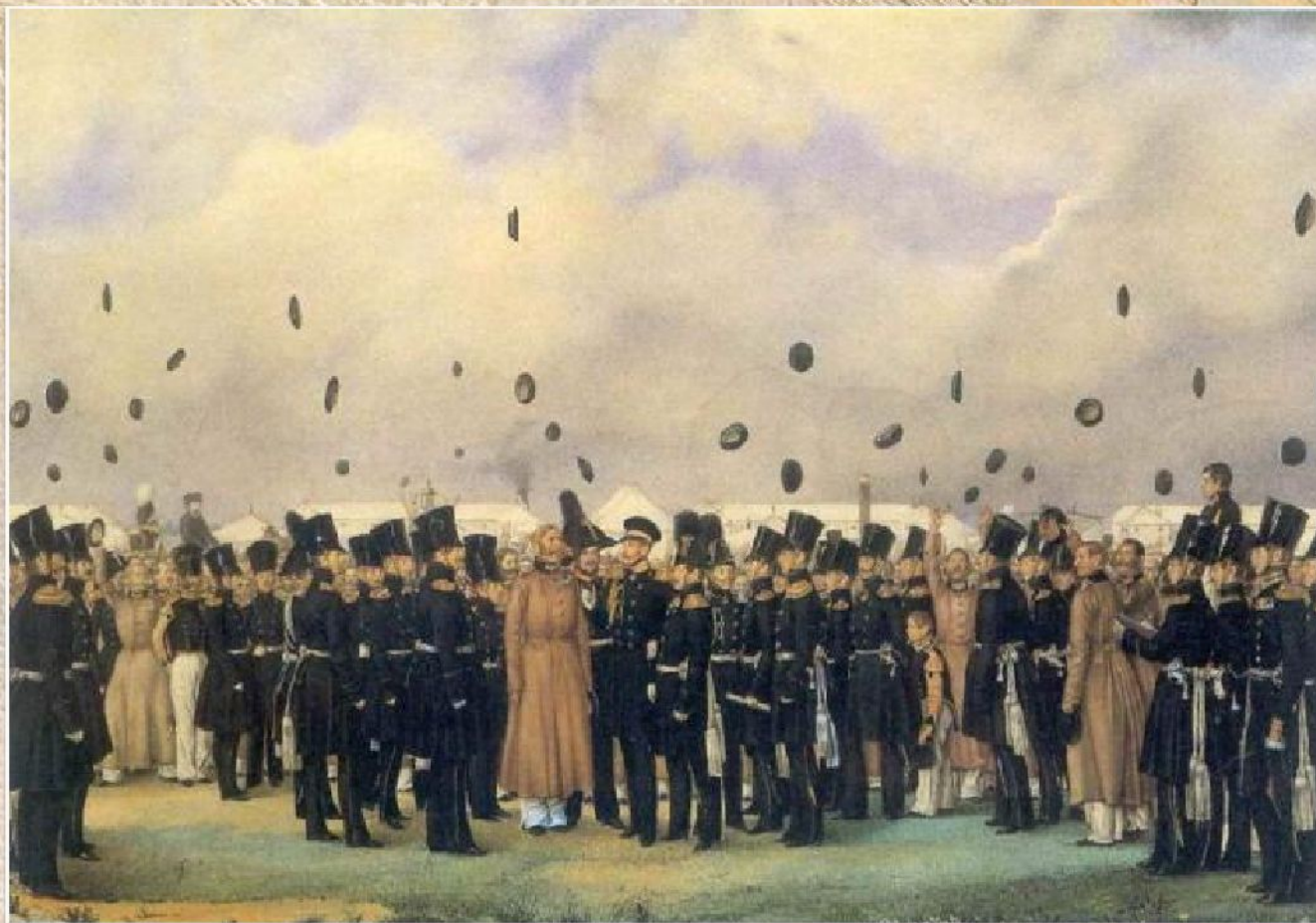
П.А. Федотов «Встреча великого князя» (1838)