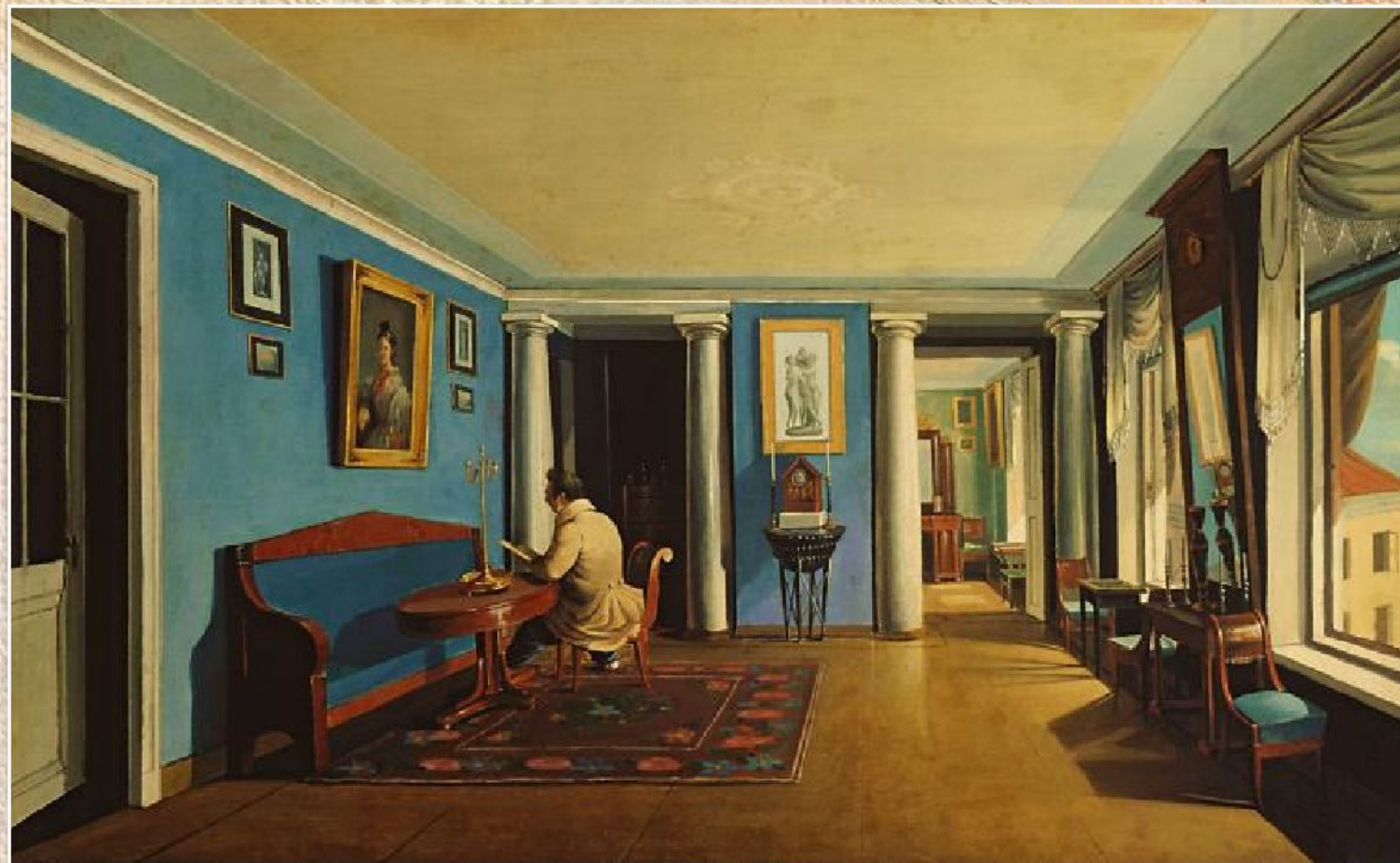
К.А. Зеленцов «В комнатах. Гостиная с колоннами на антресолях» (конец 1820-х - 1830-е)