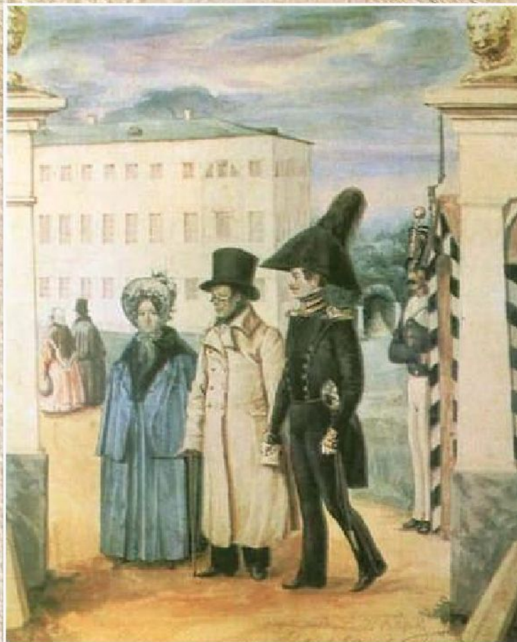
П.А. Федотов «Прогулка» (1837)