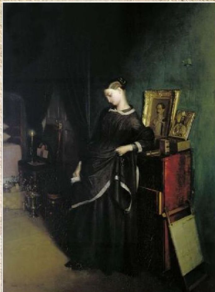
П.А. Федотов «Вдовушка» (1851-1852)