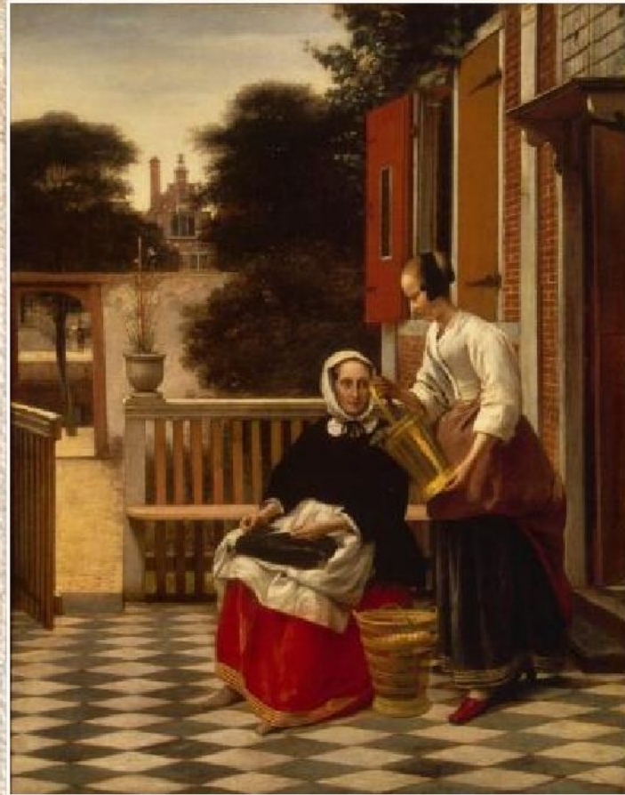
Питер де Хох «Хозяйка и служанка», 1660

(Академия художеств в жанровой живописи ориентировалась на наследие «малых голландцев»)