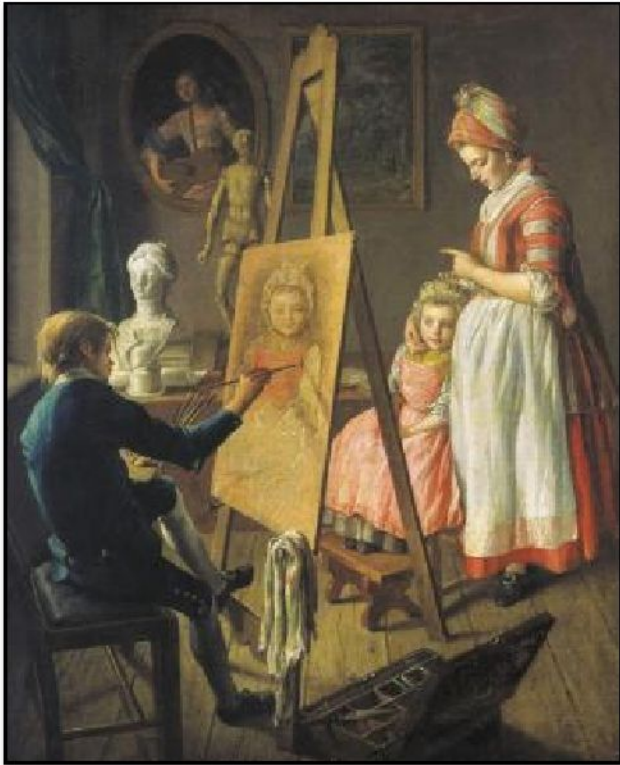
И.И. Фирсов «Юный живописец» (1765-1770)

Академия художеств рассматривала бытовой жанр как низший по сравнению с историческим жанром.