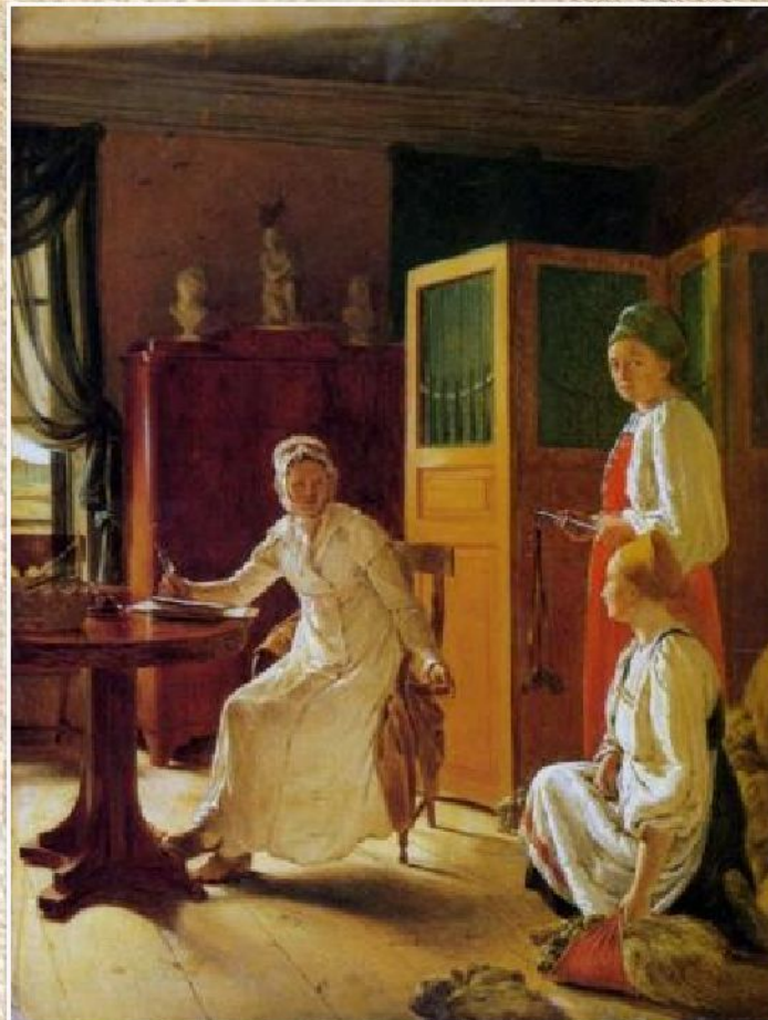
А.Г. Венецианов «Утро помещицы» (1823)