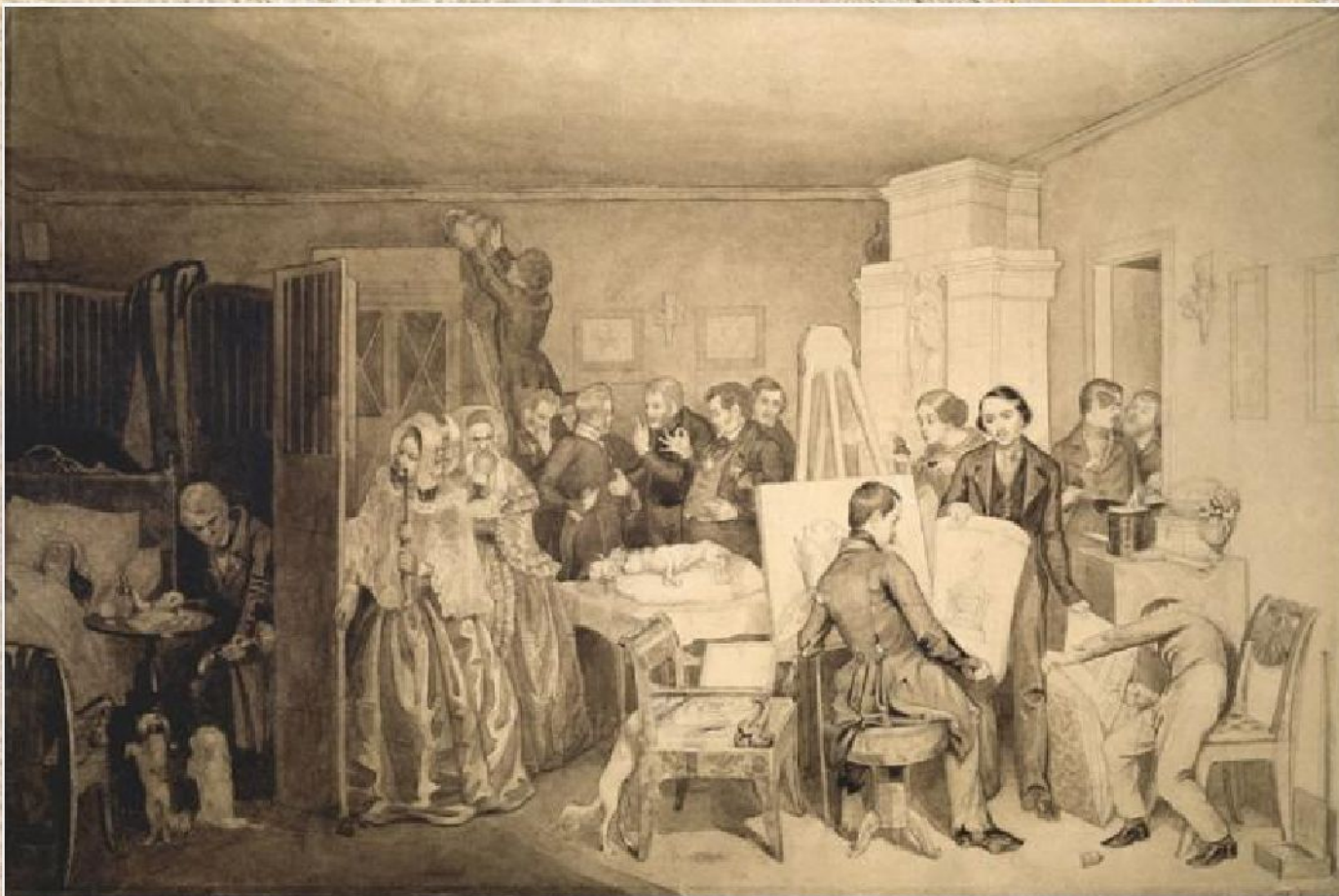
П.А. Федотов «Следствие кончины Фидельки» (1844)