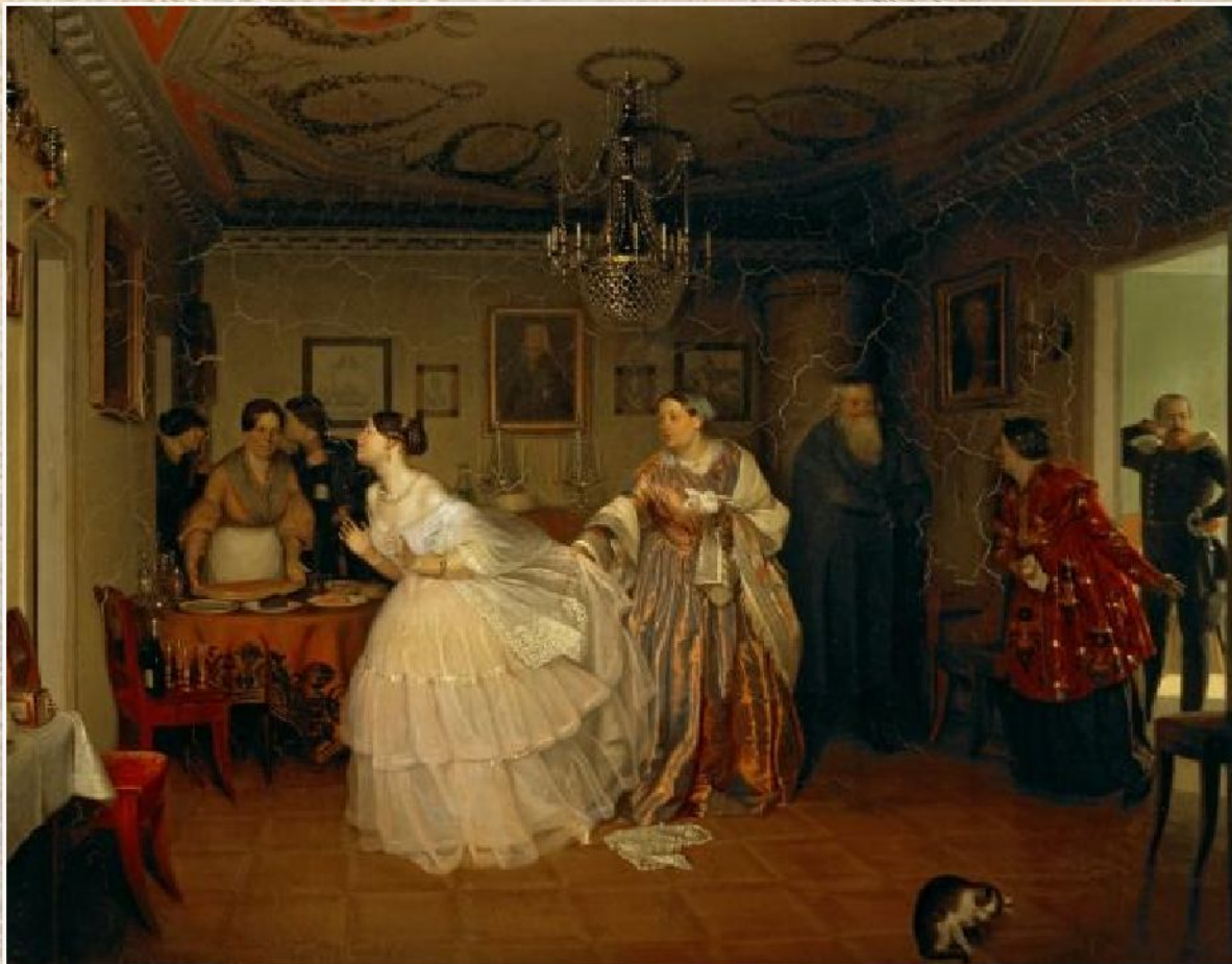
П.А. Федотов «Сватовство майора» (1848)