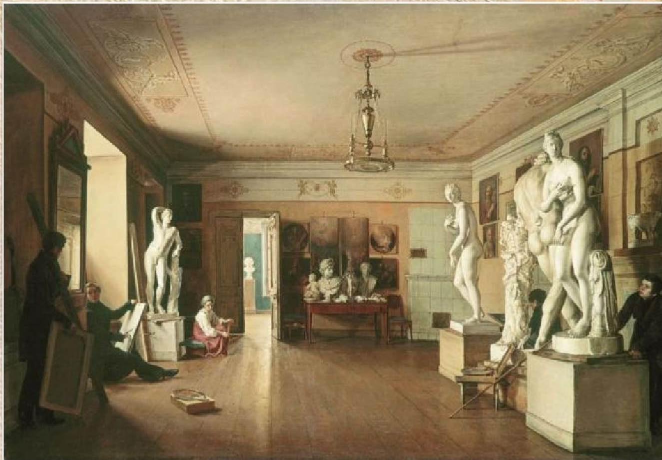
А.А. Алексеев «Мастерская художника А.Г. Венецианова в Петербурге» (1827)