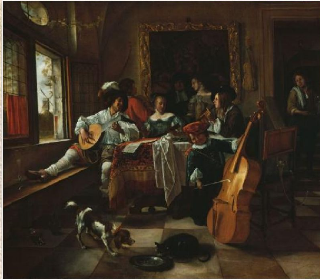
Ян Стен «Семейный концерт», 1666 (Академия художеств в жанровой живописи ориентировалась на наследие «малых голландцев»)