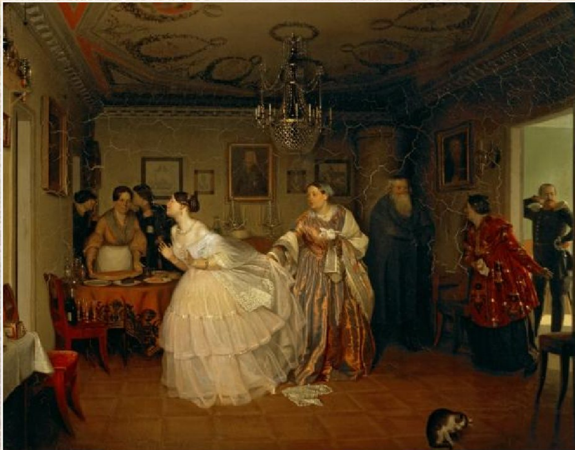
П.А. Федотов «Сватовство майора» (1848)