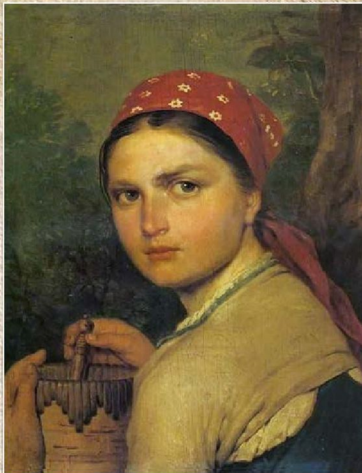
А.Г. Венецианов «Девушка с бураком» (1824)