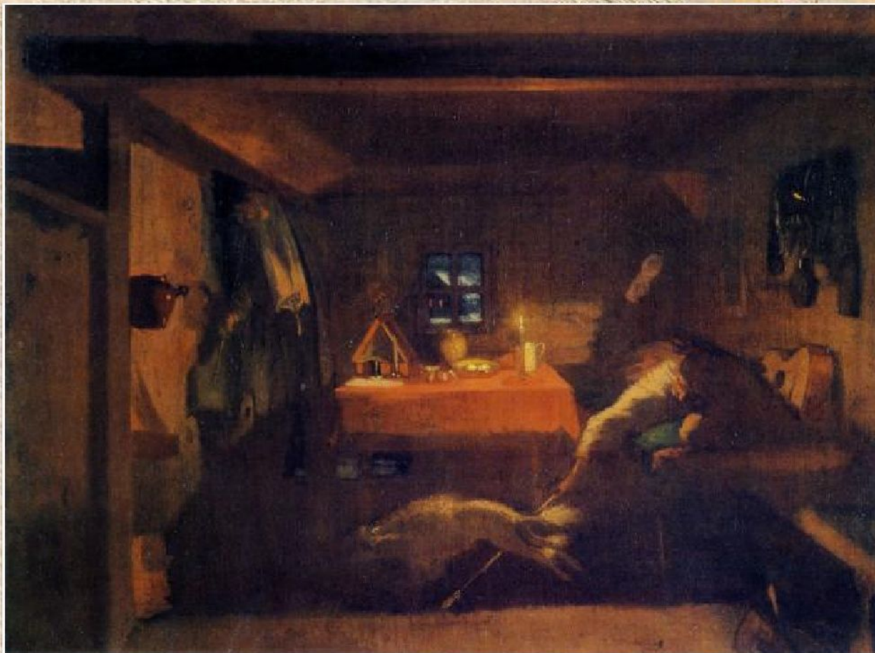
П.А. Федотов «Анкор, ещё анкор!» (1851 - 1852)