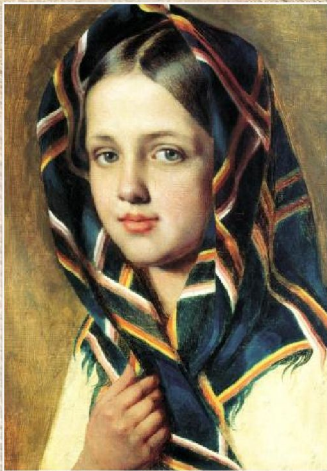
А.Г. Венецианов «Девушка в платке» (ок.1830)