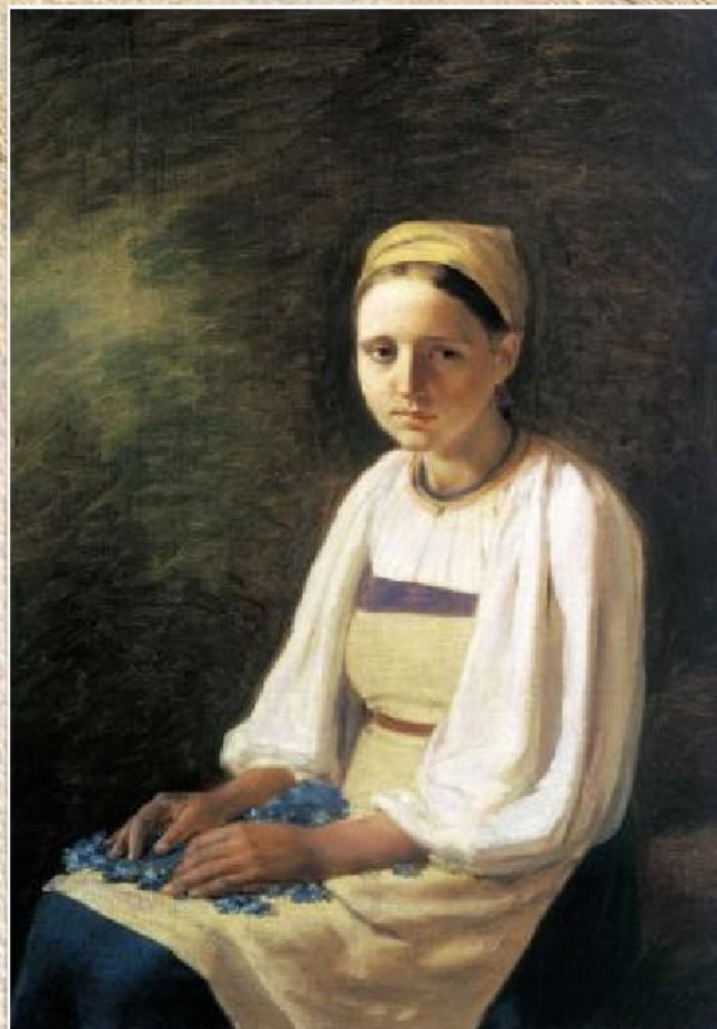
А.Г. Венецианов «Крестьянка с васильками» (ок.1820)