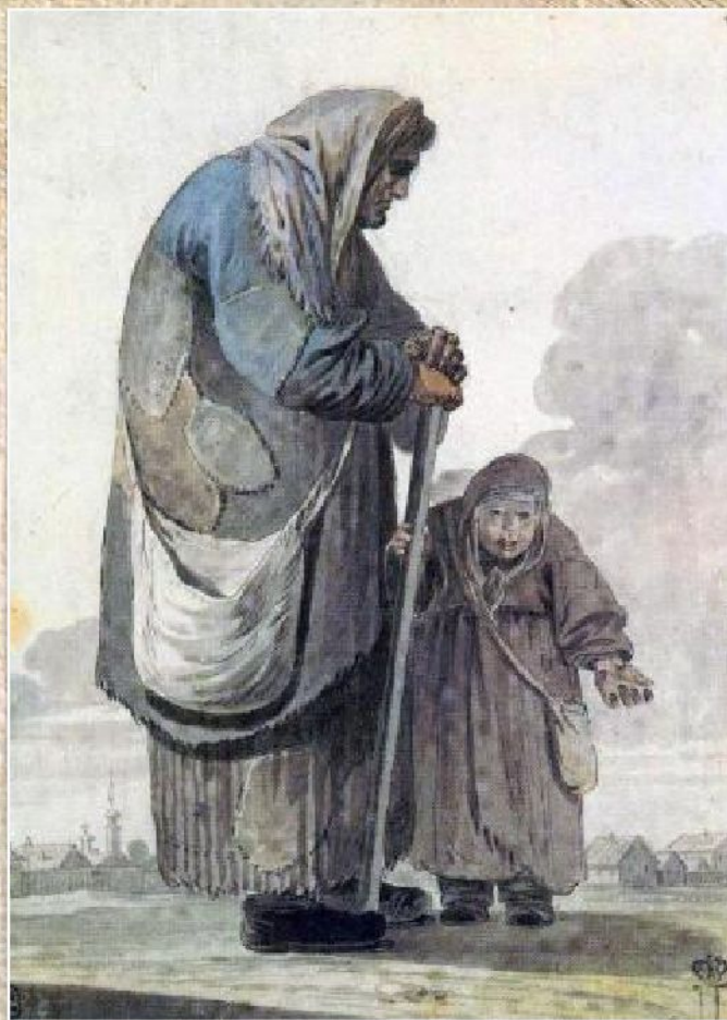
И.А. Ерменёв «Нищая с девочкой-поводырем» (из серии «Нищие», ок. 1775)