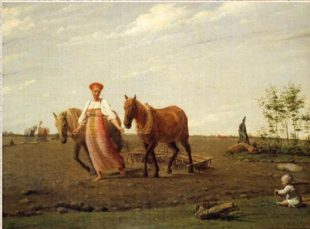
А.Г. Венецианов «На пашне. Весна» (ок.1820)