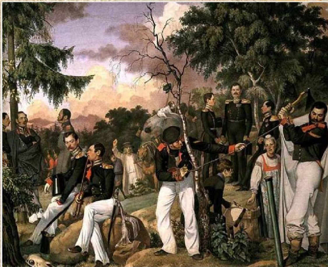
П.А. Федотов «Бивуак лейб-гвардии Финляндского полка» (1843)