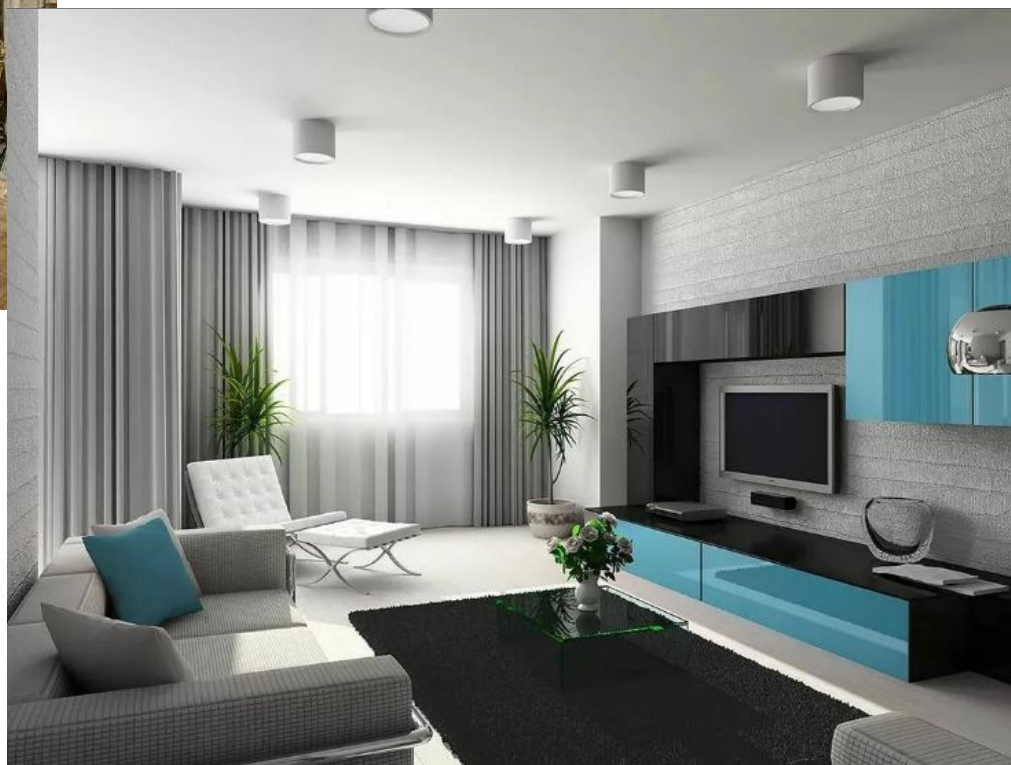
Интерьер современной гостиной