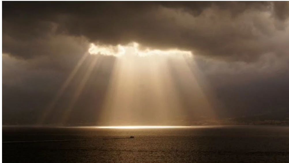
свет неба, затянутого тучами