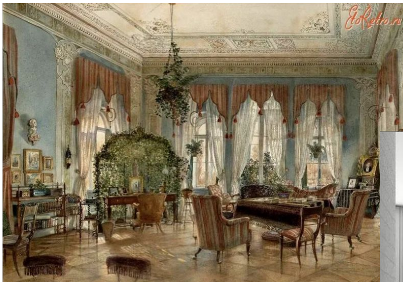
Интерьер гостиной дворянского дома

Пространство подчиняется времени. Сравните изображения.