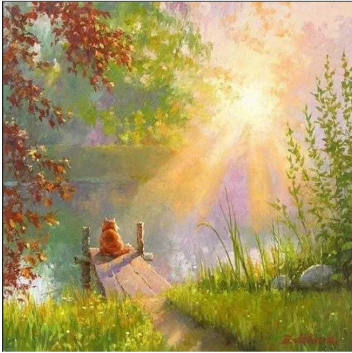
яркий солнечный свет

Любое пространство видоизменяется и воспринимается по-разному. Восприятие природы во многом зависит от освещённости.