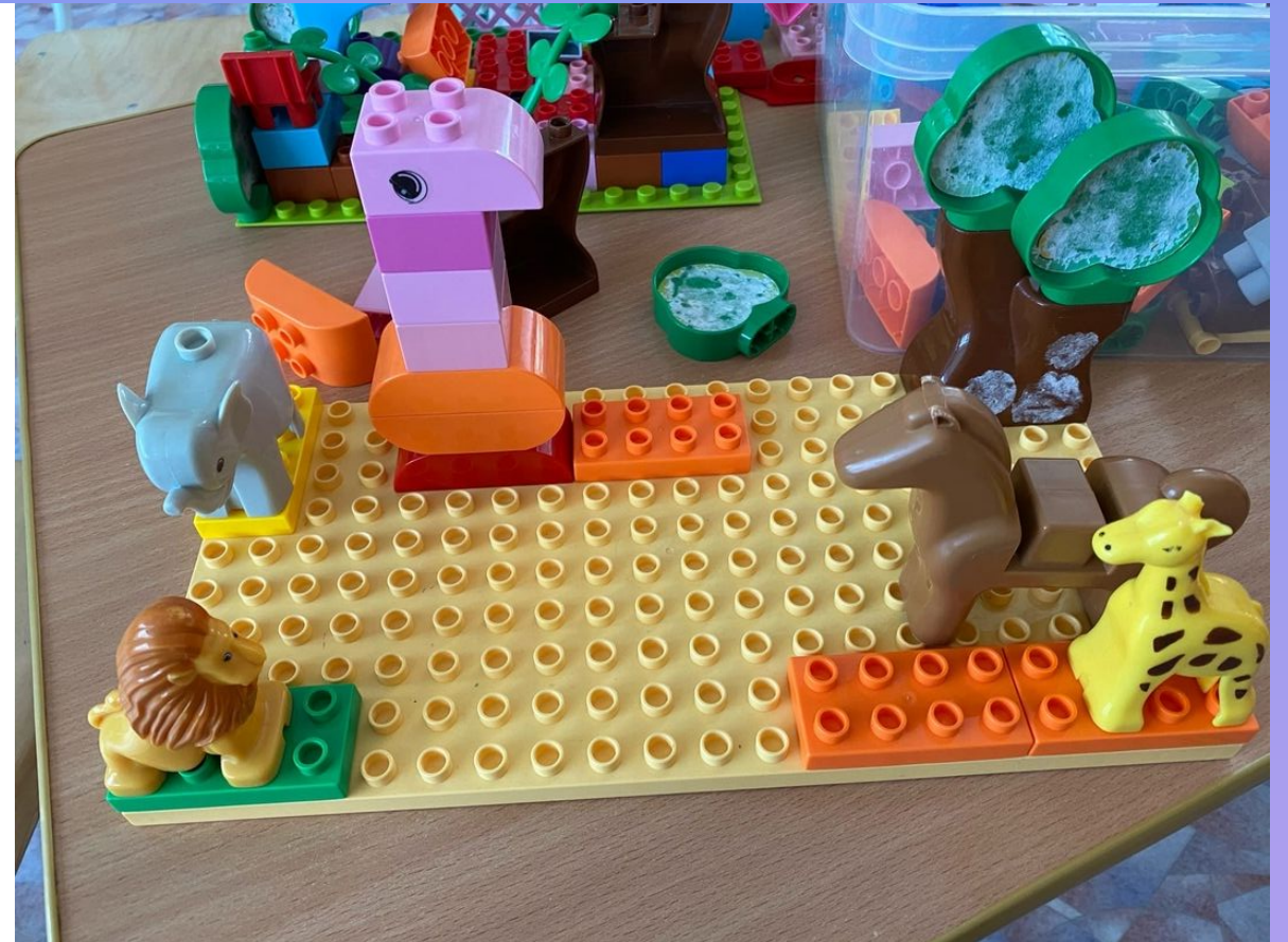
LEGO DUPLO Зоопарк