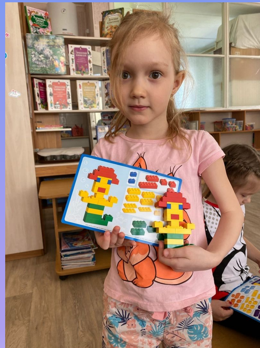
Фотографии с занятий по лего конструированию