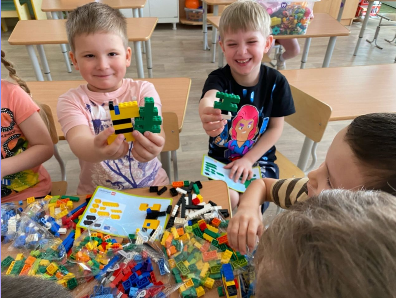
Жираф из Lego для творческих занятий