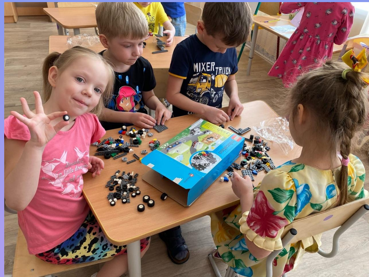
LEGO «Набор с колесами»