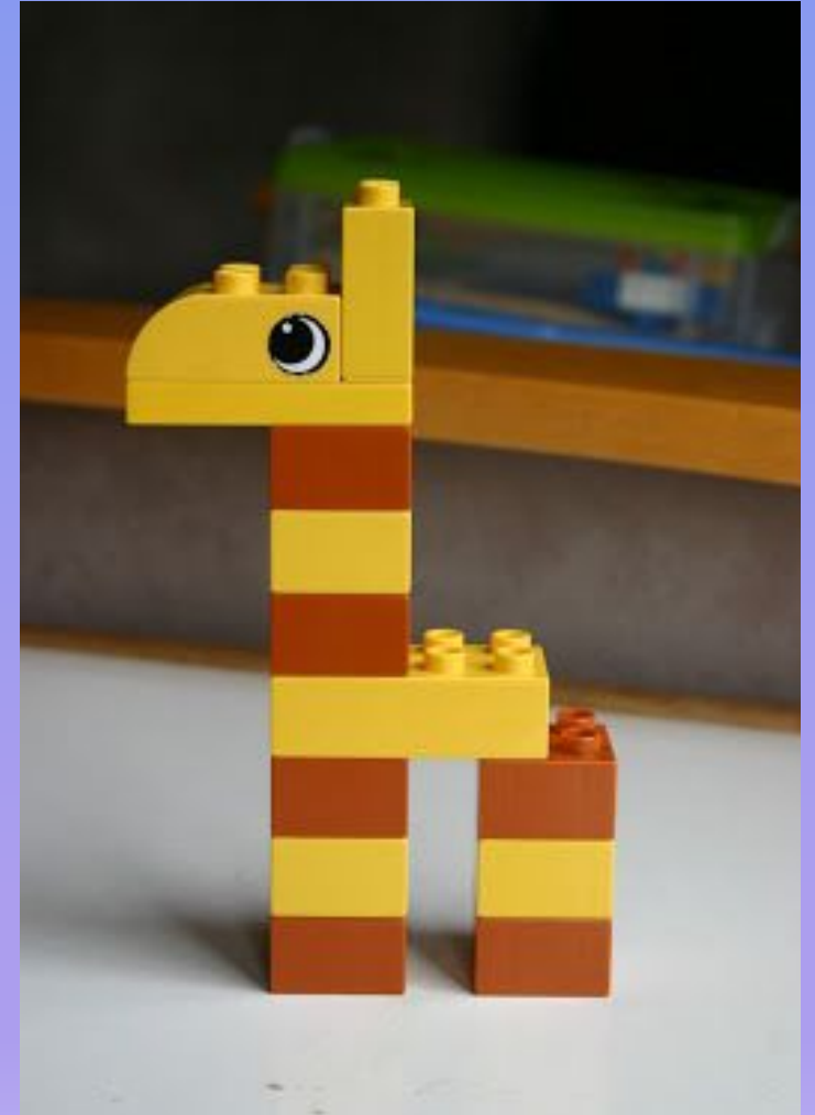
Жираф из Lego Duplo