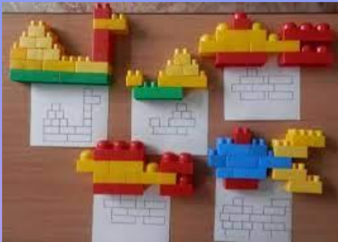
Схемы - зарисовки построек