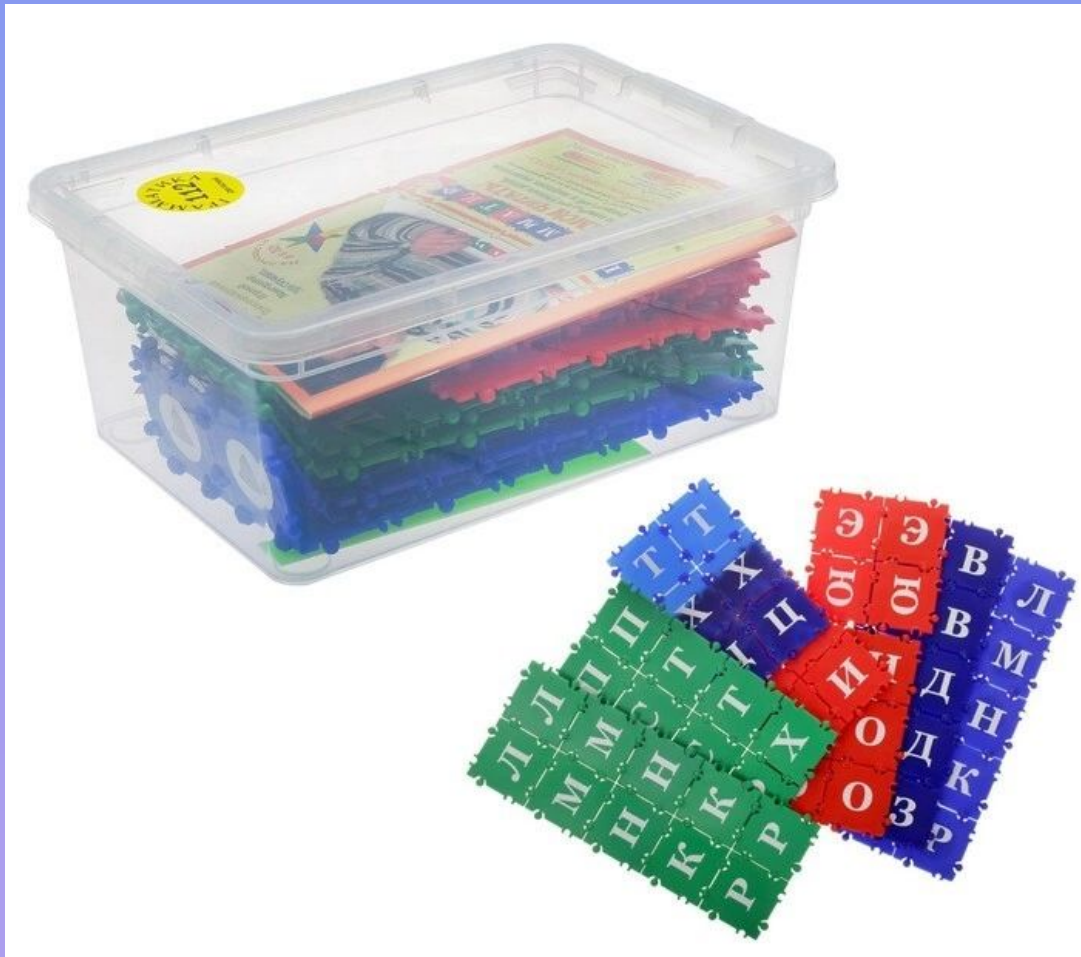
ТИКО «Логопедический набор»