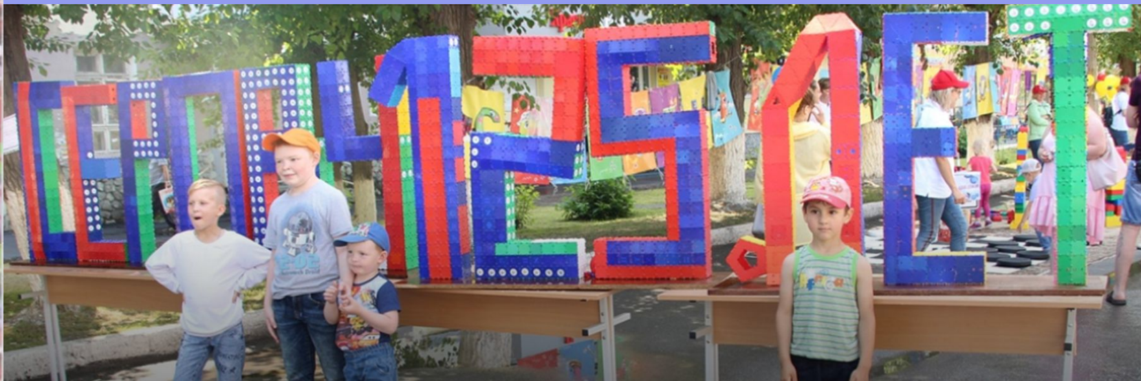
Модель из тико - конструктора