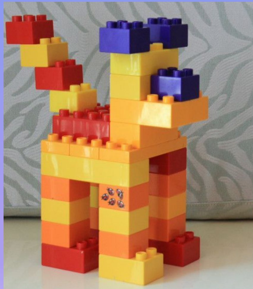
Собака из Lego конструктора