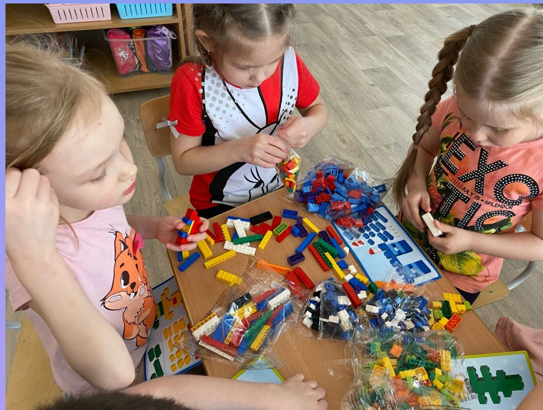
Строительство дома для Незнайки