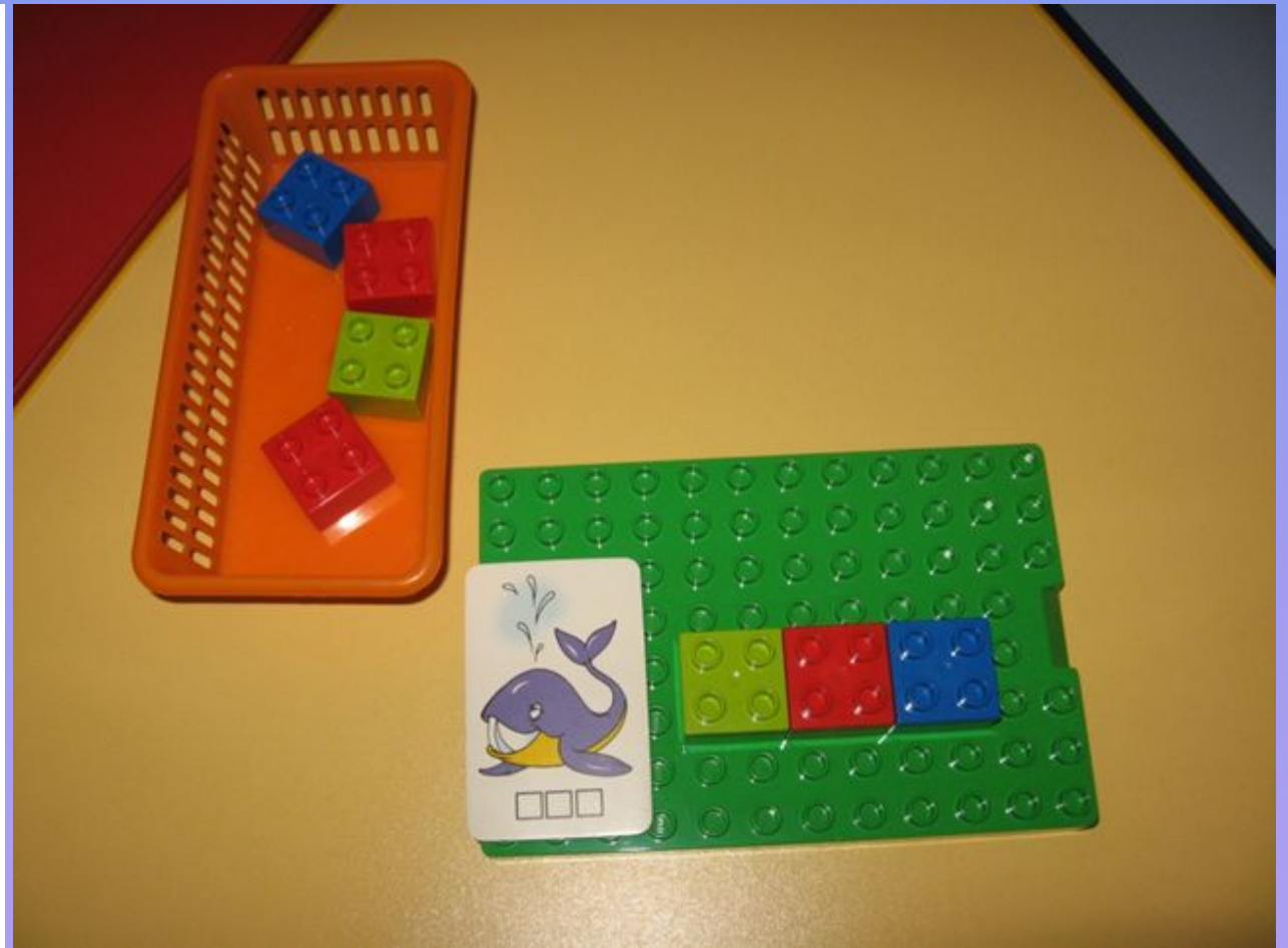
Разбор слова на звуки