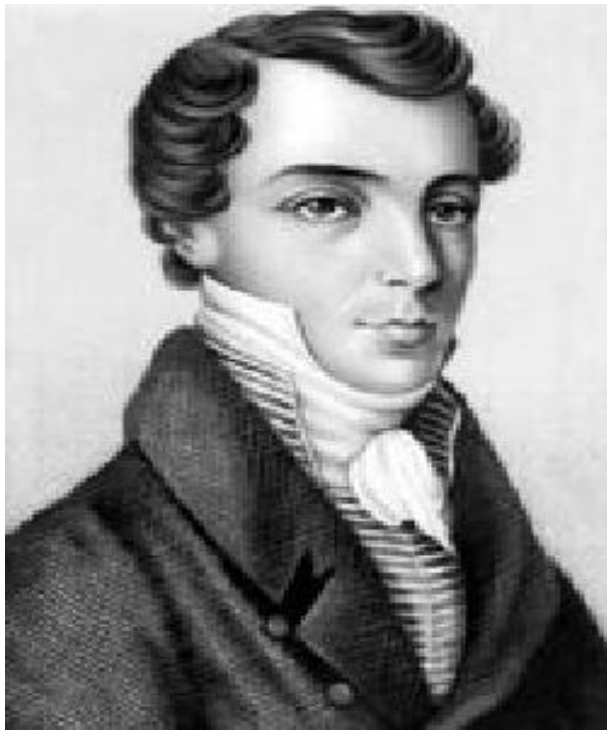
Поэт-декабрист Кондратий фёдорович рылеев (1795 - 1826)

Русский поэт, общественный деятель, один из пяти казнённых руководителей восстания декабристов