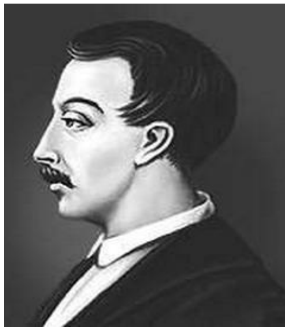
Поэт-декабрист Вильгельм Карлович Кюхельбекер (1797 – 1846)

Русский поэт, писатель, общественный деятель, лицейский друг Пушкина