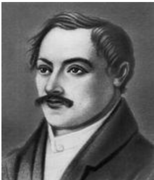
Поэт-декабрист Александр Иванович Одоевский (1803 - 1839)

Именно он от лица всех ссыльных ответил стихами на слова пушкинского послания "В Сибирь" — "Струн вещей пламенные звуки до слуха нашего дошли..."