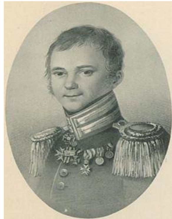
Поэт-декабрист Фёдор николаевич гинка (1786 - 1880)

Русский поэт, общественный деятель, один из пяти казнённых руководителей восстания декабристов