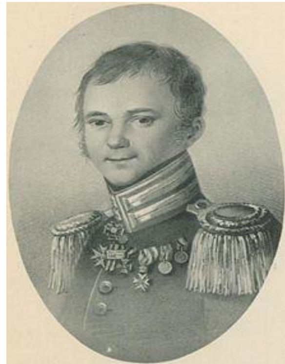
Поэт-декабрист Фёдор николаевич глинка (1786 - 1880)

Русский поэт, общественный деятель, один из пяти казнённых руководителей восстания декабристов