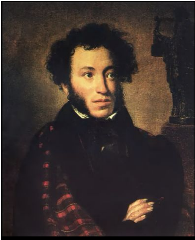
Великий русский поэт Александр Сергеевич Пушкин (1799 – 1836)