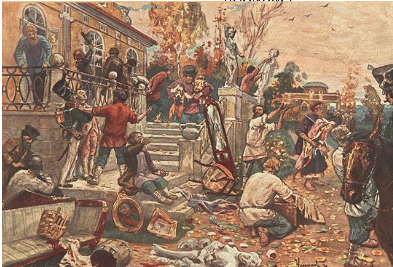
Крестьянские волнения. Разорение помещичьей усадьбы

Крестьяне после войны 1812 г. становятся менее покорными и быстрее переходят от простого неповиновения к отпору помещикам и правительственным властям, от обороны к нападению. Однако все эти выступления были подавлены, а их участники ничего не добились.