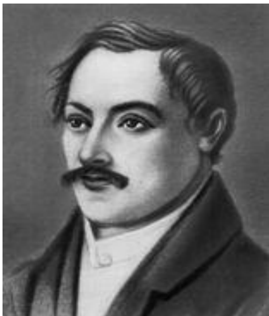
Поэт-декабрист Александр Иванович Одоевский (1803 - 1839)

Именно он от лица всех ссыльных ответил стихами на слова пушкинского послания "В Сибирь" — "Струн вещей пламенные звуки до слуха нашего дошли..."