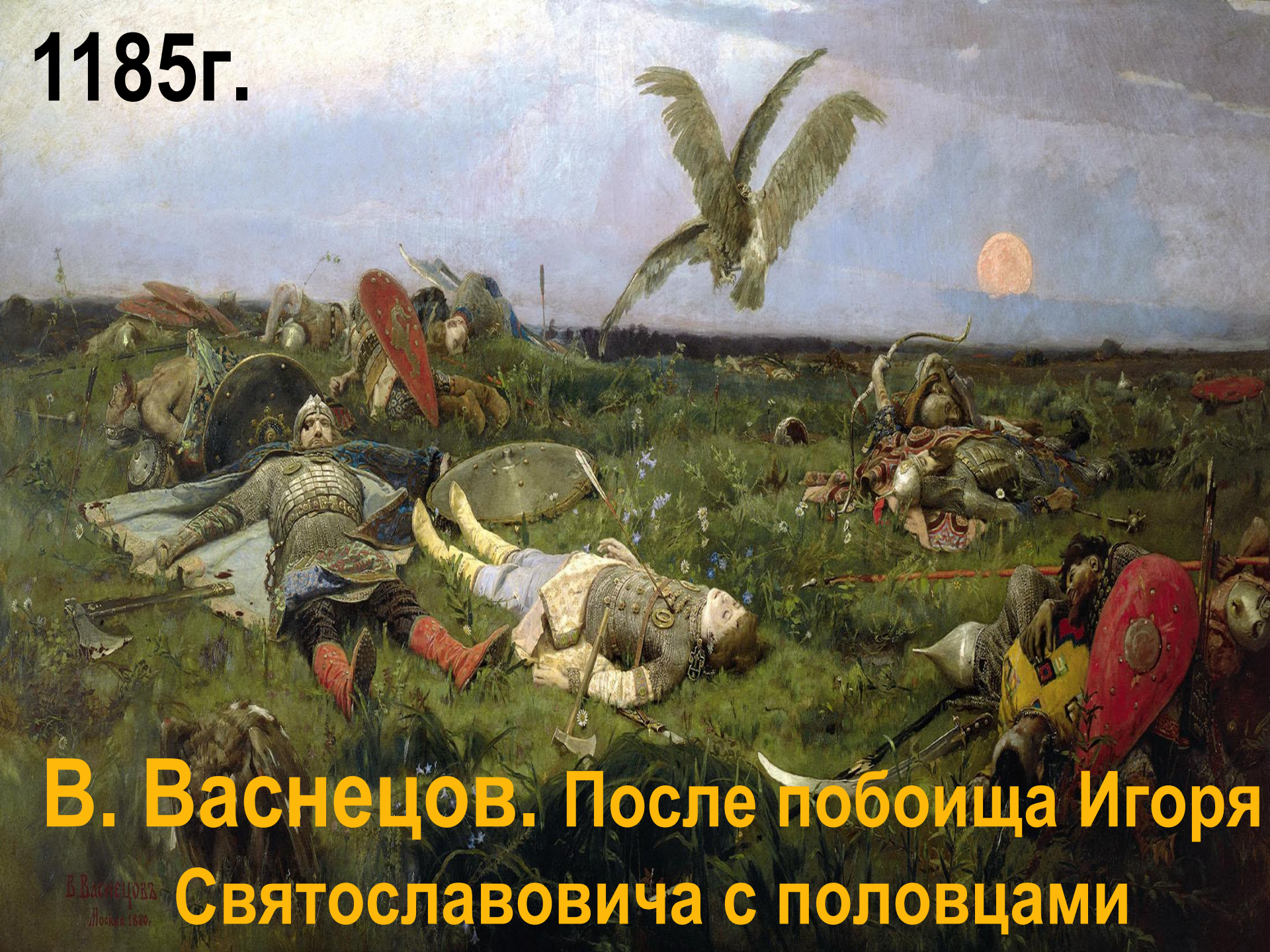
В. Васнецов. После побоища Игоря Святославовича с половцами