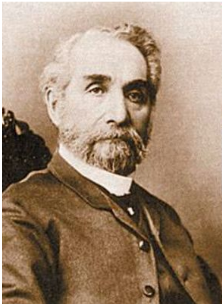
← Даниил Авраамович Хвольсон

В 1887 году в «Новом Времени» был напечатан перевод надписи, который сделал профессор Даниил Авраамович Хвольсон, один из основателей российской иудаики.