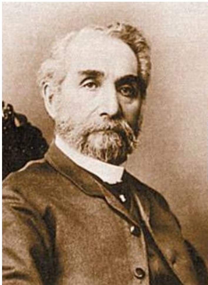
← Даниил Авраамович Хвольсон

В 1887 году в «Новом Времени» был напечатан перевод надписи, который сделал профессор Даниил Авраамович Хвольсон, один из основателей российской иудаики.