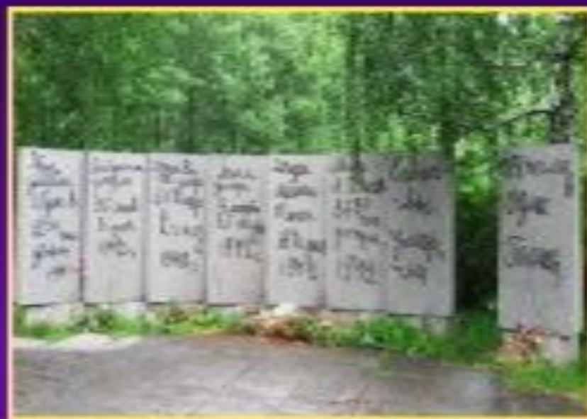
Памятник семье Савичевых

Таня Савичева жила в ленинградской семье. Началась война, затем блокада.