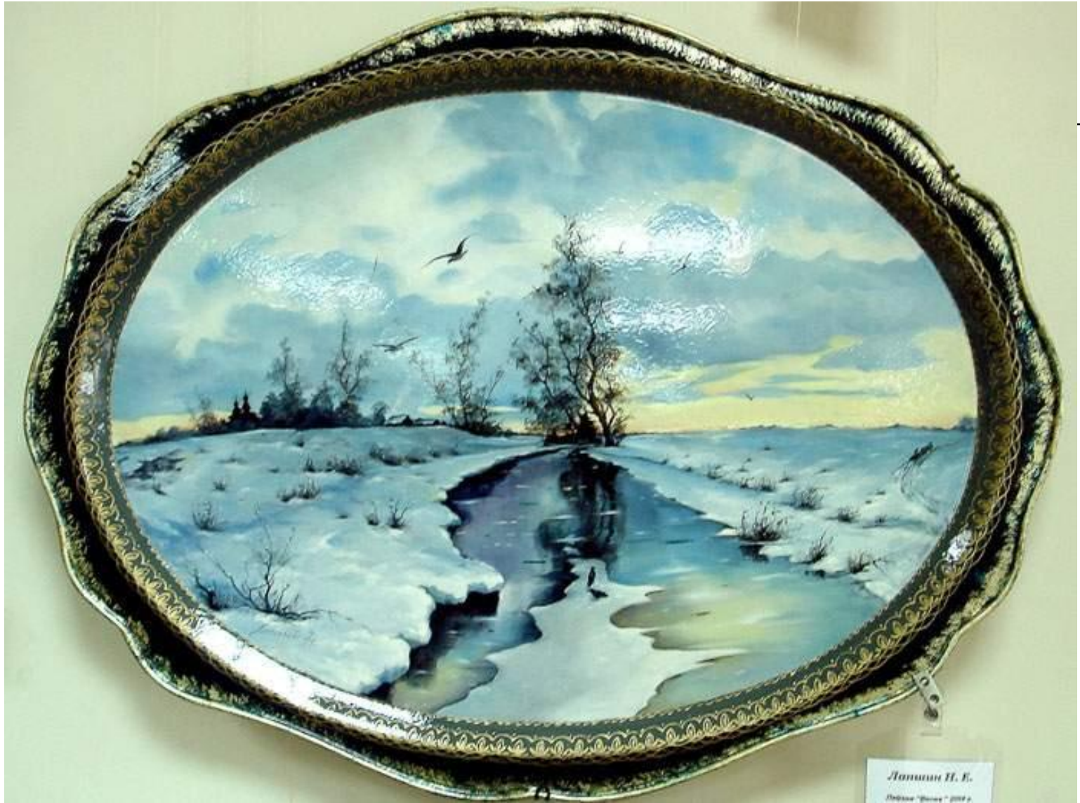
Литвиненко Н. В. Зима. "Зима" 2012 г.