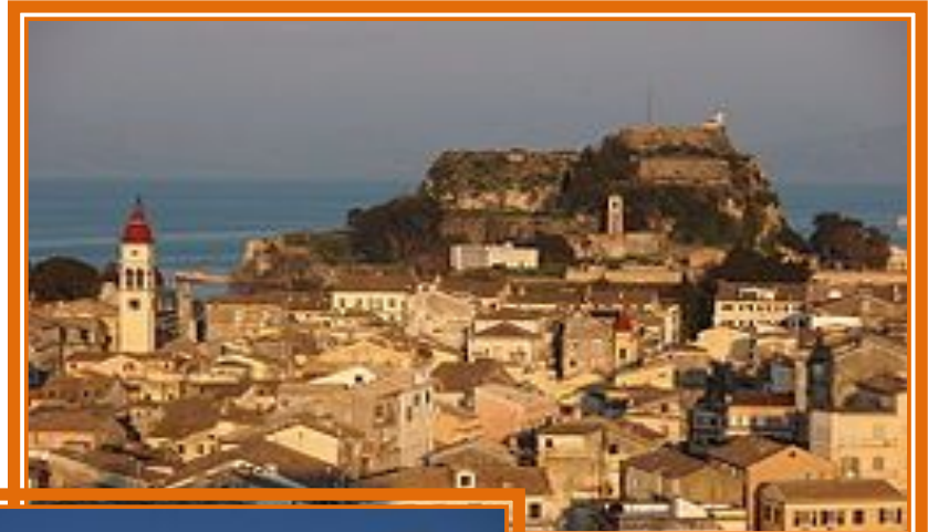
Старо місто Корфу