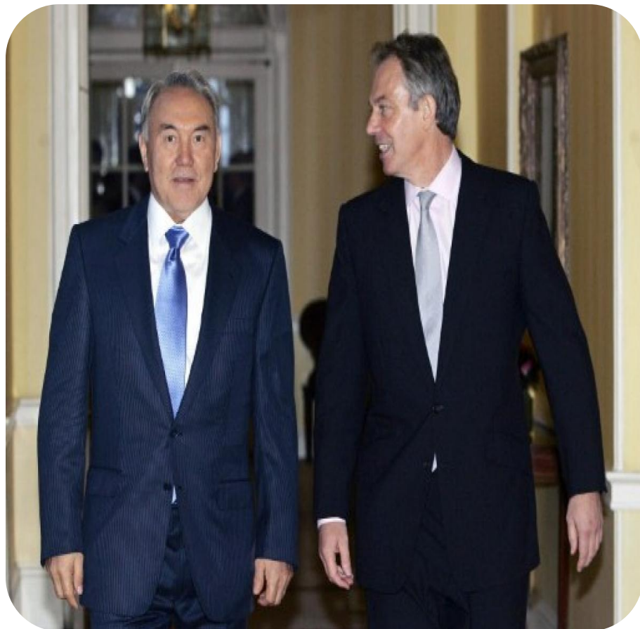
Нурсултан Назарбаев (президент Казахстана) и Тони Блэр