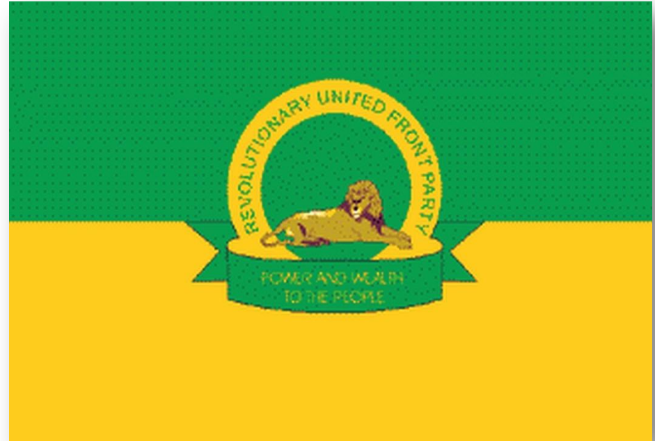
Флаг «Объединённого революционного фронта»