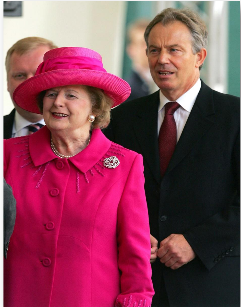
Маргарет Тетчер и Тони Блэр