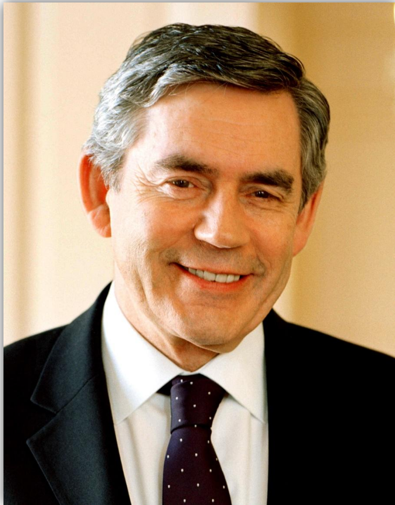
Гордон Браун (преемник Блэра )