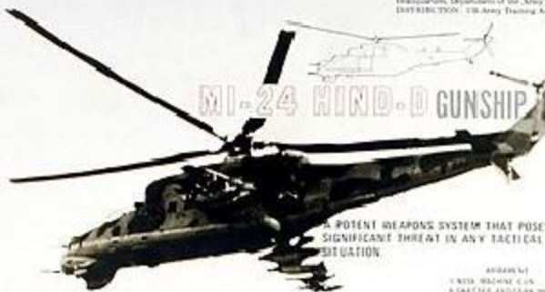
MI-24 HIND-D GUNSHIP

FOUR 23mm AA GUNS ON A COMMON MOUNTING. FOUR GUNS FIRE TOGETHER FOR MAXIMUM VOLUME OF FIRE. EMPLOYED AS LOW LEVEL AA BROOM PROTECTION.