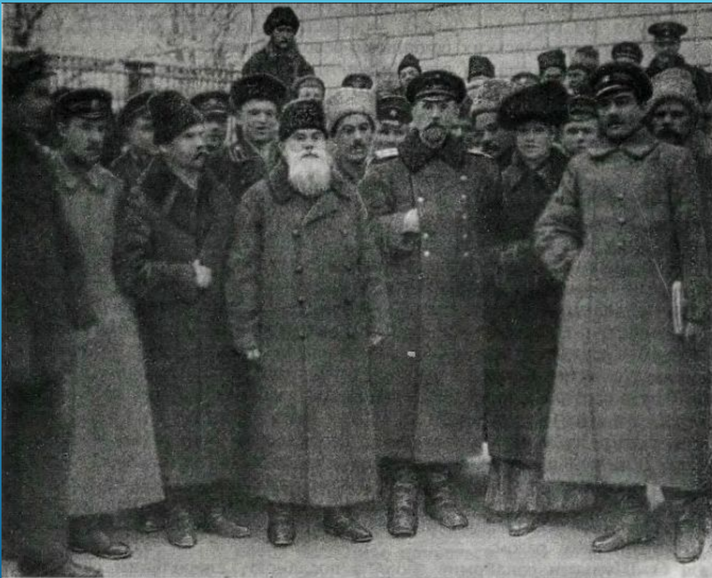
Голова Української Центральної ради М. С. Грушевський серед делегатів 8-ї сесії УЦР. Грудень 1917 р.