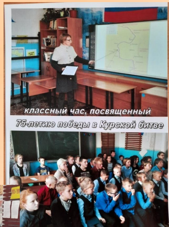
классный час, посвященный 75-летию победы в Курской битве