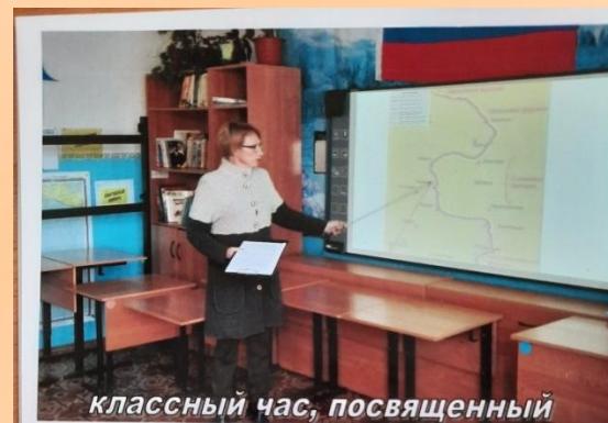
классный час, посвященный 75-летию победы в Курской битве