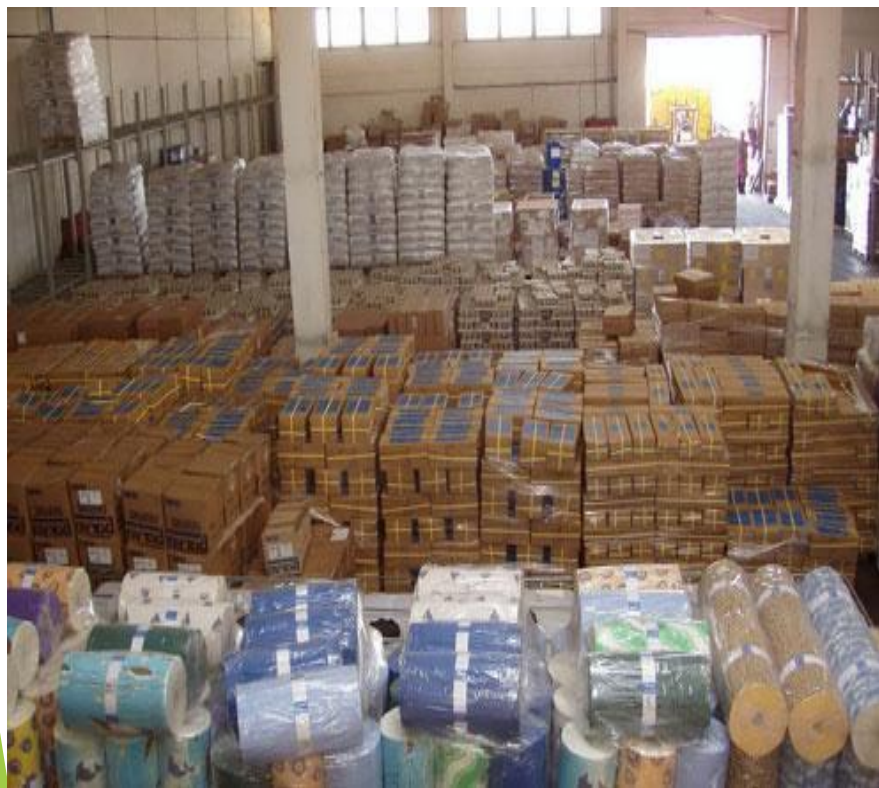
Участок краткосрочного хранения

Практикуется выделение участков краткосрочного и длительного хранения. На участках краткосрочного хранения располагают быстро оборачиваемые товары. На участках длительного хранения размещают как товары невысокого спроса, так и товары частого спроса, составляющие страховые запасы в дополнение к оперативным, находящимся на участке краткосрочного хранения.