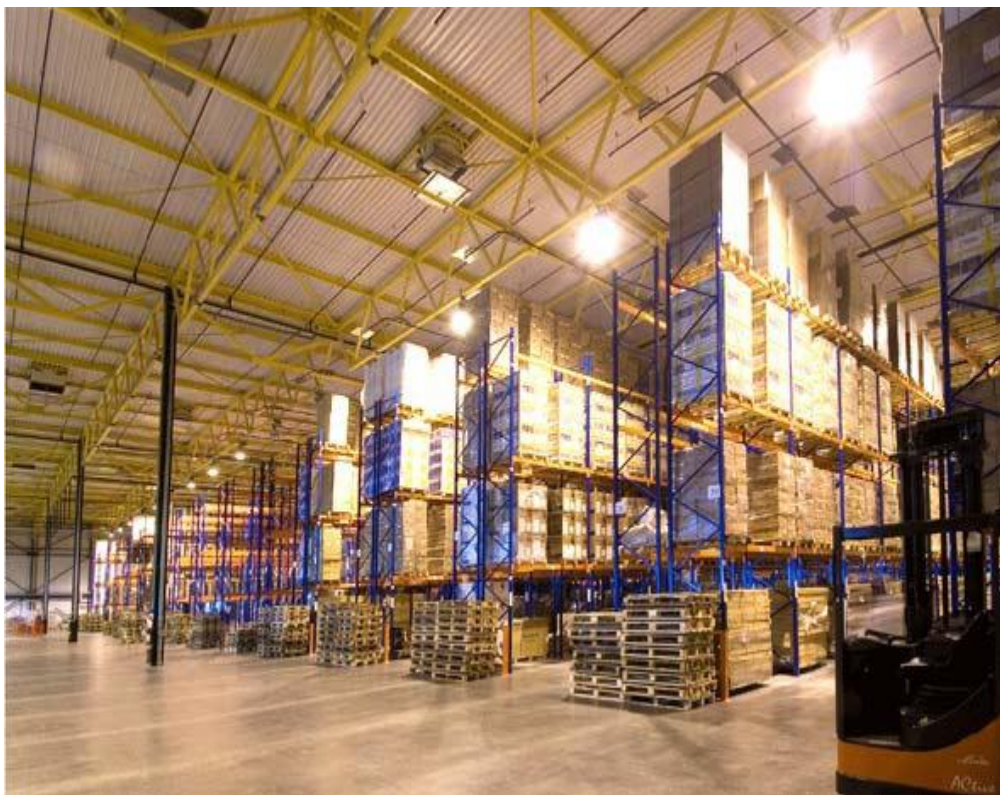
Участок длительного хранения