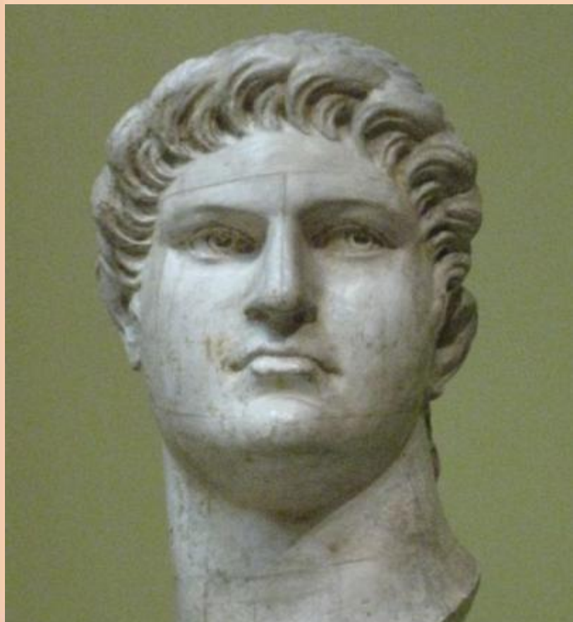
Бюст Нерона в Пушкинском музее

Самой зловещей фигурой среди императоров 1 в. н.э. был император Нерон .