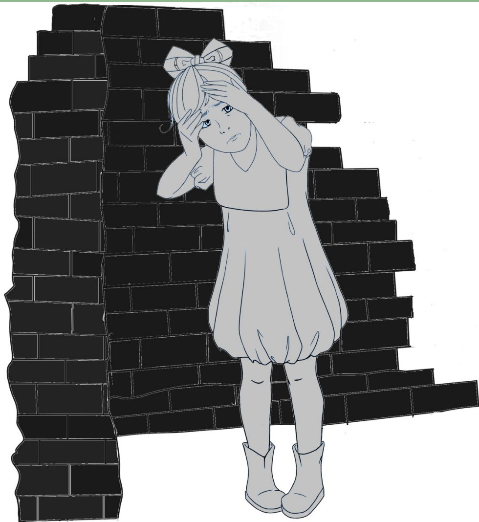
Макет памятника «Жертвам авианалёта на г. Чебоксары. 4 ноября 1941 г.»