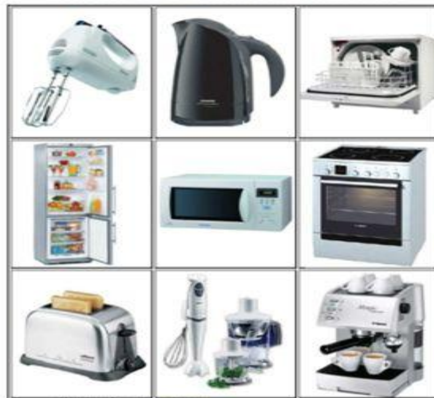
ЛОТО. ТЕМА "КУХОННЫЕ ЭЛЕКТРОПРИБОРЫ"

© 2008. Авторские права защищены. www.kalibron.ru