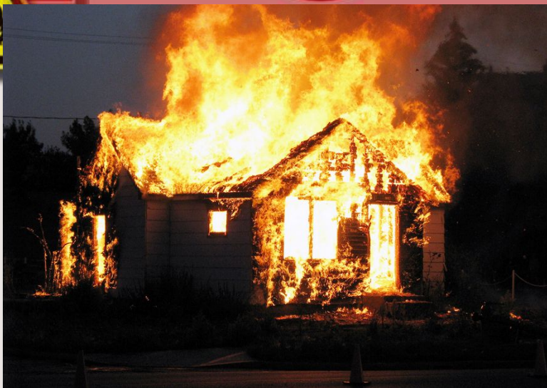
Разрушение зданий и сооружений