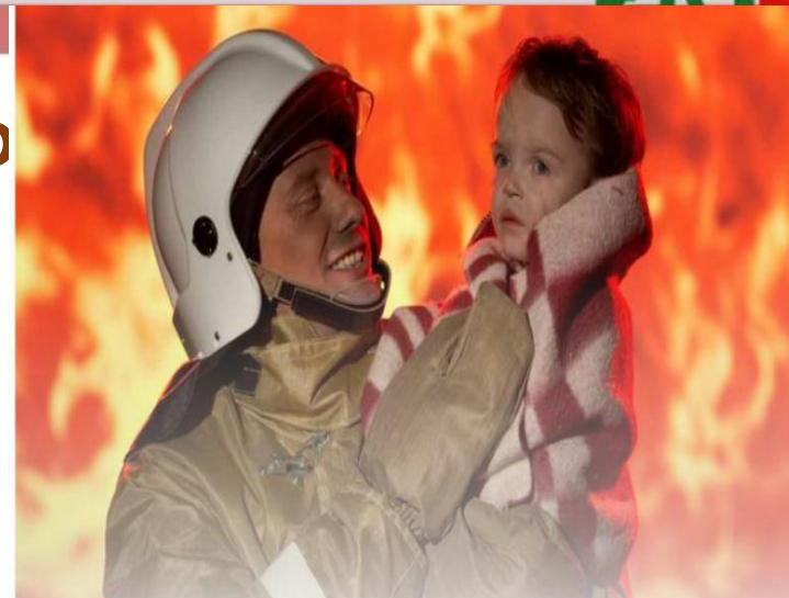
Травмирование и гибель людей