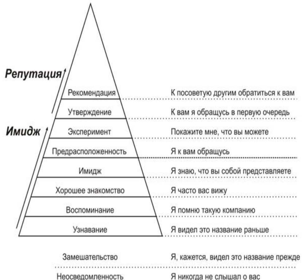
ПИРАМИДА: “имидж и репутация”

В современном мире любая уважающая себя компания нуждается в собственной положительной репутации. Люди, перед принятием решения о покупке товара или услуги, походе куда-либо, всегда ищут информацию о компании продавце. Естественно, необходимо заботиться о том, чтобы положительной информации о вашей компании было больше в процентном сочетании по сравнению с негативом, а ещё лучше, чтобы была только положительная информация. Конечно, было бы очень хорошо, если бы люди писали положительные отзывы. Но, к большому сожалению, люди весьма ленивы и положительные отзывы не пишут, как правило, этим занимаются пиарщики. Мы, являясь профессиональными пиарщиками, с разных IP адресов (более чем с 45), оставляем в медиaprостранстве примерно на сотне ресурсов положительные и хвалебные отзывы о вашей компании. Отзывы на многие годы остаются на всевозможных тематических форумах, специализированных ресурсах, группах и т.д. При наборе в любом поисковике названия компании, будет выходить масса положительных отзывов о самой компании и о продукции/услуге/мероприятии/акции.