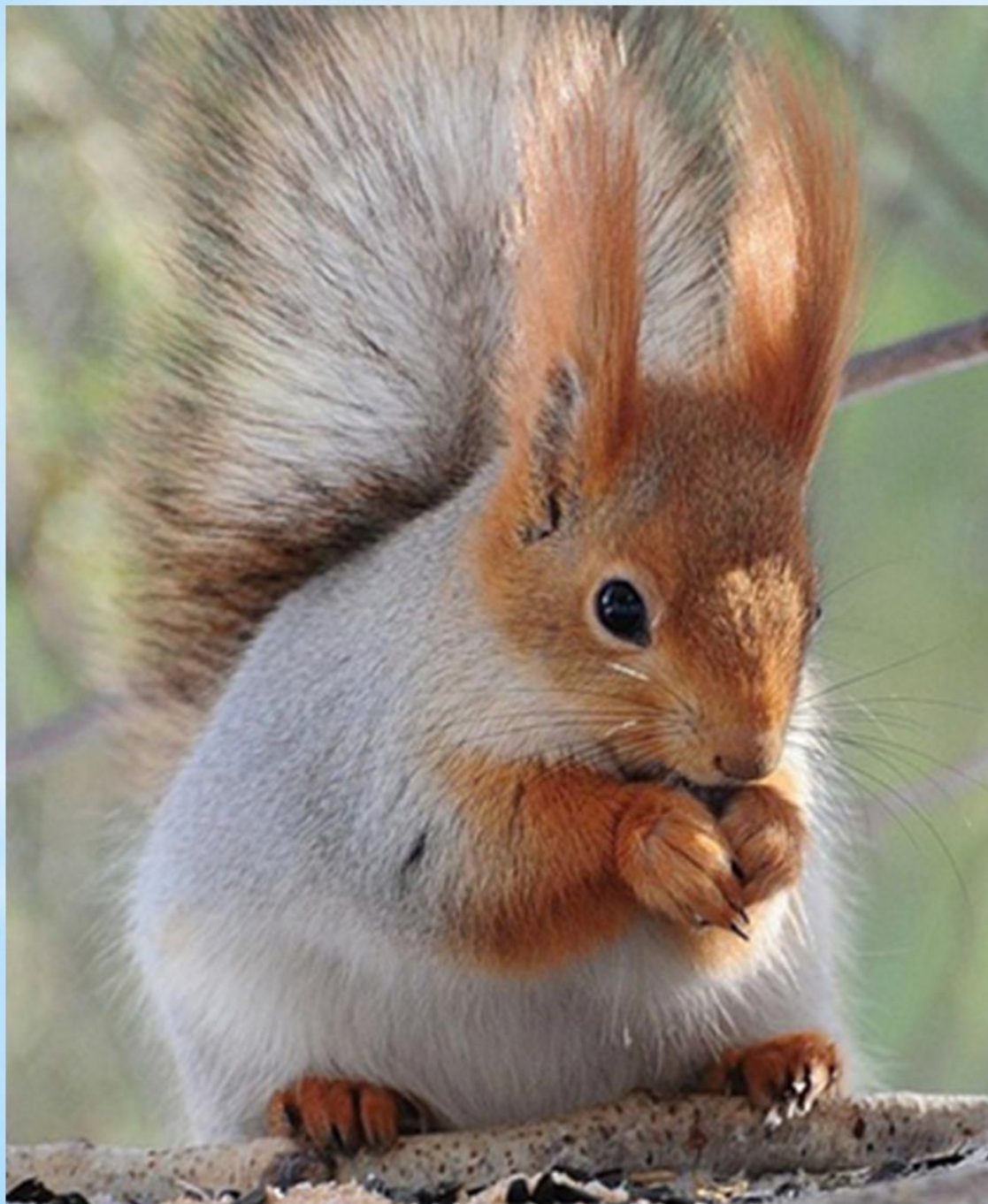
Белка - телеутка