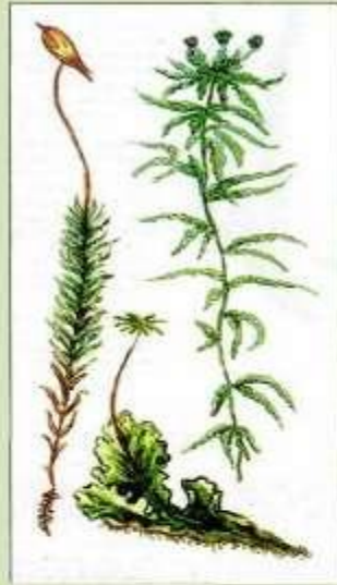
Мхи (кукушкин лен, Сфагнум, маршанция.)